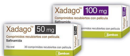
Figura 4. Presentación comercializada laboratorios Zambon.

España es el tercer país en el que está disponible Xadago® siendo los primeros países Suiza y Alemania cuyo lanzamiento se originó en 2015. (17)