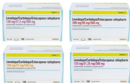
Figura 2. Stalevo® en forma genérica de laboratorios Ratiopharm.

Los efectos secundarios más comunes de Stalevo® (observados en más de 1 de cada 10 pacientes) son similares a los de levodopa/carbidopa e incluyen discinesias, náuseas, dolor abdominal, estreñimiento, mareos, cansancio, entre otros.