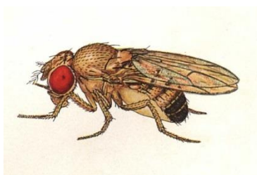
Figura 6. Drosophila melanogaster , modelo con la misma mutación que algunos pacientes de EP.

Se le puede denominar como ácido ursodesoxicólico. Es un ácido biliar que se encuentra en la bilis humana, y en grandes cantidades en animales como el oso pardo. Este fármaco ha estado en uso durante décadas para tratar enfermedades a nivel hepático. Se presenta como prometedor para frenar la progresión de la EP. (23)