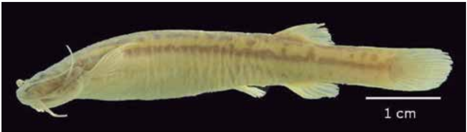
Figura 4. Sintipo de Trichomycterus transandianus (Steindachner, 1915), NMW 44475. Especie distribuida en los sistemas Magdalena.