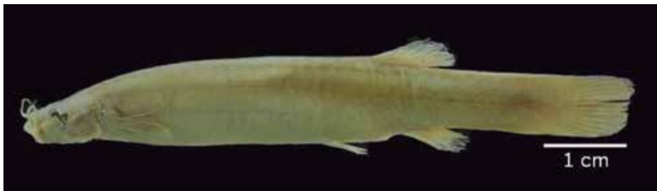
Figura 1. Holotipo de Trichomycterus taenia Kner, 1863, NMW 43389. Especie distribuida en los sistemas Magdalena, Cauca y Pacífico.

Tan solo cinco especies exhiben la más amplia distribución: Trichomycterus caliense , T. striatus y T. taenia (Figura 1), habitan las cuencas de los sistemas Cauca, Magdalena y Pacífico; y T. nigromaculatus y T. stramineus , ocurren en la cuenca de los sistemas Caribe, Magdalena y Pacífico. Otras especies que se presentan en cuencas compartidas son: Trichomycterus chapmani y T. spilosoma (sistemas Cauca y Pacífico), T. knerii (sistemas Magdalena y Orinoquía) y T. retropinnis (Figura 2) (sistemas Cauca y Magdalena).