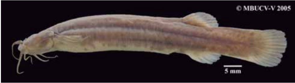
Figura 2. Topotipo de Trichomycterus retropinnis MBUCV-V-32797. Especie distribuida en los sistemas Cauca y Magdalena.

En cuanto a especies de distribución restringida, 13 están limitadas, a la cuenca del sistema Magdalena: Trichomycterus banneaui (Figura 3), T. bogotense , T. cahiraensis , T. latistriatus , T. romeroi , T. ruitoquensis , T. sandovali , T. santanderensis , T. sketi , T. stellatus , T. transandianus (Figura 4), T. uisae y T. sp 4 (sistema Magdalena); seis muestran distribución restringida, al sistema Pacífico ( T. dorsostriatus , T. gorgona , T. latidens , T. regani , T. unicolor y T. sp 2 ); tres, al sistema Caribe ( T. ballesterosi , T. maldonadoi y T. sp 3 ) y dos, al sistema Orinoquia ( T. migrans y T. sp 1 ).