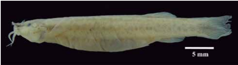
Figura 3. Topotipo de Trichomycterus banneaui (Eigenmann, 1912), CZUT-IC-1270. Especie distribuida en el sistema Magdalena.

En cuanto a especies de distribución restringida, 13 están limitadas, a la cuenca del sistema Magdalena: Trichomycterus banneaui (Figura 3), T. bogotense , T. cahiraensis , T. latistriatus , T. romeroi , T. ruitoquensis , T. sandovali , T. santanderensis , T. sketi , T. stellatus , T. transandianus (Figura 4), T. uisae y T. sp 4 (sistema Magdalena); seis muestran distribución restringida, al sistema Pacífico ( T. dorsostriatus , T. gorgona , T. latidens , T. regani , T. unicolor y T. sp 2 ); tres, al sistema Caribe ( T. ballesterosi , T. maldonadoi y T. sp 3 ) y dos, al sistema Orinoquia ( T. migrans y T. sp 1 ).