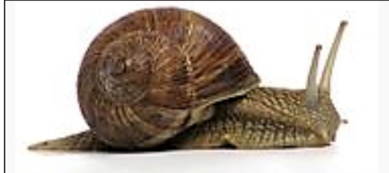
ካብ ዓሊታት ጋሳትሮፖዳ ዝኾነ ኣሪ

ብኩሕ ዝውደር ኣይኣቲ። እዚ ዝኾኑ ምክንያት ከኣ መዘኻታት ህዞን ዘበከ እኹል ሓሕራታን ገቕቲንን ዘይብሎ ብምጽንጻ ካልኣ ኣምራጺታት ናይ መገም ሰባዮን። ብምጽንጻ ካብ ገለ ምፍጻት ዓሊታት ጋሳትሮፖዳ ዝርቡ “ጸፍሪ” ወይ “ሕርን” ዝበል ጸጋሚ መሳል ጥሪ ሃር ገር ገምገራይ ተባሂሉ ዘይተኣደን እንሰላታት ይልቀሙ። እዚ ጥሪ ሃር ንመሰርሕ ጨና ዘበልግል ኮይኑ ልዑል መጠን ሸርጌ ዝርቡ ፍርገን። ብዘወገኹ ናይቶም እንሰላታት ደርጊ ንመሰርሕ ሞልጎም የለዎል። ሰቢ እዚ ኣብ ግምት ብምእታው ከሎ ኣብ ሕብረተሰብ ብፍላይ ኣብ ገምገማ ባሕሪ ዝኮር ህዞን፣ ገምገማን ናብ መጽኢ ወለዶ ከይሰረሰ ከምዘኾኑል ኣብ ምግብን እጅሙ ከርክቡ ይኾኑ።