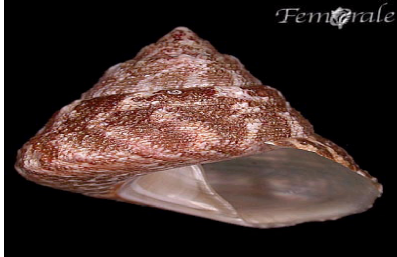
ንመሰርሕ መልጎም ዝጠቅም ጋሳትሮፖዳ