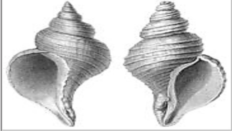
ሕርን ወይ ጸፍሪ ጋሳትሮፖዳ