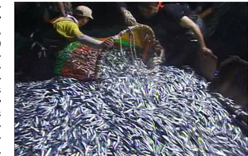
ምርኩስ ደቀቅቲ ግሉት ካብ ባሕር ኣርጋ፡፡