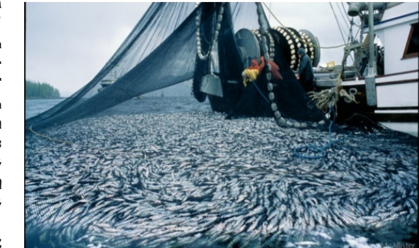
ዘመናዊ ኣጋፍቶ ደቀቅቲ ግሉት ላዕለዎይ ጽፍሐ ባሕር

እዚ ስጅ ከም መሰርሕ ምዃራ ከይቲ ዘበልዎ ዘሉ ማምገ ሰባት እንተኾነውን ኣብ ሰላታት ዝተገበረ መዳደት ብምዃን "ኣተኣምን" ክበል ኣይክሉን፡፡ ደቀቅቲ ግሉት ላዕለዎይ ጽፍሐ ባሕር ቀንዲ ምዃራ ዝተገለጹ መዳደት መጠን ማለት ከም ኣሚጋ 3 ፋቲ ኣሳድ፡ ሳይታሚን ቢጋ መዳደት ካልኸም ፖታሽም ፎስፎርስ ወዘተ ብምዃናም ኣብ ጥፃን ህገዳት ኣትኩስ ደቂሰብን ሕብተራ ይጻወቲ፡፡ ስራት ግላ ኣርጋ፡፡ ከምዚ ከሉ ጸላታት ብጠብይ ምዃራ ዘተላፍ ገዢን ደከሩ ብመዳ ከናትን ካልኣት መሰርሕን ተጻልፎ ዝገኘሉ ብምዃን ከምዚ ዝደለ ቀርብ ግላ ኣሎ ክበል ኣይከሉን፡፡ እንተኾነ እዚ ስጅ ጸጋታት ሃብቲ ባሕር ብጻላይ ደቀቅቲ ግሉት ላዕለዎይ ጽፍሐ ባሕር ኣብ መዳ፡፡ ብጠንኦ እንተ ተመሓዳሪን ተመዘገቡን ኣብ ምርጫ ወሕሰት መዘከራ ምዃራ ደርባን ክበል ኣይከሉን፡፡