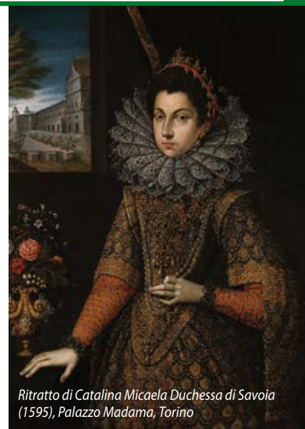
Ritratto di Catalina Micaela Duchessa di Savoia (1595), Palazzo Madama, Torino

Si sa che alla fine del 1700 a Torino si producevano circa 350 chilogrammi al giorno di cioccolato : era la capitale europea di questa nuova delizia. In una sola forniture, nel 1773, si arrivò a fabbricare 13 quintali di cioccolato per gli appetiti dei regnanti e dei nobili. Nel contempo, sorsero anche i primi caffè storici , per i quali il capoluogo piemontese è ancora famoso, de-