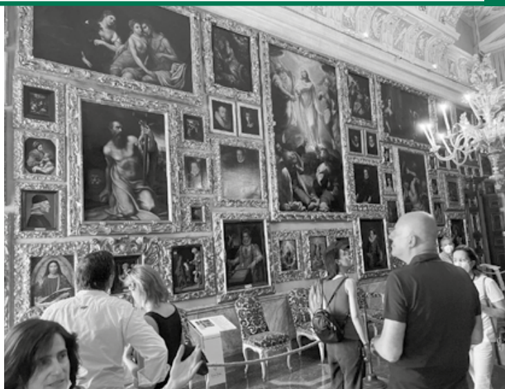
Visita al Palazzo Borromeo

(MIPAAF) e la proposta di collaborazione con il Ministero degli Affari Esteri e della Cooperazione internazionale (MAECI) per promuovere insieme progetti e attività di sviluppo finalizzati a valorizzare il patrimonio enogastronomico italiano. Entrambi gli accordi sono un importante segno di collaborazione fattiva con la Pubblica Amministrazione che riconosce all'Accademia il ruolo di ambasciatrice della cucina italiana. Il Presidente ha così sensibilizzato i Delegati a intensificare e ampliare i rapporti con le Istituzioni.