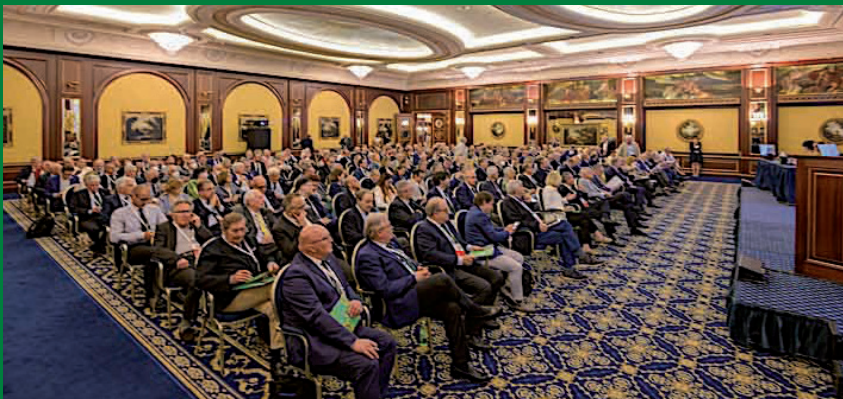
Un momento del Forum dei Delegati