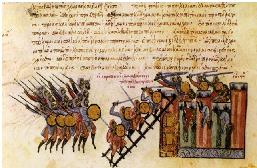
La presa di Siracusa secondo il miniaturista medievale Giovanni Scilitze

Sono davvero tanti i punti comuni tra la cucina siciliana, mediterranea per eccellenza, e quella araba. Non solo nei prodotti, come abbiamo visto; non solo nelle ricette, come vedremo; ma anche, e soprattutto, nelle caratteristiche di fondo delle due arti culinarie. Si tratta di due cucine prevalentemente vegetariane: l'una ha messo a disposizione i prodotti più tipici derivanti dal suo clima, in prevalenza ulivo, cereali e vite, l'altra vi ha immesso tutti i suoi vegetali provenienti dai più disparati e lontani luoghi, come spinaci, melanzane, pomodori, patate, peperoncino, spezie. Entrambe, sono cucine "lente" , che hanno bisogno di tempo: le loro ricette tradizionali sono complesse e richiedono cotture lunghe affinché i vari ingredienti possano raggiungere un perfetto equilibrio di sapori. Entrambe esigono che i cibi siano ben cotti. I mediterranei non sopportano i cibi poco cotti come, per esempio, la carne al sangue, anche quando cotta ai ferri. La cottura degli alimenti dell'una e dell'altra richiede spesso più di una tecnica: lo stesso ingrediente è prima rosolato e poi cotto a fuoco lento, oppure prima bollito e poi passato in padella o al forno.