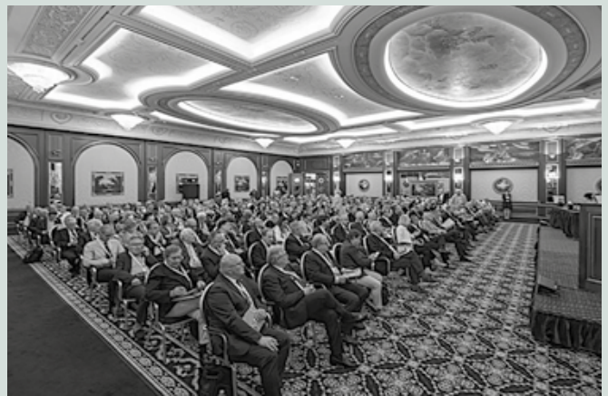
The Academician as the driving force of Academic life

The meeting in Baveno, in a climate of friendship and pure enthusiasm, highlighted the Academy's ability to keep pace with the times, thanks in great part to the spirit of sharing common to all its members.