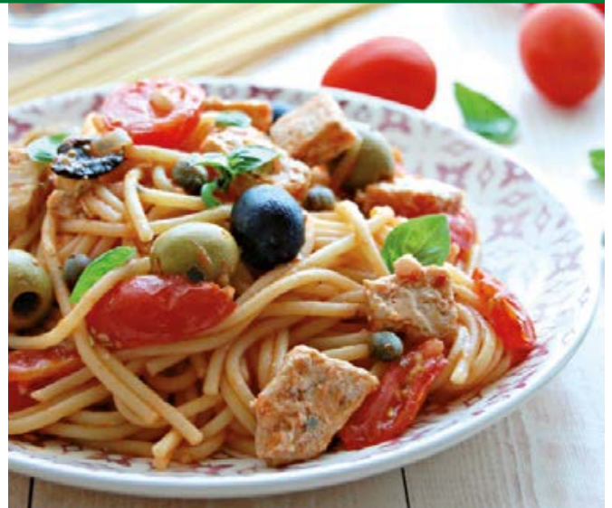
Spaghetti alla ghiotta

li); del portuale o del muratore, il condimento principe per imbottire i panini della "pausa pranzo", ante litteram . A tale farcitura spesso era preferito lo spezzatino (poco) con le patate (molte), che era, con il pesce stocco, l'altra pietanza di punta di un'antica putia (bottega) messinese, " don Pitruzzu all'Opira ", frequentata assiduamente da tali lavoratori.