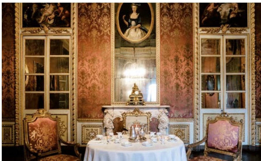
Mostra “Splendori della tavola”, Palazzo Reale

In realtà, a Firenze, tutto si conclude rapidamente, mentre fu Torino la prima città ove si sviluppò la “cioccolatoomania” tra nobili e clero , come dimostra anche lo sviluppo successivo dell'industria dolciaria.