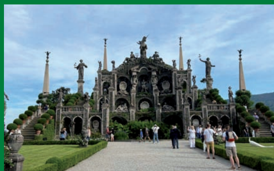
Palazzo Borromeo all'Isola Bella