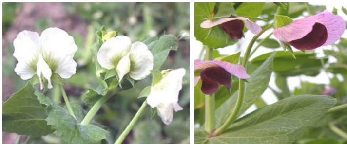
Рис. 1. Две формы гороха посевного с альтернативной окраской цветков (наследуется по моногенной схеме).

Наследственность типа Pisum . Факты передачи дискретных признаков в ряду поколений репродукции у гороха посевного (рис. 1) и некоторых других видов растений оказались столь убедительным, что позволили сформулировать три закона (правила) наследования по Менделю. Первый — закон единообразия гибридов первого поколения F_1 , или закон доминирования, согласно которому при скрещивании двух гомозигот все гибриды F_1 единообразны по генотипу и фенотипу, а при гаметогенезе у гетерозигот в каждую из гамет с равной вероятностью переходит один из двух факторов (аллелей), определяющих признак; второй — закон расщепления (при скрещивании двух растений F_1 или их самоопылении примерно четвертая часть потомков обладает рецессивным признаком) (см. рис. 1); третий — закон независимого наследования отдельных признаков (24, с. 390).