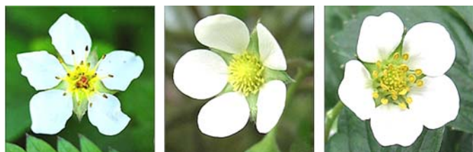
Рис. 6. Цветки земляники (род Fragaria ) — андроцеевый, гинецеевый и гермафродитный (слева направо).

Система репродукции семян у растений земляники (род Fragaria L.) (сем. Rosaceae ). Принимая во внимание тот факт, что в роде Fragaria имеется нескольких раздельнополых видов, принято считать, что репродукция семян у земляники осуществляется при перекрестном оплодотворении. Обоеполые (гермафродитные) цветки встречаются лишь у диплоидных видов (94), а в популяциях полиплоидных видов наряду с растениями, формирующими обоеполые цветки, имеются растения как с чисто гинецеевыми, так и с чисто андроцеевыми цветками (рис. 6). У земляники к тому же встречается мультивидуальная изменчивость — «есть сорта крупноплодной земляники, имеющие на одном соцветии все три типа цветков» (94, с. 107).