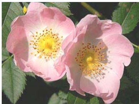
Рис. 7. Цветки пентаплоидного шиповника Rosa canina , формирующего анизогамные мега- и микроспоры (97).

В других аналогичных экспериментах при опылении цветков крупноплодной земляники F. ananassa L. пыльцой отдаленного вида гусиной лапчатки ( Potentilla anserine L.) в семенных потомствах, получаемых за счет псевдогамного оплодотворения, наблюдается автосегрегация по базовым репродуктивным признакам — по полу цветков и ремонтантности. Это означает, что партеногенетические семенные потомства, полученные от чужеопыления и псевдогамного оплодотворения, развились из генеративных клеток зародышевых мешков, прошедших мейоз. В силу полиплоидности генома F. ananassa ( 2n = 8x = 56 ) сегрегация по маркерным признакам осуществляется по полисомическому типу (95, 96) и аналогична той, что описана при автосегрегации у сахарной свеклы (71).