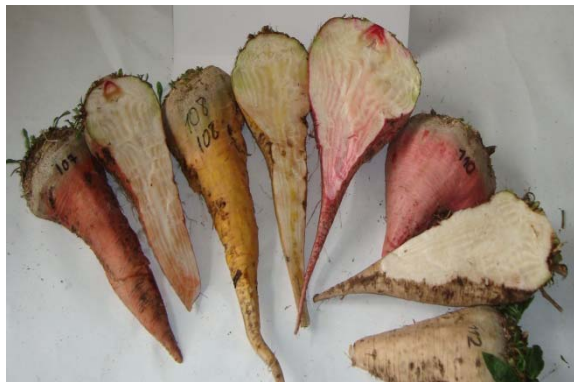
Рис. 4. Эпигенетическая изменчивость по окраске кожицы и мякоти корня в апозиготическом потомстве сахарной свеклы (70).