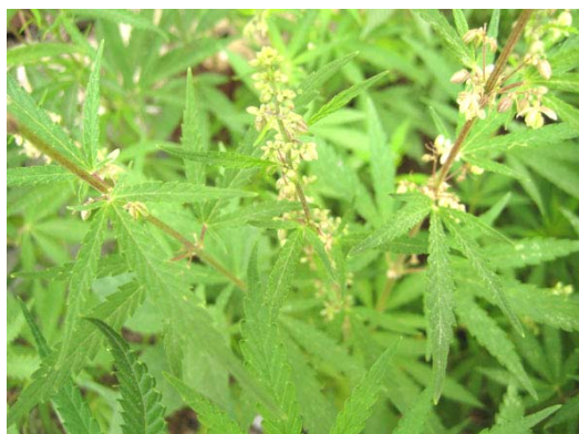
Рис. 5. Цветущие растения конопли ( Cannabis sativa L.).

ме. В частности, от материнского растения с белыми корнями возникли растения, корни которых имеют красную (розовую) или желтую окраску. Анализ автосегрегации по признакам окраски показал, что наблюдаемый феномен, вероятно, связан с активацией локуса Pp , контролирующего синтез пигментов у различных форм свеклы. Это значит, что в апозиготическом потомстве произошла активация генов окраски, то есть имеет место эпигенетическая изменчивость (70, 90), которая в половых потомствах не проявлялась. Если в менделевских расщеплениях на горохе по моногенно наследуемому маркерному признаку возникают пропорции генотипов 1AA:2Aa:1aa (или 3:1), то в апозиготических потомствах у свеклы мы имеем дело с соотношением 3AA:8Aa:3aa (или 11:3) (83, 84). Следовательно, получение семян у свеклы включает как систему воспроизводства, аналогичную таковой для гороха (двуродительский способ), так и характерную для ястребинок (партеногенетический способ). Примеров подобного полиморфизма в способах воспроизводства семян у растений, вероятно, существует множество.