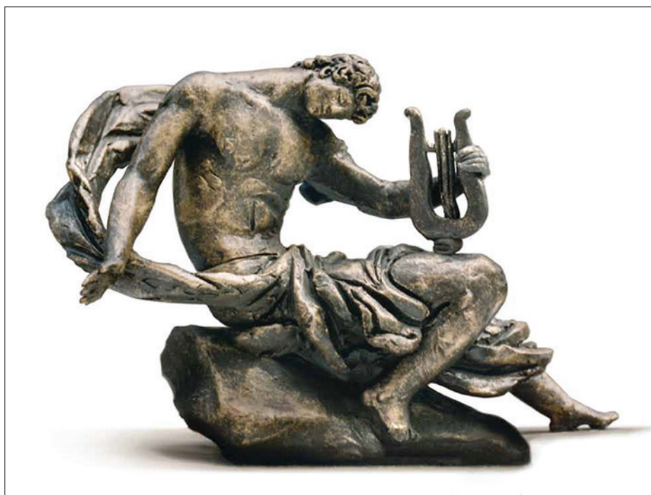
Iurie Canașin. Orfeu. 2011, plastilină.