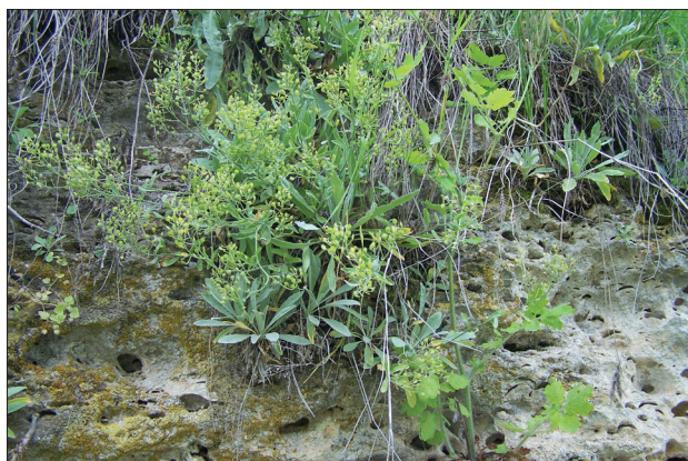
Foto 7. Schșiverechia podoliană ( Schivereckia podolica (Bess.) Andr. ex DC.).

introduse în Lista plantelor rare protejate de stat , dintre care ultimele 6 specii sunt incluse în Cartea Roșie a Republicii Moldova (2015).