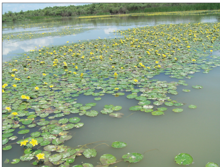
Foto 9. Rezervația Prutul de Jos (comunități de plutică Nymphaeoides peltata ).