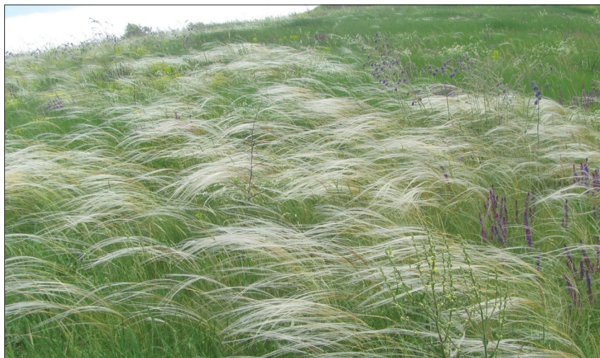
Foto 3. Aria protejată Pajiștea Bugeac.

De menționat că după componența și structura comunităților de plante se delimitează pajiști de stepă și pajiști de luncă. Deși pajiștile au preponderent o menire utilitară, fiind folosite pentru pășunatul animalelor și producerea de furaje, ele oferă dintotdeauna o mostră de frumusețe și biodiversitate a florei spontane, natura conservând prin ele multe specii de plante valoroase. Cercetările recente privind pajiștile din Republica Moldova confirmă faptul că, în pofida unui management irațional pe parcursul mai multor decenii, s-au mai păstrat mici suprafețe cu floră spontană și faună sălbatică de importanță deosebită [14].