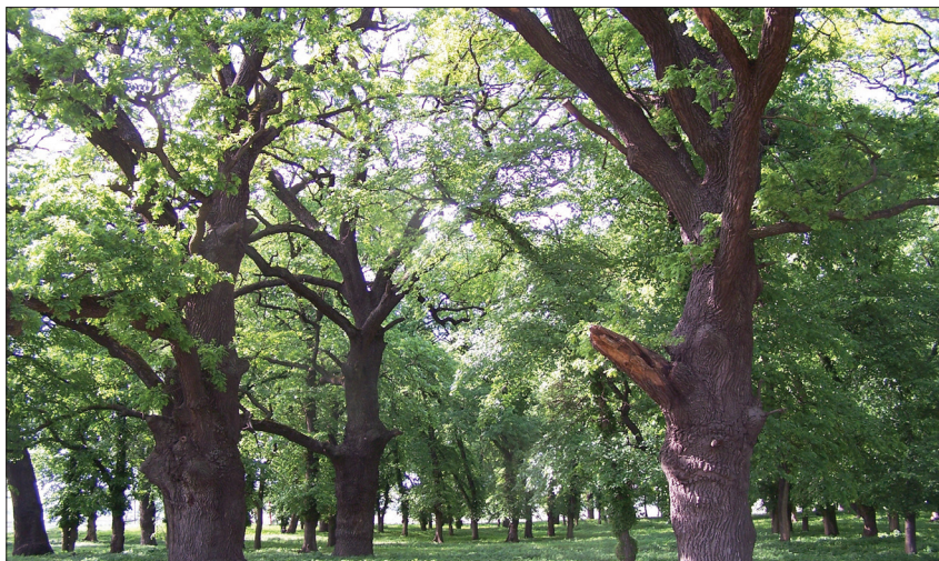
Foto 2. Aria protejată Pădurea de stejari seculari Pogoreloe.

În 1975–1985 s-a acordat prioritate culturilor de arbuști fructiferi, în conformitate cu Programul alimentar al URSS (1982–1990). În această perioadă au fost defrișate un șir de suprafețe de păduri și plantate cu salcâm, rășinoase, arbori și arbuști fructiferi. În majoritatea cazurilor se plantau păduri fără a ține cont de biologia speciilor și condițiile stațiunii. În consecință, s-au creat arborete mai inferioare decât arboretele autohtone. S-au format astfel multe suprafețe cu arborete slab productive, slab rezistente la condiții climaterice extreme.