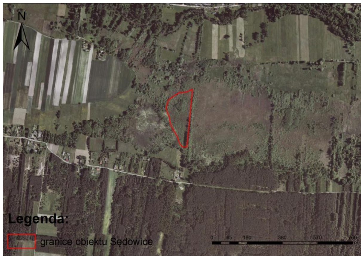
Ryc. 2. Lokalizacja obiektu na podkładzie ortofotomapy