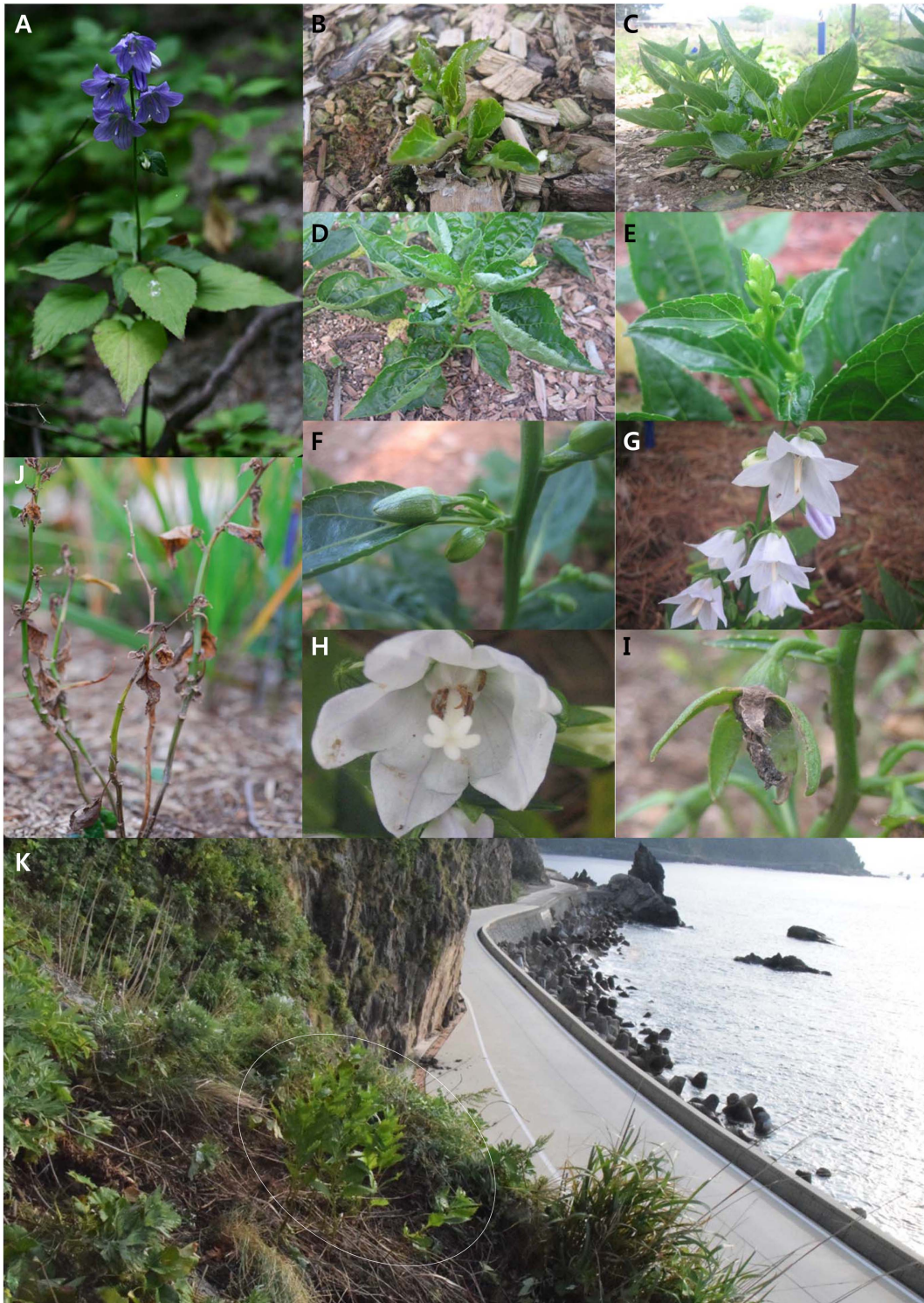
Figure 3. (A) A habitat of A. erecta in Taeha-ryung. (B~I) Growing stages of A. erecta . (B) A growing stage of shoot. (C) A growing stage of lower cauline leaves. (D) A growing stage of upper cauline leaves. (E) A growing stage of floral bud. (F) A stage just before the flower opening. (G) A stage of matured androecium. (H) A stage of matured gynoecium. (I) A stage of fruit maturation. (J) Dried stems after leaves are fallen. (K) Restored original habitat of A. erecta (white circle) using propagated young plants.