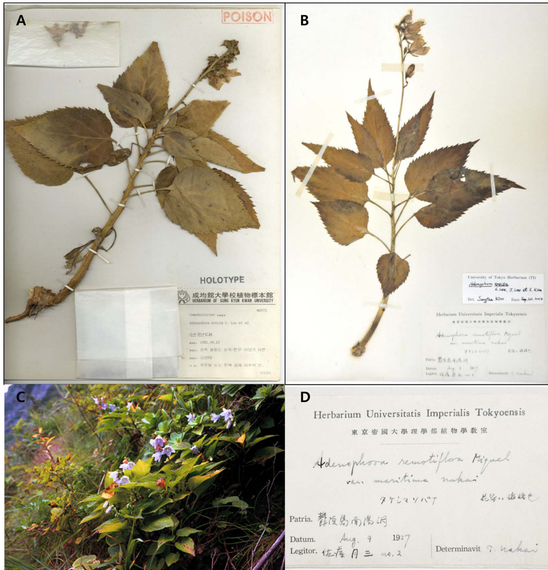
Figure 1. (A) A holotype of A. erecta . (B) A historic collection of A. erecta identified by T. Nakai which is deposited in the herbarium of Tokyo University (T). (C) Original habitat of A. erecta in the type locality (coastal cliff of Sokpo-dong, Ulleung island). The photograph was taken in 1994, and this site is now destroyed. (D) Close-up of specimen label of (B).

도 북면 천부리의 석포동 해안절벽으로(그림 1C와 그림 2A), 이곳에 10여 개체 만이 분포한다고 보고된 바 있다(Lee et al., 1997). 그러나 2003년 울릉도 근해를 지나간 태풍 매미의 영향으로 울릉도 석포동 일대의 해안도로가 파괴되었고, 해안도로 안쪽의 절벽에 위치한 최초 발견 서식지는 해안도로의 확장 및 복구 과정 중 완전히 파괴되어 콘크리트 옹벽이 되었음이 최근 확인되었다. 이후 이 종은 극소수의