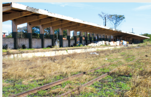
A foto foi tirada da Rede Transmissão na cidade de Manduri, e encontrava-se completamente desligada.