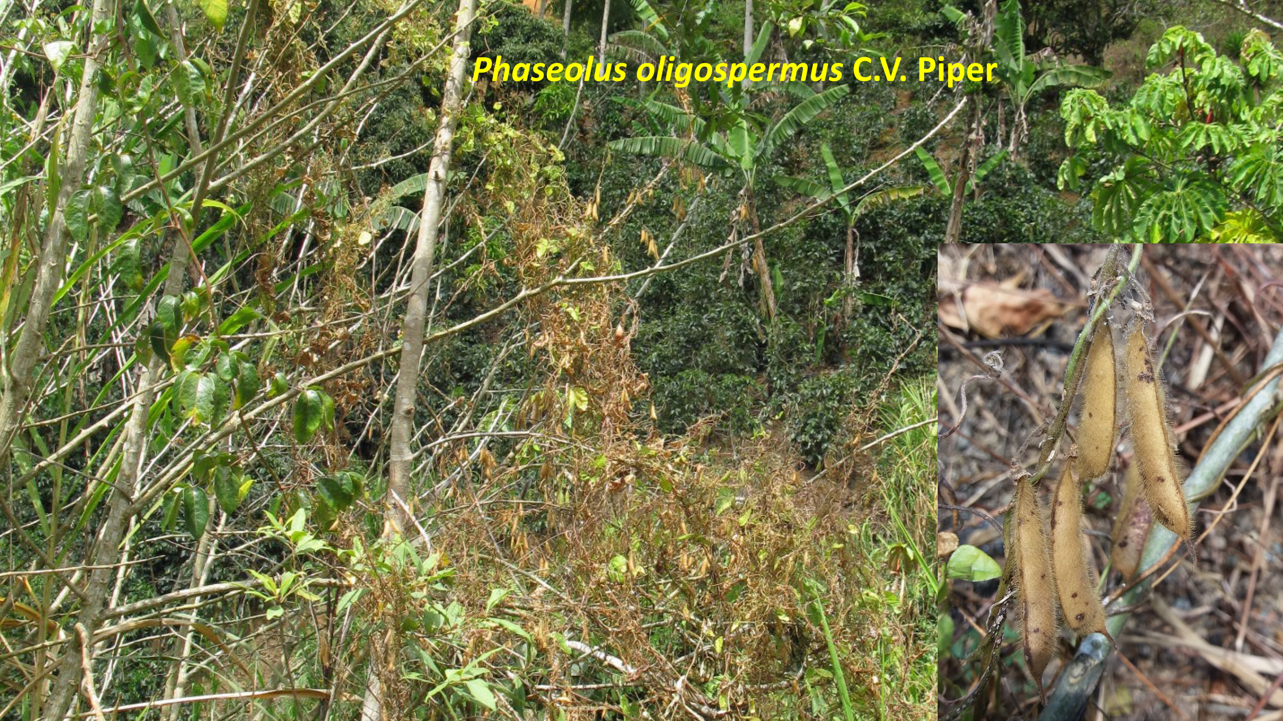
Phaseolus oligospermus C.V. Piper