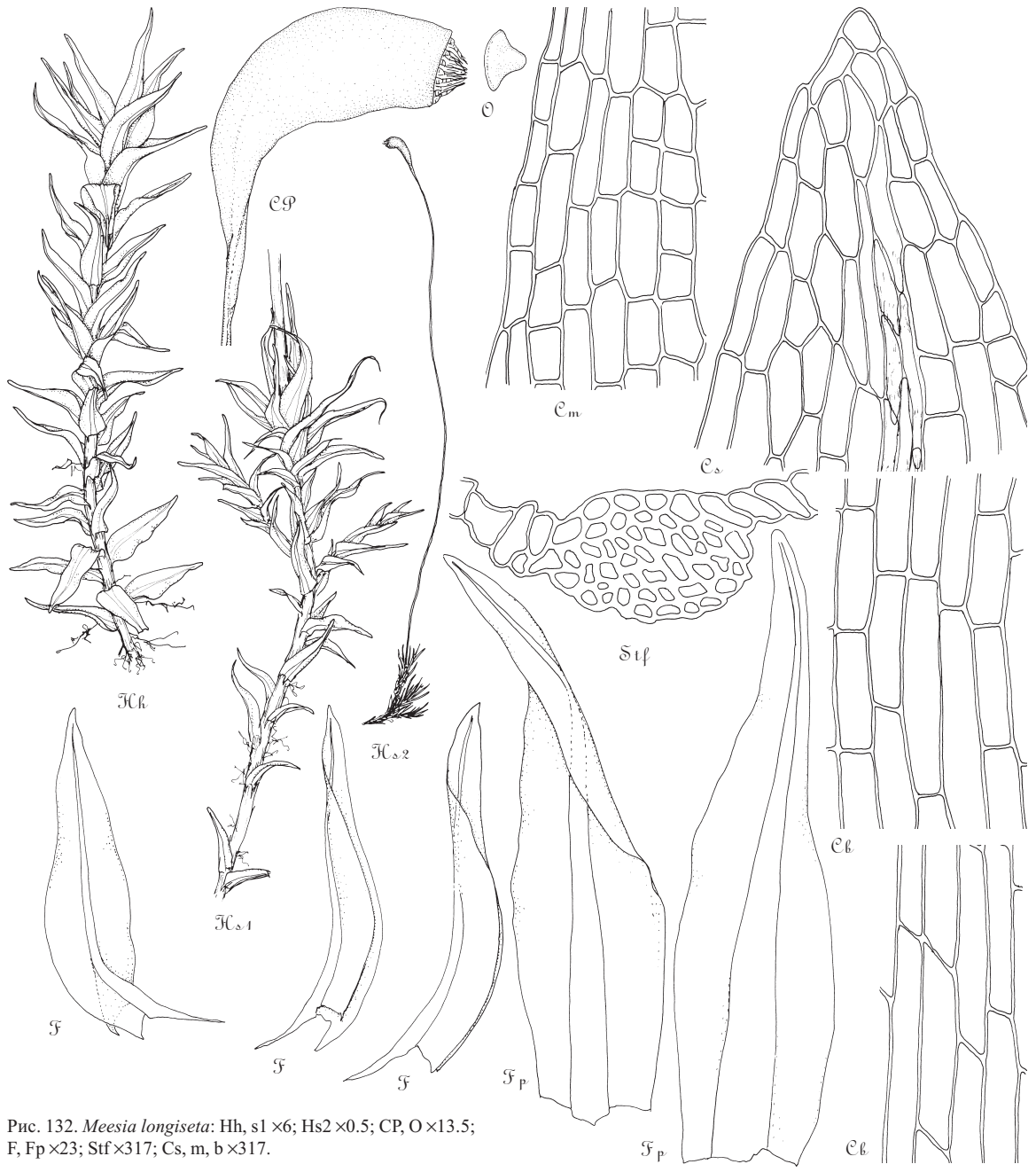
Рис. 132. Meesia longiseta : Hh, s1 \times 6 ; Hs2 \times 0.5 ; CP, O \times 13.5 ; F, Fp \times 23 ; Stf \times 317 ; Cs, m, b \times 317 .