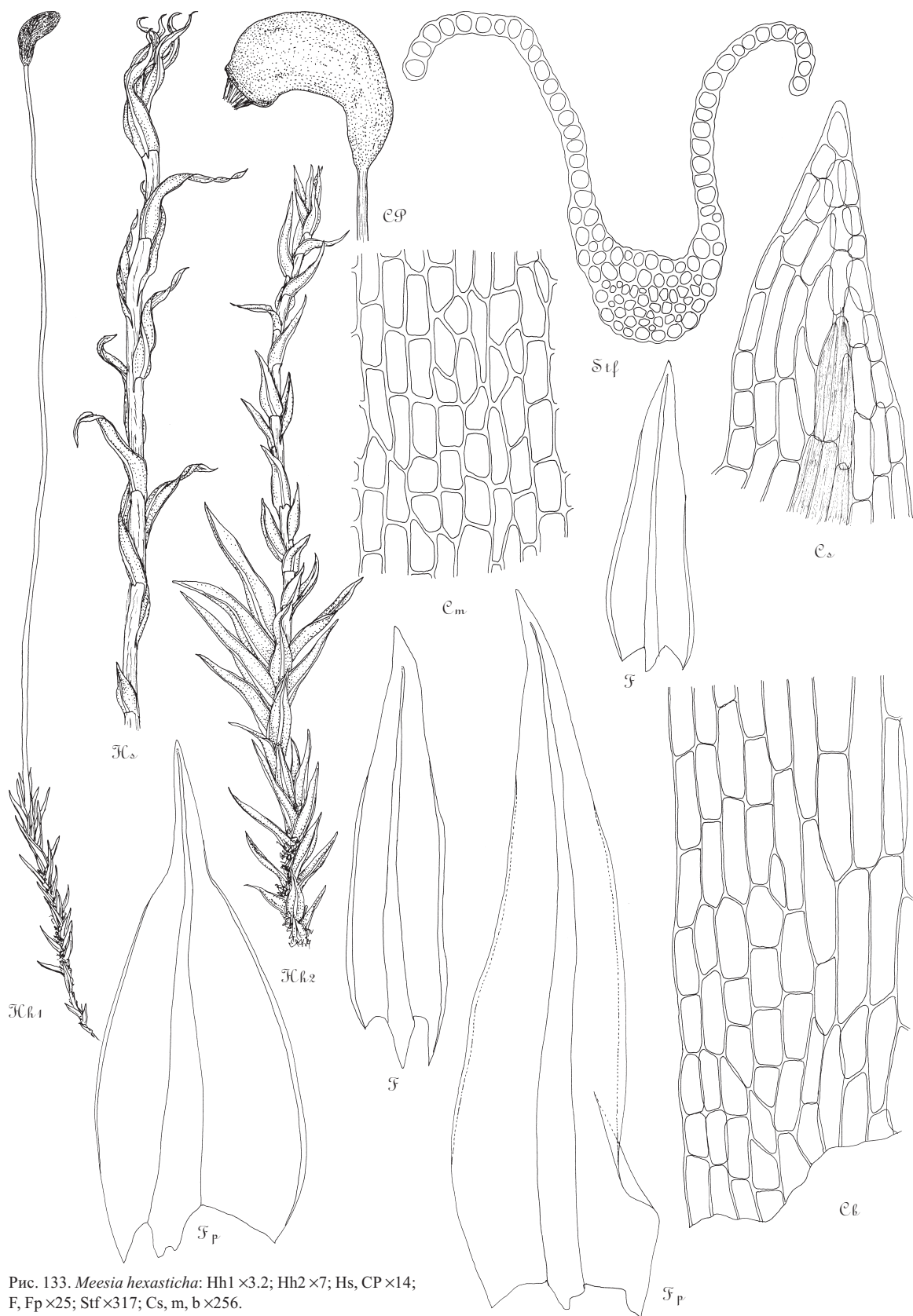
Рис. 133. Meesia hexasticha : Hh1 \times 3.2; Hh2 \times 7; Hs, CP \times 14; F, Fp \times 25; Stf \times 317; Cs, m, b \times 256.