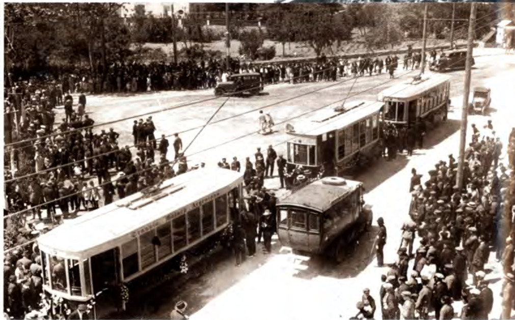
Els tramvies número 2, 3 i 1 el dia de la inauguració de la línia, el 27 de maig de 1928.