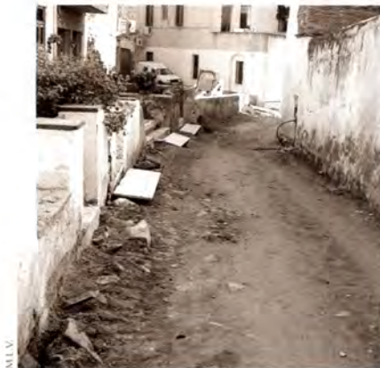
Estat de les obres al Dolors Monserdà.

La segona quinzena de febrer van començar els treballs de construcció d'un nou clavegueram al carrer Dolors Monserdà. Les obres, que afecten el tram