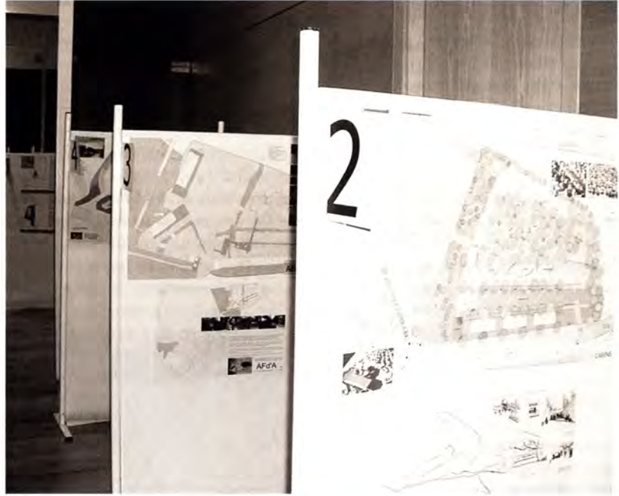
L'antic Ajuntament va acollir l'exposició dels projectes.