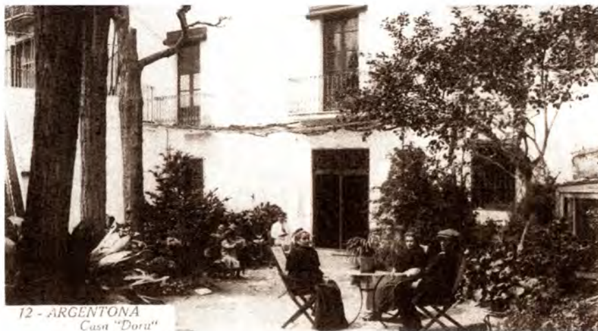
Masia de Can Doro, enderrocada fa pocs anys sense cap rebombori.

En tot cas ja en tenim prou amb els testimonis constants de l'agonia dels casals de Can Comalada, i Can Carmany, per posar uns exemples.