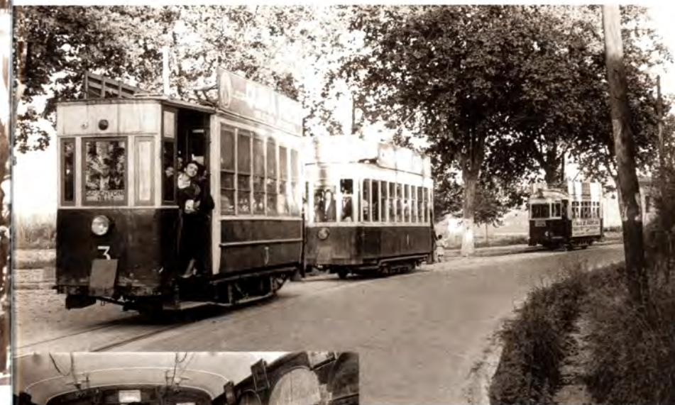
Els tramvies 3, 1 i 6 passant per davant del Sant Crist. Any 1958.

Incidents. Tot i que les avaries del material no eren freqüents, els descarrilaments, les topades amb altres vehicles i els atropellaments es van anar succeint. La veritat és que els vianants no prenen gaires precaucions i caminaven tranquil·lament pel carrer mentre passava el tramvia, de la mateixa manera que tam-