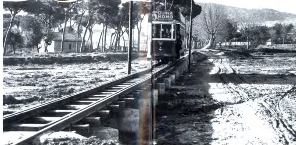
El tramvia número 4 passant pel pont de la riera d'Argentona. Any 1935.

posar un tren des de Mataró a Granollers. Un projecte, però, que no va tirar endavant per culpa de la manca d'interès de les dues companyies que en aquella època explotaven els ferrocarrils. Davant el fracàs d'aquesta temptativa l'any 1915 es va pensar en un altre tipus de transport, però que no deixava els rails: el tramvia. El projecte que intentava unir de nou Mataró amb Granollers va més endavant i fins i tot es reconstrueix el pont de la Riera, però