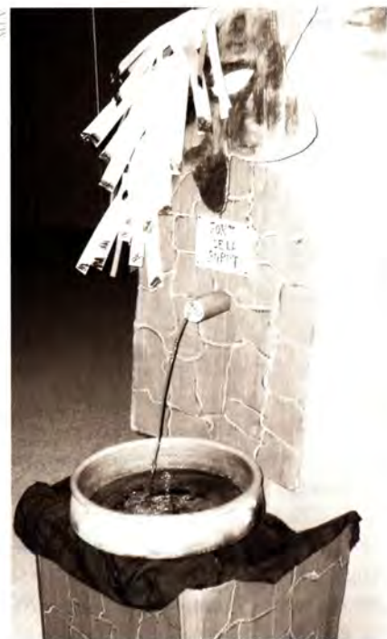
Alumnes i professors van reconstruir algunes fonts.