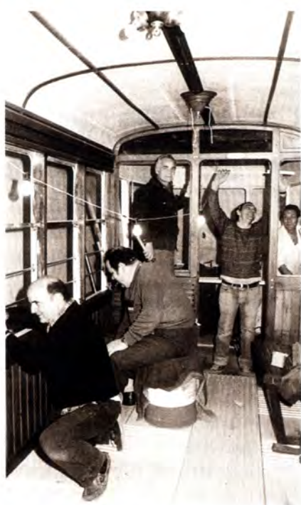
Els Amics del Tramvia d'Argentona en plena acció.