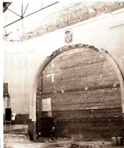
Més diners per les obres.

Militars, capellans i banquers. Cap d'ells va faltar a la cita amb el Carnestoltes d'Argentona el 28 de febrer passat, i és que el Rei del Carnaval va arribar acompanyat dels tres estaments que dominen el món. Per primer cop en molts anys, el sexe no va ser protagonista del dia més desenfrenat de l'any. El Carnestoltes d'aquest any, però, no va acabar d'anar a l'hora. Tot i els intents dels organitzadors per recuperar la tradició de les comparses i del concurs de disfresses, van ser molt pocs els argentonins que van sortir al carrer disfressats. La festa per als més grans va estar amenitzada pel grup Lucuma Lunch. El que sí que va ser un èxit van ser els actes infantils, com és el cas de la festa que van celebrar les escoles del poble i el carnaval infantil que es va fer el diumenge 2 de març al matí, amb una cercavila a càrrec de la companyia Wuakanaka i un ball final a la plaça Nova.