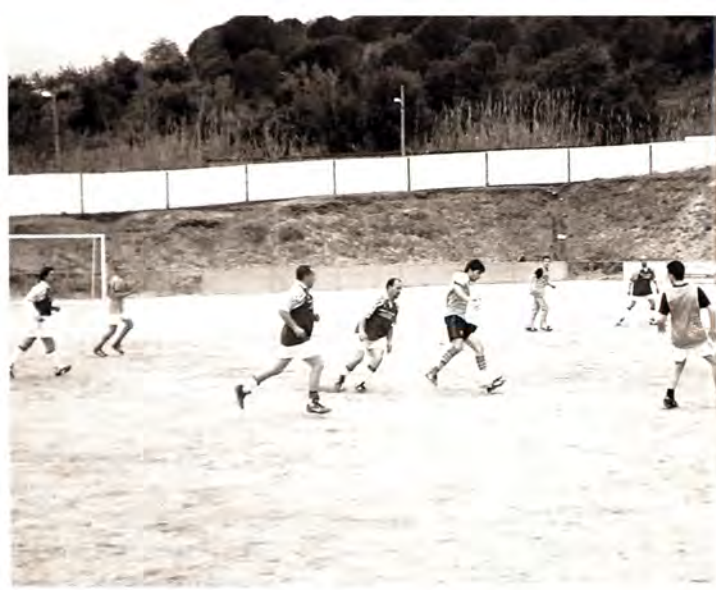
El Cros torna a revivre amb les festes que organitza l'Associació de Veïns.