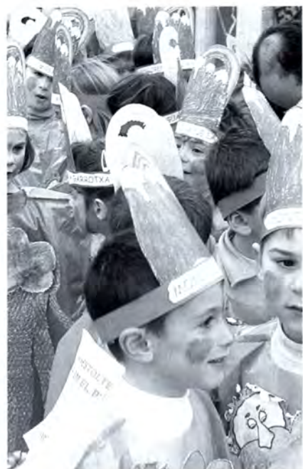
Carnestoltes a les escoles.

Els agents de la secció d'estupefaents del Cos Nacional de Policia van detenir el 20 de febrer a la urbanització Can Cabot una parella de presumptes narcotraficants i va comissar 7 mil pastilles d'èxtasi. Des de feia mesos, la policia nacional investigava una xarxa de drogues sintètiques que importava la mercaderia des d'Holanda i la distribuïa a la comarca del Maresme. El treball conjunt entre la policia espanyola i l'holandesa va permetre descobrir que els principals cervells de l'operació residien a Ar-