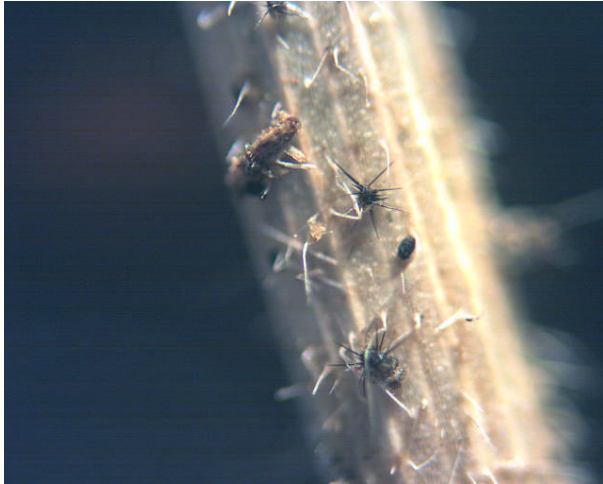
Grasstengel heeft middellijn 1mm

Acanthophiobolus helicosporus Wormsporig zee-egelzwammetje Vindplaats: Ulvenhoutse Bos Substraat: grasstengel Datum: 21 aug. 2008