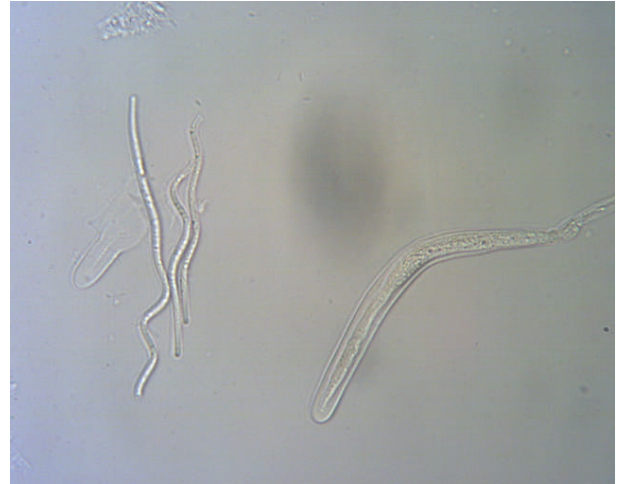
De afgebeelde sporen zijn ca 90 \mu\text{m} lang. Lit.: sporen tot 160 \mu\text{m} .