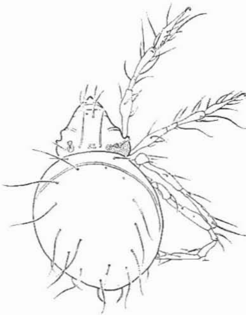
Fig. 2. Vista dorsal de Aeroppia mariehammerae n. nom. según Hammer, 1962.