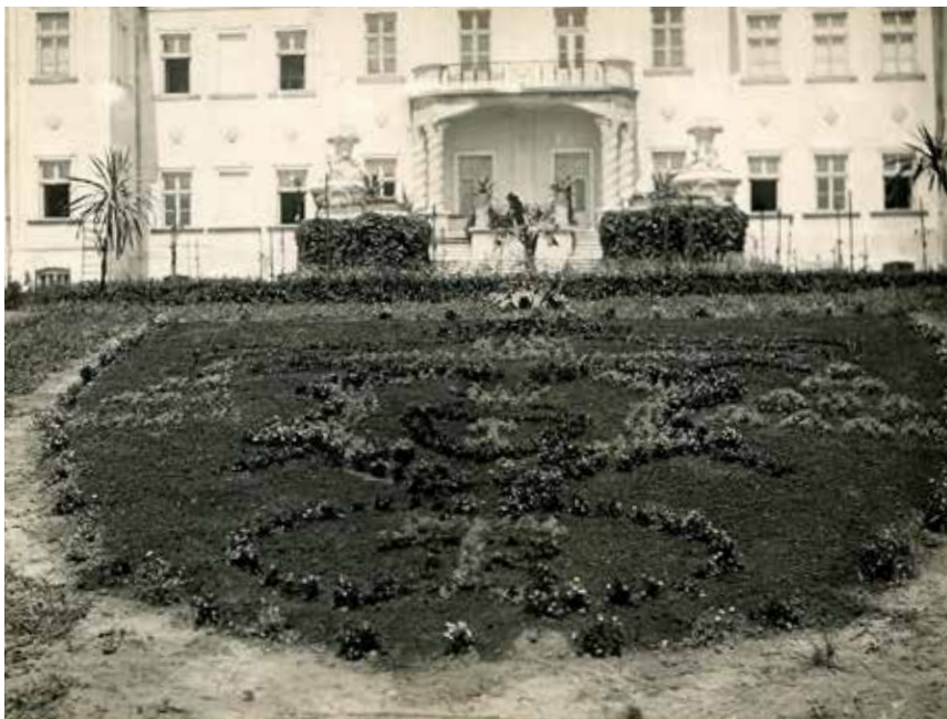
10. Widok wnętrza, ok. 1923, fot. Bronisław Wiktor