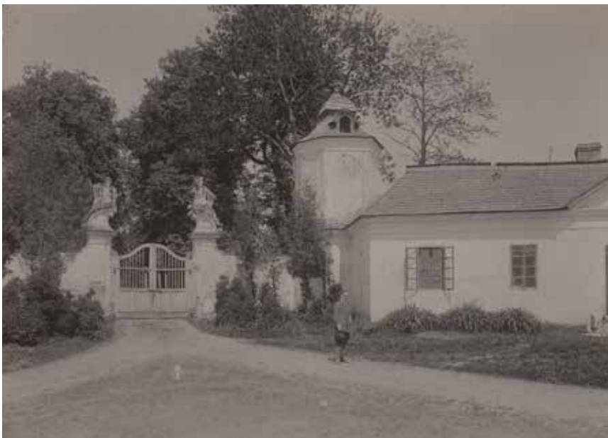
5. Brama wjazdowa do pałacu, ok. 1923