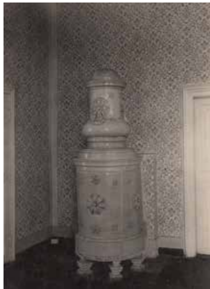
8. Piec kaflowy, ok. 1923