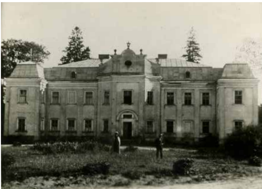
6. Widok ogólny pałacu przed renowacją, ok. 1922