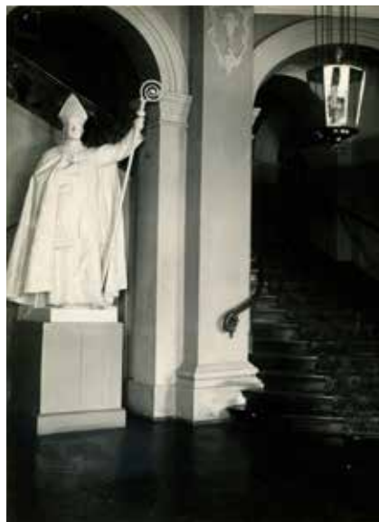
7. Sień wejściowa i pomnik abp. Józefa Bilczewskiego, po 1924

Naprzeciw tego budynku, wzdłuż drogi na lewo, znajduje się sad, a po prawej stronie za tym budynkiem znajduje się drzwi prowadzące do parku, położonego