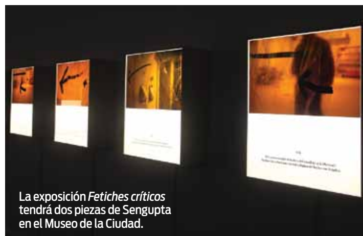
La exposición Fetiches críticos tendrá dos piezas de Sengupta en el Museo de la Ciudad.