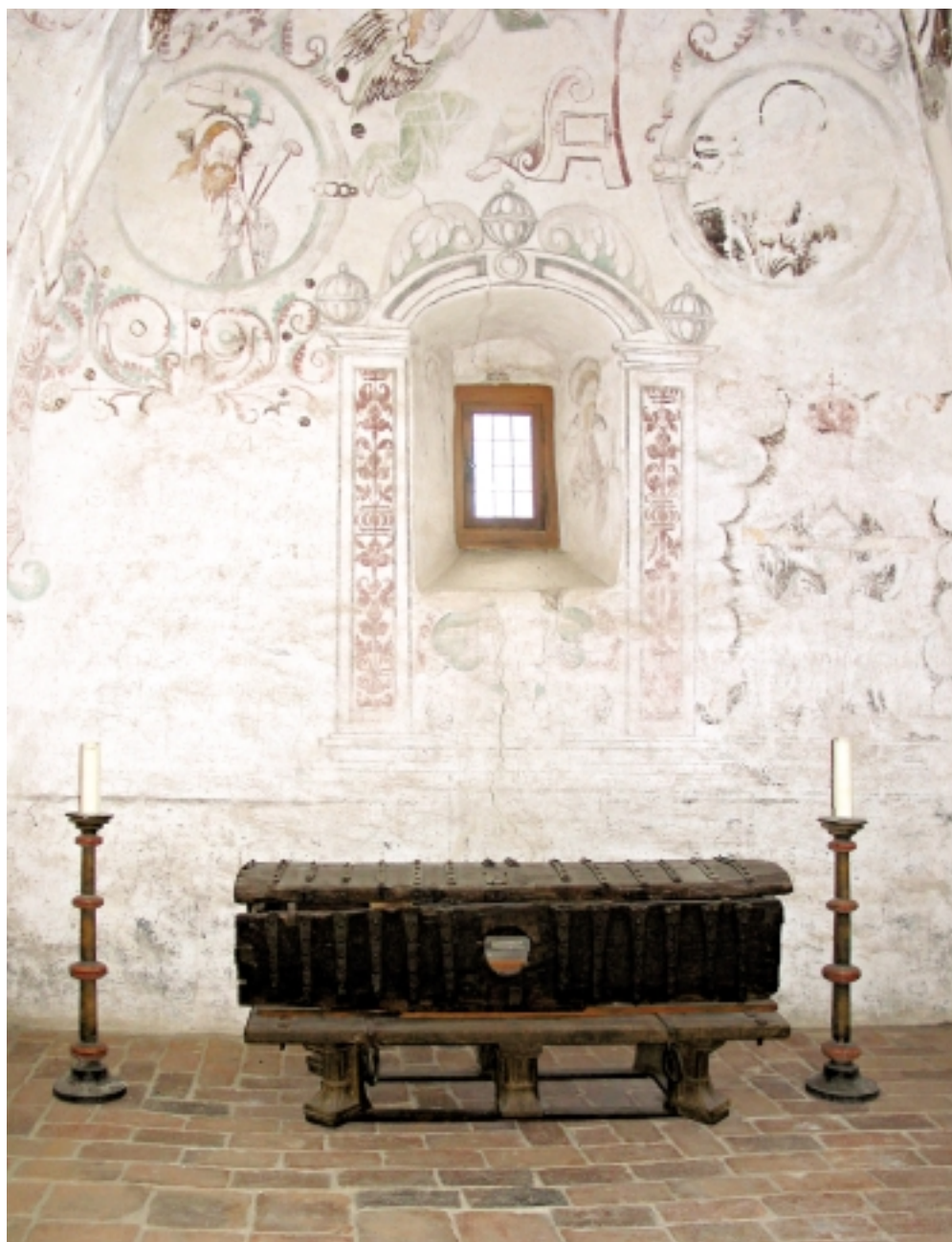
Sanctum Sanctorum, "Birgittas bönekammare" i Vadstena kloster. I kistan transporterades Birgittas kvarlevor från Rom till Vadstena. Kalkmålningarna tillkom 1581-1582.