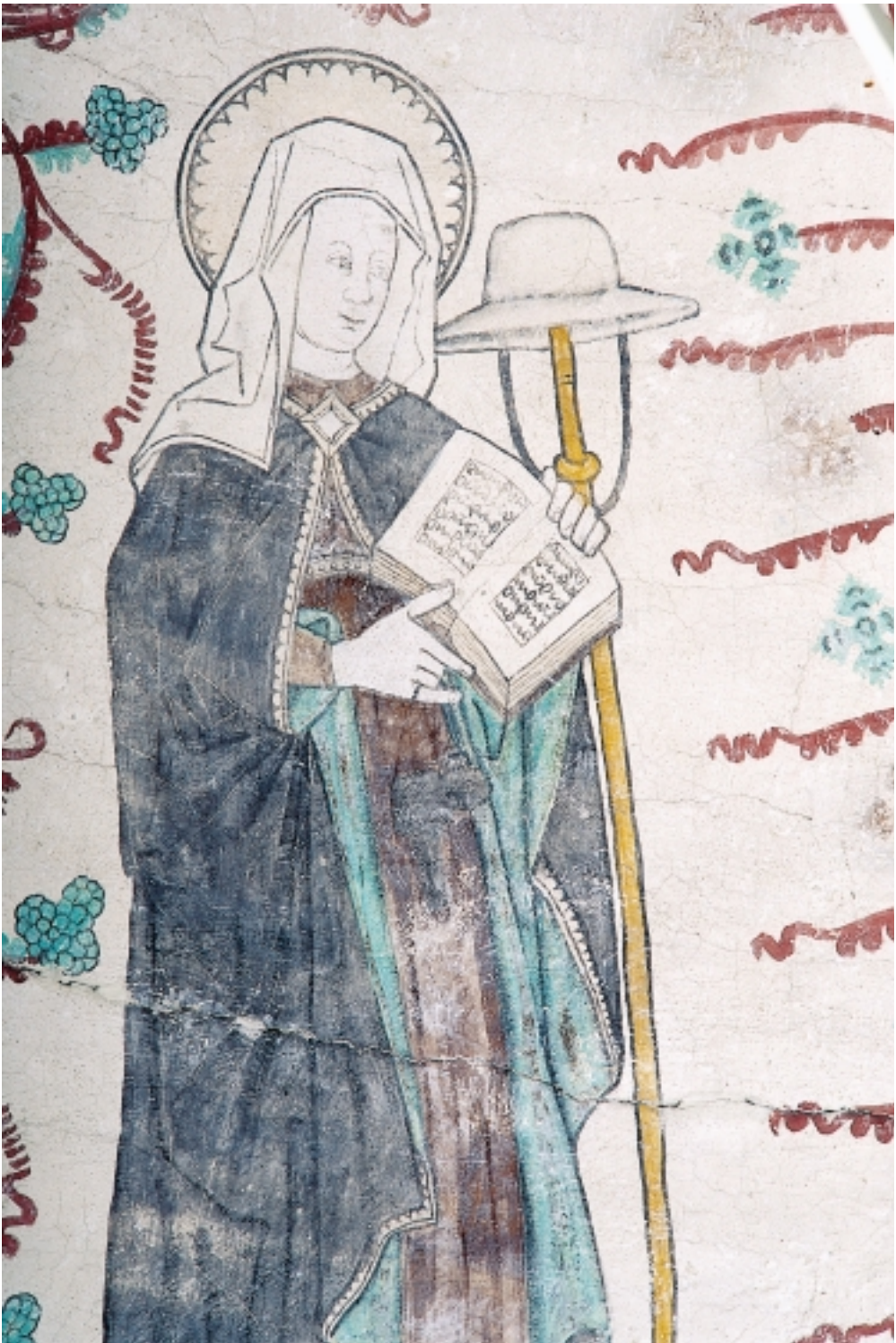
Birgitta med pilgrimsstav och pilgrimshatt. Kalkmålning i Börje kyrka, Uppland, ca 1450-1475.