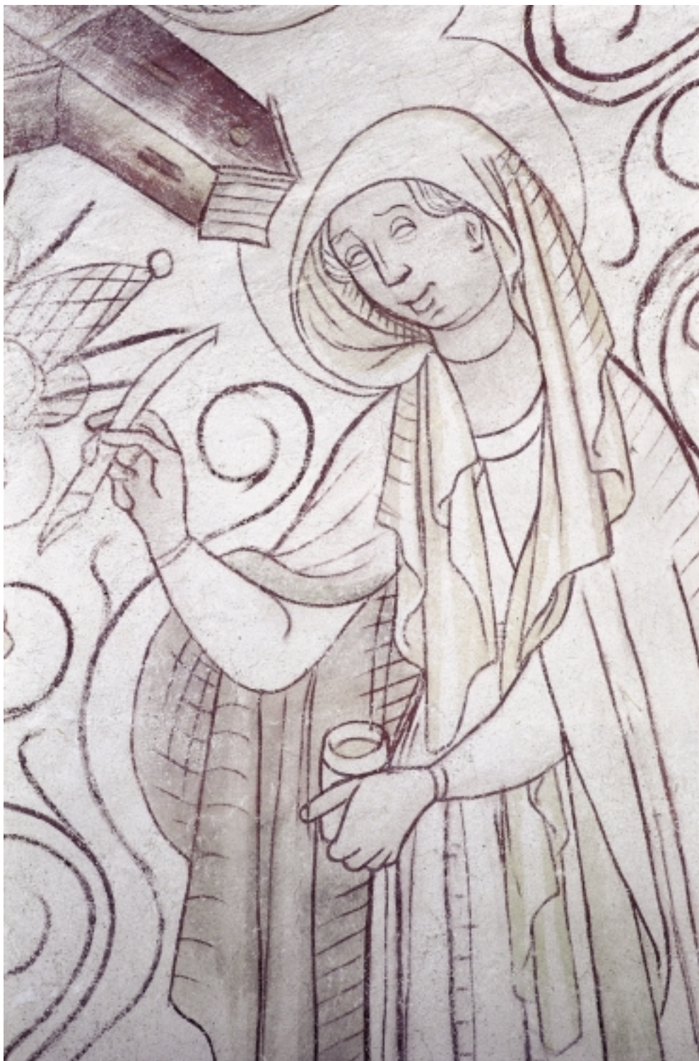
Den skrivande Birgitta med penna och bläckhorn. Kalkmålning från 1400-talet i Brönneå kyrka, Skåne.