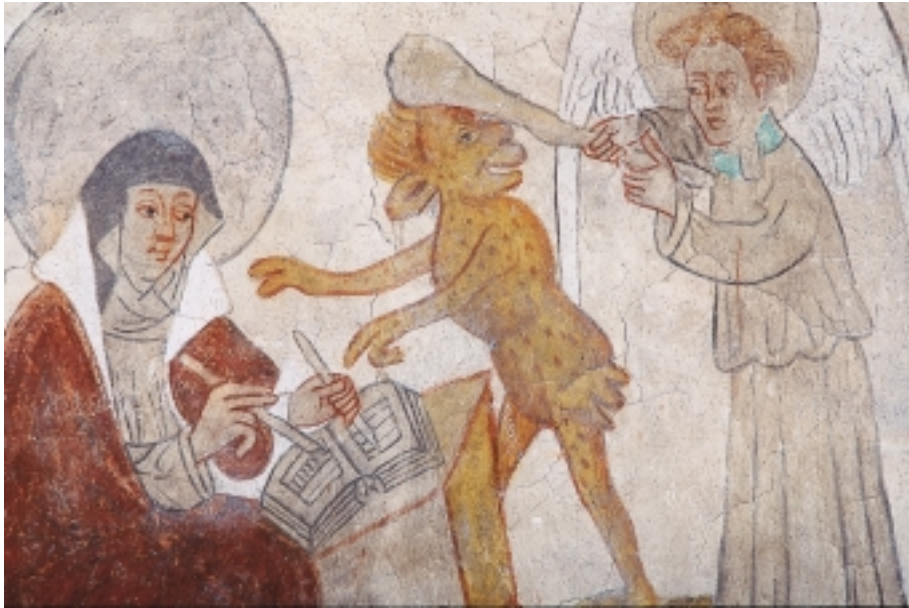
Birgitta frestas av djävulen, som klubbas ned av en ängel. Kalkmålning av Johannes Rosenrod från 1437 i Tensta kyrka, Uppland. Foto Lennart Karlsson