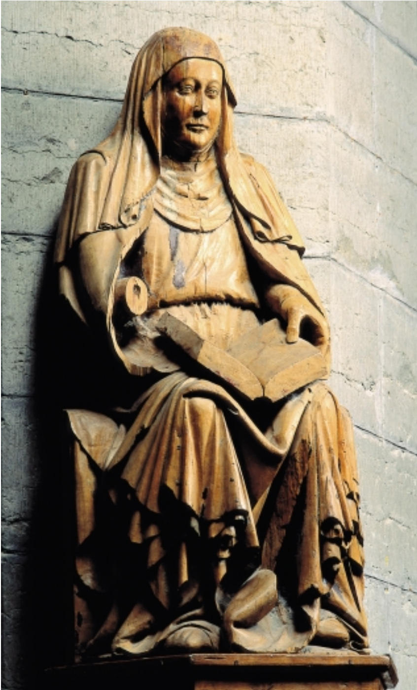
Den s.k. "porträttlika" Birgitta i Vadstena klosterkyrka. Träskulptur daterad från ca 1390 till 1400-talets första hälft.