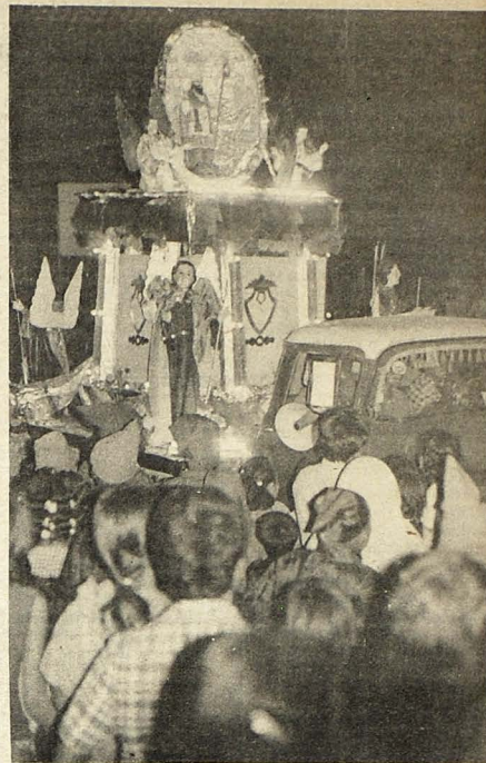
FIESTAS EN TONACATEPEQUE.— Con mucho fervor religioso se celebraron las fiestas patronales de la ciudad de Tonacatepeque. El Santo Patrono San Nicolás Obispo, es conducido en artístico carro, acompañado de las distintas asociaciones eclesíásticas y feligreses.