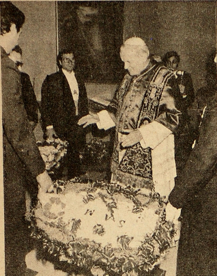
PAPA BENDICE CORDEROS. — Ciudad del Vaticano, enero 21. El Papa Juan pablo II bendice corderos, durante la ceremonia anual de la festividad de Santa Inés. La lana de los animales será utilizada para tejer el "palo papal", una franja que los Pontífices usan alrededor de la cintura sobre sus vestiduras, durante los servicios religiosos.

El 13 de este mes entró en vigencia el tratado bilateral de libre comercio que, según el acuerdo pacificador, debió haber empezado a operar desde el 10 de abril de 1981. Las discusiones del tratado bilateral han sufrido obstáculos en los últimos seis meses a consecuencia de los temas relacionados con el intercambio de textiles y calzado, en los cuales los empresarios de los dos países, aún no se ponen de acuerdo. Esos productos son calificados como "muy sensibles" porque El Salvador mantiene técnicas de producción muy avanzadas en ellos que resultan en artículos de buena calidad. —Favor pase a la página 15.