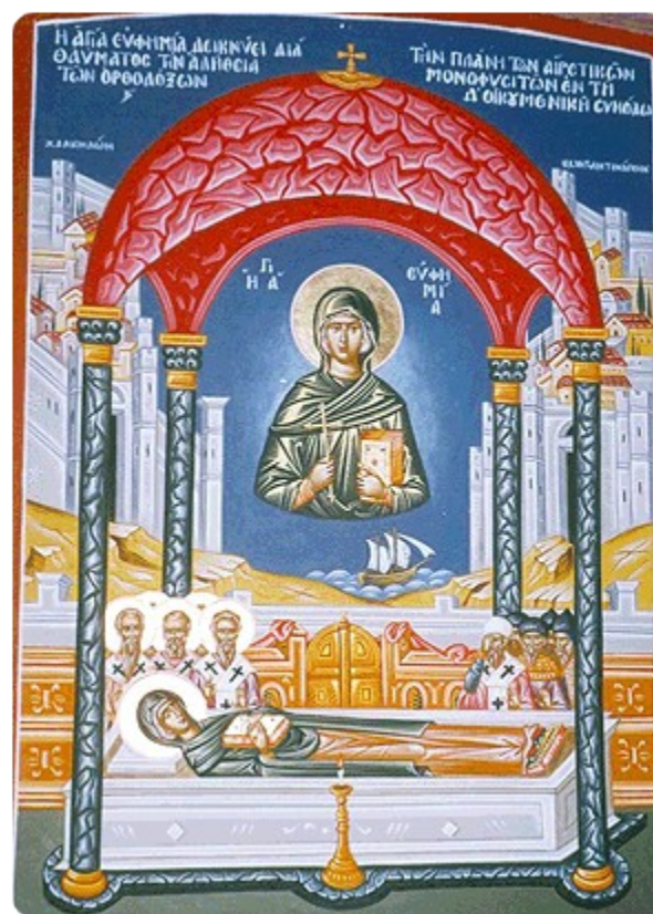
Η αγία Ευφημία

Επιρροή της κεντρικής εξουσίας με ολέθριες συνέπειες για την αυτοκρατορία. Και για το Χριστιανισμό, οι αιρέσεις είχαν καταλυτική δύναμη αφού βρήκαν εύφορο έδαφος να αναδειχτούν δόγματα και αιρετικές δοξασίες. Πολλοί άνθρωποι, μέλη αιρέσεων είναι «καλοί άνθρωποι» που ειλικρινά αναζητούν το Θεό και ειλικρινά πιστεύουν ότι έχουν την αλήθεια. Η ελπίδα μας και η προσευχή μας είναι ότι πολλοί άνθρωποι που εμπλέκονται στις Χριστιανικές «αιρέσεις» θα δοθούν τα ψέματα και θα ελκυστούν στην αλήθεια της σωτηρίας δια του Ιησού Χριστού.