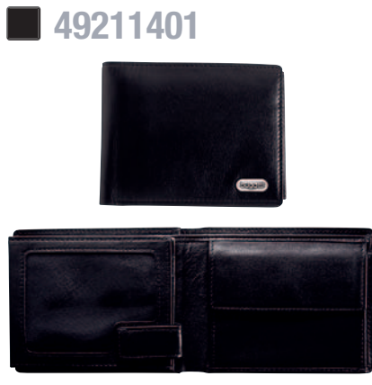
KOMBIBÖRSE, QUERFORMAT / WALLET, HORIZONTAL 11,5 x 9 cm