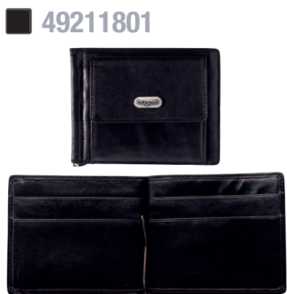
CLIPBÖRSE / CLIP PURSE 11 x 8,5 cm