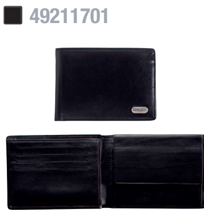
SCHEINTASCHE / BILLFOLD 12 x 9 cm