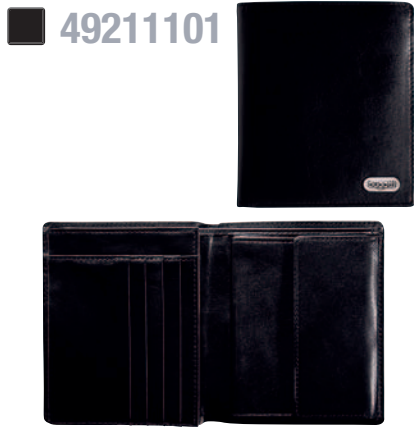
KOMBIBÖRSE, HOCHFORMAT / WALLET, UPRIGHT 10 x 12 cm