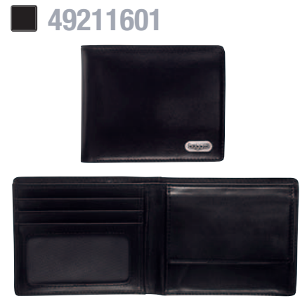
SCHEINTASCHE / BILLFOLD 10,5 x 9 cm