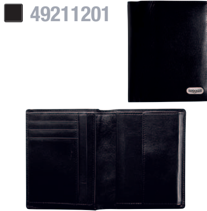
KOMBIBÖRSE, HOCHFORMAT / WALLET, UPRIGHT 10 x 12,5 cm