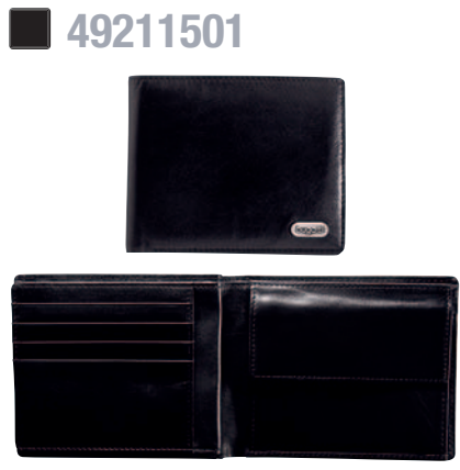
KOMBIBÖRSE, QUERFORMAT / WALLET, HORIZONTAL 12 x 10 cm