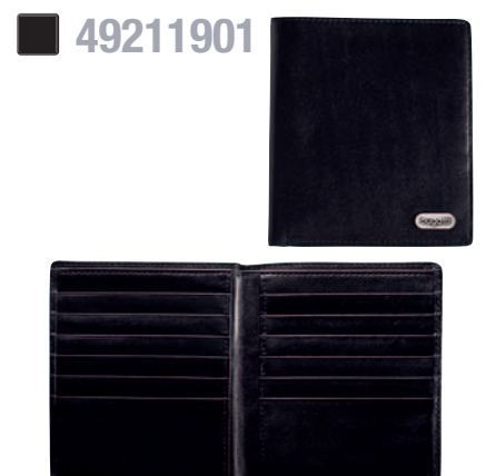
KREDITKARTEN-/SCHEINTASCHE / CREDIT CARD/BILLFOLD 10 x 12 cm