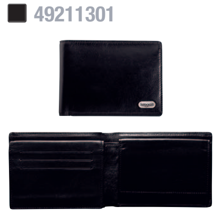
KOMBIBÖRSE, QUERFORMAT / WALLET, HORIZONTAL 12 x 9 cm