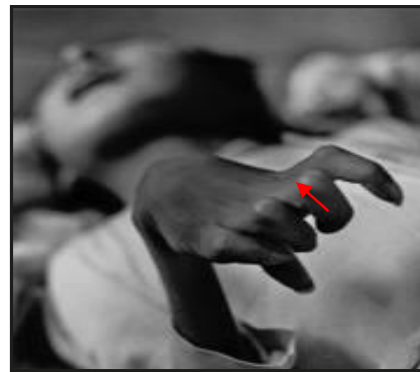
Enfermedad de Minamata - Japón 1950- MINAMATA, W. Eugene Smith y Aileen Smith.H.W.R 1975