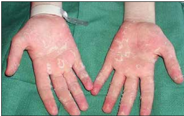
Lesiones Dermatológicas- Acrodinia: Heavy Metal Poisoning . Clin Lab Med 26 (2006) 67-97 http://abcmt.org/Heavy%20Metal%20Toxicity%20Review%202006.pdf