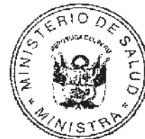
MIDORI DE HABICH ROSPIGLIOSI Ministra de Salud