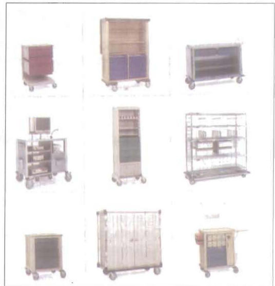
(Fig. No. 29) Modelos de Coche de Transporte.