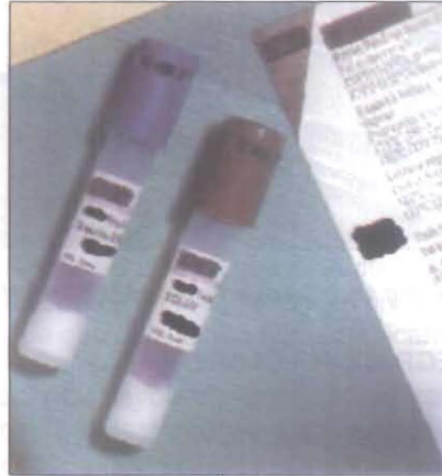
(Fig. No. 24) Indicadores biológicos para autoclave.

La desventaja de estos indicadores es el tiempo de espera por los resultados, ya que la lectura se realiza a partir de las primeras 12 horas y con un máximo de 72 horas. (18)