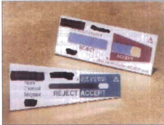
(Fig. No. 23) Indicador integrador interno.

Son indicadores designados para reaccionar ante todos los parámetros críticos del proceso de esterilización en autoclave (temperatura, tiempo, calidad del vapor) dentro de un intervalo específico del ciclo de esterilización. Estos indicadores son mucho más precisos que los de clase IV. Ellos se deberán de utilizar dentro de cada paquete como indicador interno. (Ver Fig. No. 23).