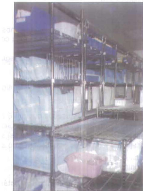
(Fig. No. 28) Carro de Transporte.

Las cubiertas reusables de los carros de transporte deben ser limpiadas después de cada uso y tener un cierre hermético. Los carros deben ser lavados, secados y desinfectados antes y después del transporte del material estéril.