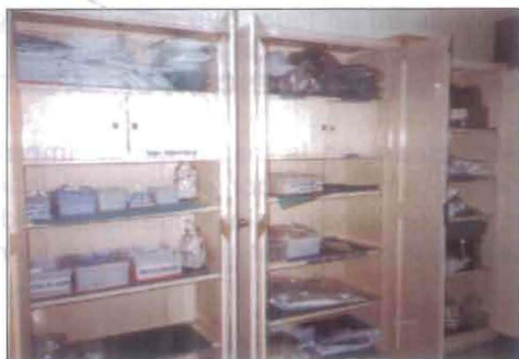
(Fig. No. 25) Estantes cerrados para material de baja rotación.