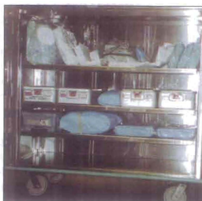
(Fig. No. 27) Estantes abiertos para material de alta rotación.