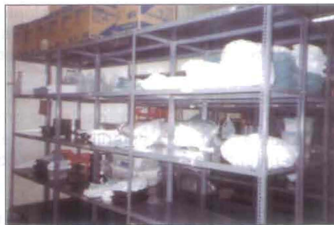
(Fig. No. 26) Estantes abiertos para material de alta rotación.