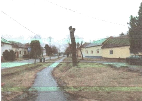
Képek: 5430 Tiszaföldvár, Kígyó út 2.