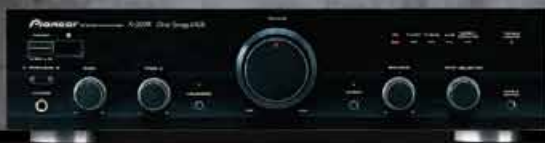
A-307R Vollverstärker – 80 W x 2 (DIN).