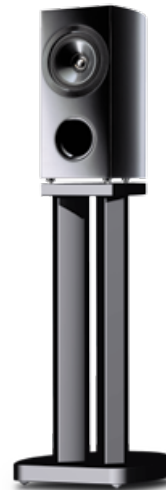
S-81B-LR-K + CP-81B-K