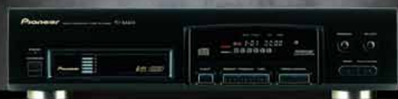
PD-M426A CD-Wechsler – 6 CDs.