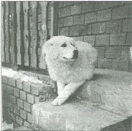
Ezt a kutyát elvitték...