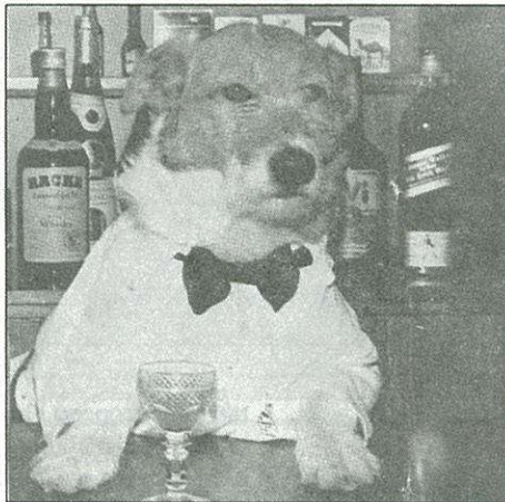
„Ő” szerencsésen megúsza...