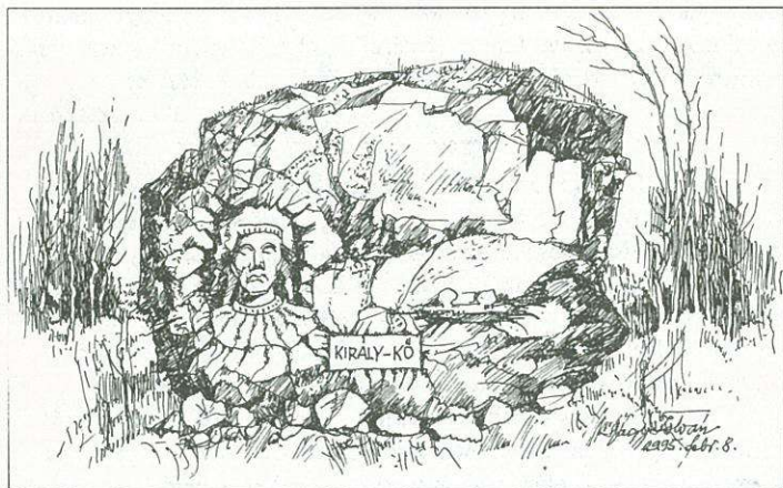
Nagy István grafikája