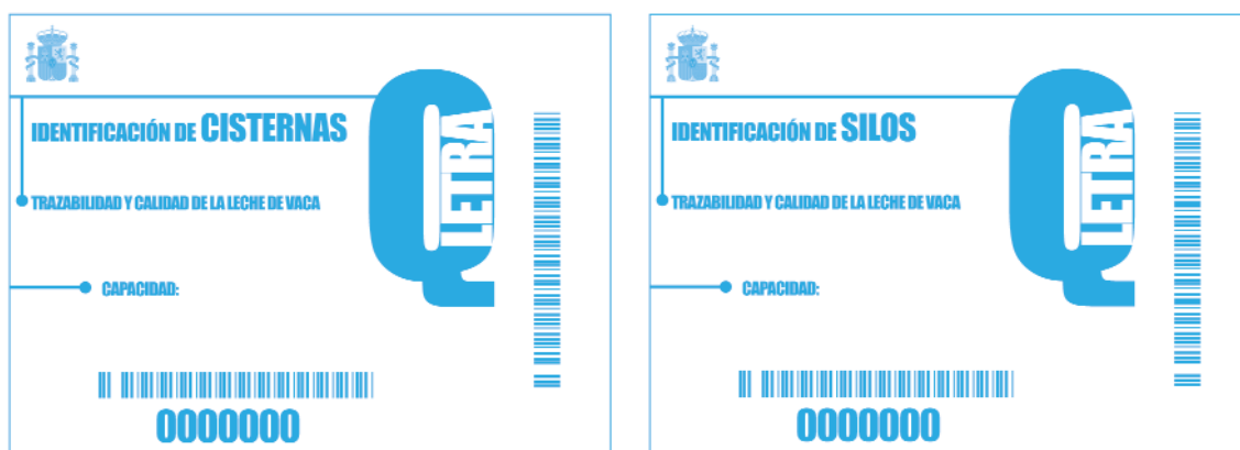
a) Etiqueta para cisternas

Ilustración 1. Modelos de etiquetas para la identificación de los contenedores de leche cruda de vaca