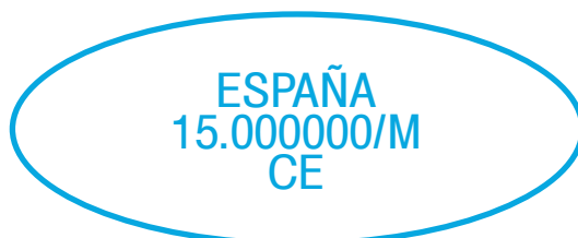
Ilustración 2. Ejemplo de marca de identificación de empresa del sector lácteo ubicada en la Comunidad de Madrid: