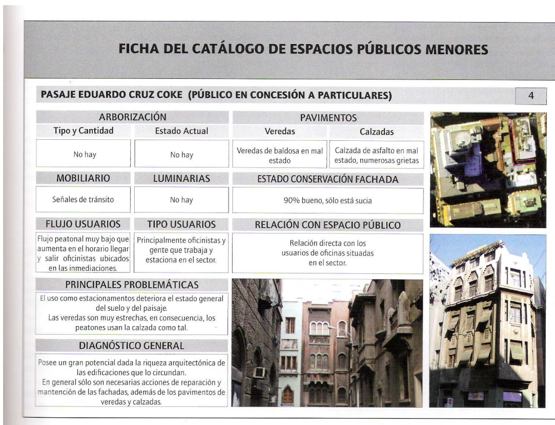
Ficha del catálogo de Santiago de Chile