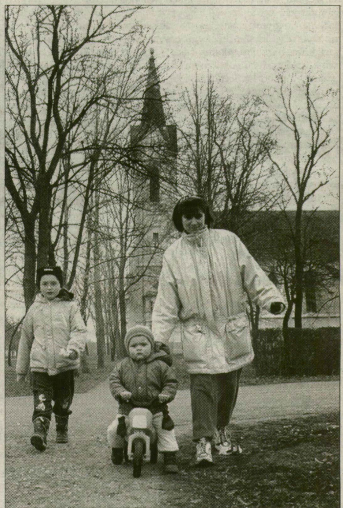
Küköské. Ezen a településen is úgy gondolták a választók, új polgármester kell.