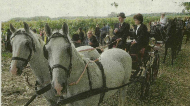
■ A FORRÁSKÚTI SZÜRET MA MÁR IGAZI LÁTVÁNYOSSÁG

Az ÚMVP október közepén megnyílt intézkedéseinek keretében 2009. január 10-éig támogatás igényelhető, a helyi vagy országos védelem alatt álló építmények - például kúrhalmok, tájházak - külső felújítására; az építmény rendszeres