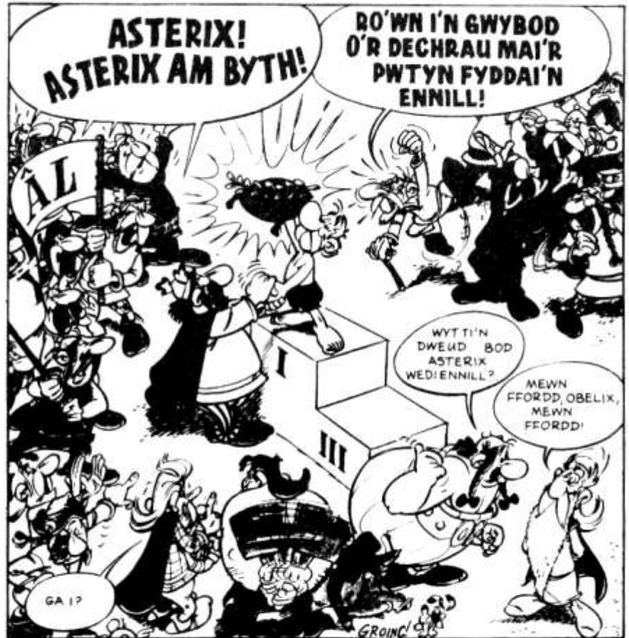
Asterix yn ennill llawryf y Gemau Olympaidd

Stori hyfryd i'r ifainc yw Anrheg Pen-blwydd Nucca , sy'n llyfr swynol am fachgen bach o Esgimo a'i gi, a'r cyfan yn fywiog a gorffen yn hapus. Am y pedwerydd llyfr, hwn yw'r drutaf, ond gellir gweld i waith mawr iawn fynd i mewn iddo a bydd nid yn unig yn rhoi pleser, ond hefyd yn help mawr i gyfoethogi iaith y plentyn. Dyma'r pedwar felly: