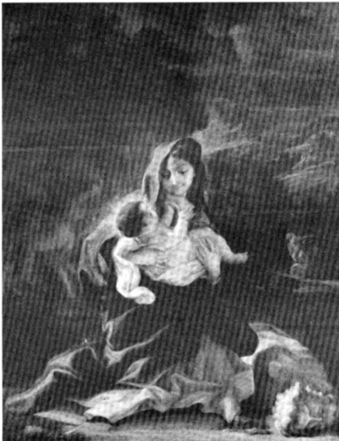
"Gorffwys tra ar ffo i'r Aifft" gan Giovanni Battista Gaulli. (c.1700) Mewn lliw yng Ngharden Nadolig Amgueddfa Genedlaethol Cymru