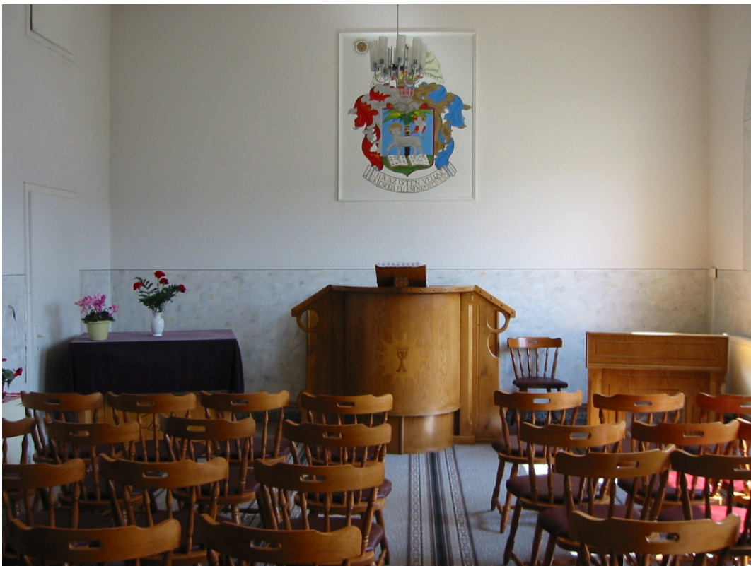
Slika 6.2.3.1: Notranjost kalvinistične cerkve v Motvarjevcih

Majhna cerkev v Motvarjevcih, ki sem si jo ogledala, je urejena skromno, po kalvinističnih načelih. Nima drugega okrasja kot slike, ki visi nad oltarjem in predstavlja simbol skupnosti, ter šopkov rož ob oltarju. Ob oltarju je tudi harmonij, saj petje cerkvenih pesmi predstavlja pomemben del bogoslužja, večina vernikov prinese k maši svojo pesmarico s pesmimi v madžarščini. Prav tako kot notranjščina pa je preprosta tudi zunanjščina, na vrhu zvonika je osemkraka zvezda, ki jo je pogosto mogoče zaslediti na vrhu kalvinističnih cerkva, medtem ko je za evangeličane značilen križ. Notranjščina cerkve je prikazana na sliki 6.2.3.1, zvonik z osemkrako zvezdo pa je na sliki 6.2.3.2.