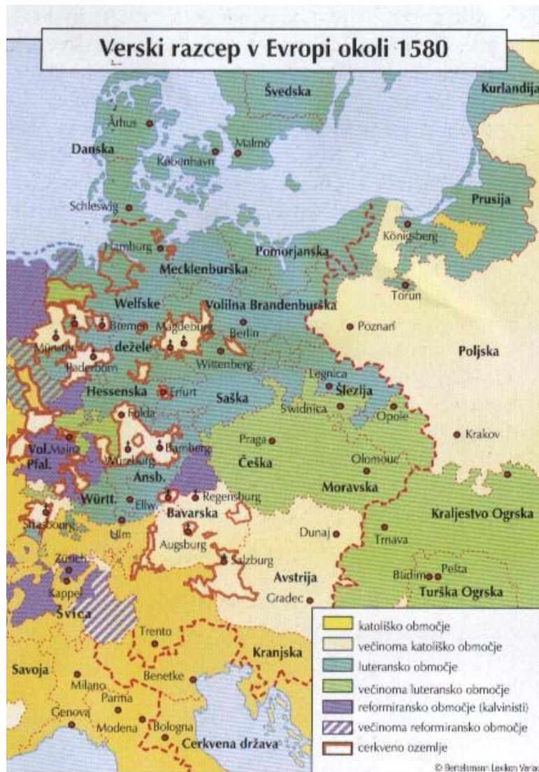
Slika 2.4.1: Razširjenost protestantizmov v Evropi okrog leta 1580