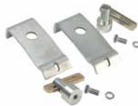
PAL PAK, wird angeschraubt