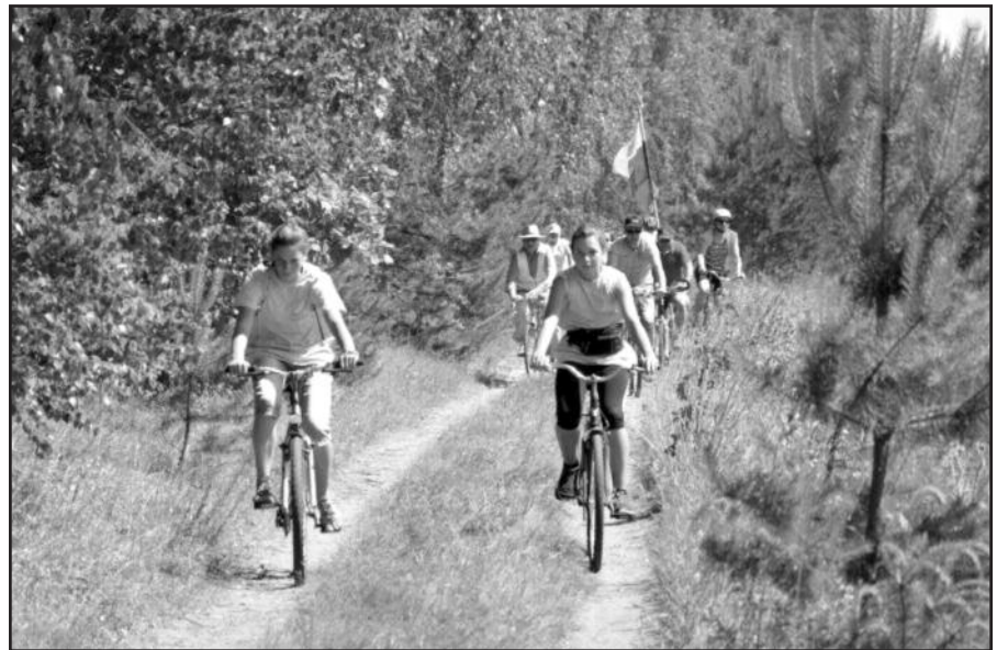
Keliolika kilometrų – per Kazliškių mišką.