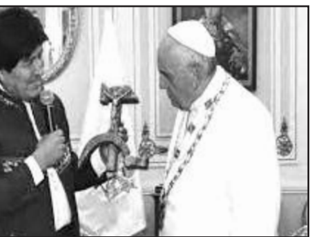
Dviprasmiškai vertinama dovana popiežiui.