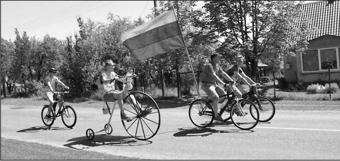
Patriotiškasis žygis dviračiais iš Musninkų į Čiobiškį.