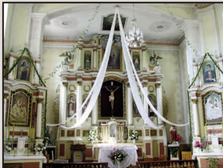
Pasvalio Šv. Jono Krikštytojo bažnyčia