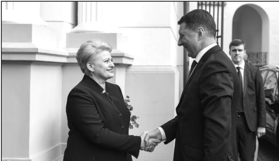
Lietuvos ir Latvijos prezidentų susitikimas.