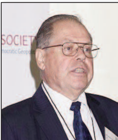
Kovotojas su elektromagnetiniu drakonu – 10 psl.