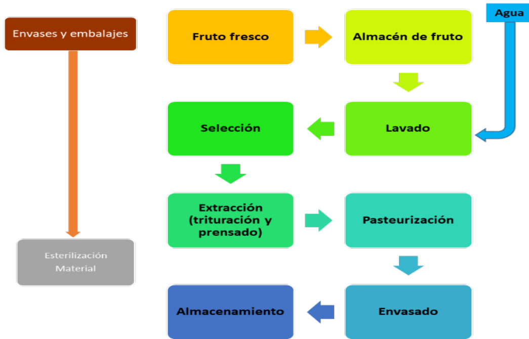
Figura 2. Diagramas de planta procesadora de jugo de Sechium compositum