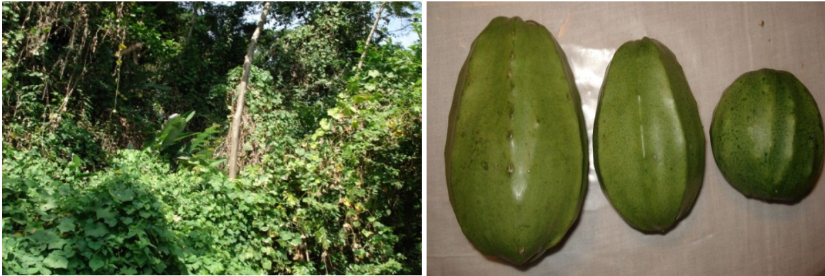
Figura 1. Ambiente natural de distribución en selva alta perennifolia de Chiapas, México de Sechium compositum , y tres variantes de fruto de la especie.