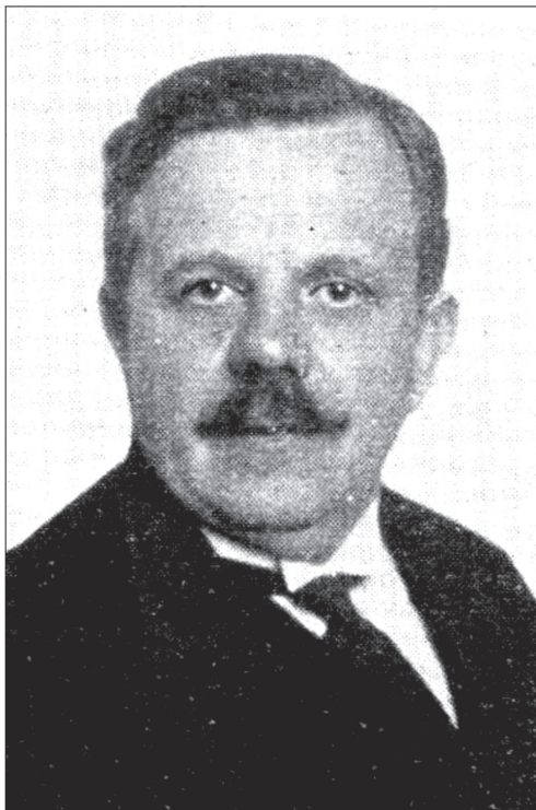
Bud János (1880–1950), az Országos Központi Árvizsgáló Bizottság első elnöke 3

(1912. évi LXIII. tc., 1914. évi L. tc.) kapott felhatalmazás alapján megtette a szükséges lépéseket az áruk és a haszonkulcs maximalizálása érdekében. 1 Az ármaximalizálás mellett szükségesnek mutatkozott azonban a közszükségleti cikkek forgalmazása körüli visszaélésekkel szembeni fellépés is. Ezért kerültek felállításra a 3678/1917. M. E. sz. rendelet értelmében az árvizsgáló bizottságok és az Országos Központi Árvizsgáló Bizottság, amelynek hatásköre a tájékoztató áruk megjelölése volt. 2