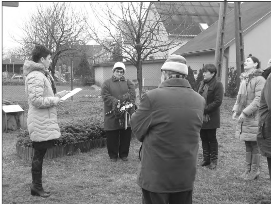
A Kommunizmus Áldozatainak Emléknepjén, február 25-én tartottunk megemlékezést. A képviselő testület tagjai, valamint civilek helyezték el koszorúikat.

Várjuk a Tisztelt Polgárokat, civil szervezeteket, és az intézményeket a megemlékezésre!