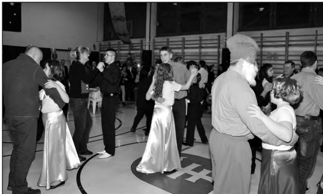
Jövőre veletek ugyanitt!

Ez úton szeretnénk megköszönni szponzorainknak, támogatóinknak, a programot segítő szülőknek, hogy idén is színvonalas rendezvénnyel zárhattuk a farsangi időszakot. Megcsodálhattuk felsős tanulóink keringőjét, a Mai Nők fergeteges ABBA táncát, visszaidézhetjük a Hupikék Törpikék mesevilágát, me-