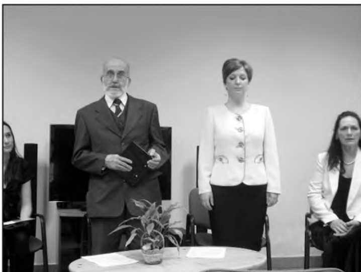
TIT Váci Mihály Irodalmi Színpadának tagjai