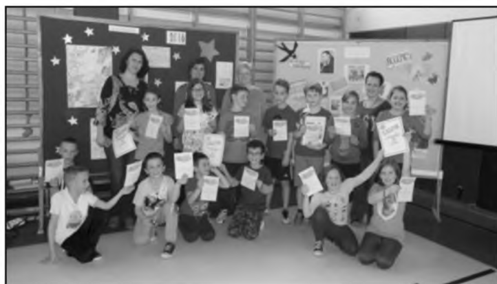
A nyertes csapatok és felkészítőik