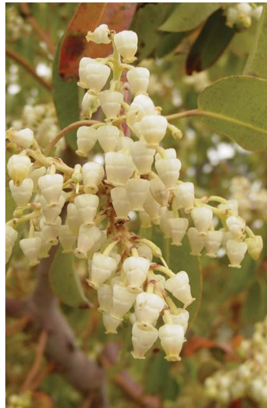
Arbutus xalapensis - Madroño.

El término de “flor silvestre” se aplica de manera indistinta a cualquier planta que crezca fuera de los cuidados del hombre, esta denominación puede tener muchas ramificaciones; por ejemplo, las plantas ruderales son aquéllas que crecen a las orillas de los caminos; las denominadas malezas crecen asociadas a las actividades de disturbio o agrícolas, podemos hacer más angosta la definición al mencionar la característica “herbácea”, es decir, son aquellas especies de flora que no tienen madera dentro de sus tejidos y pueden ser de duración anual, multianual o perennes. Las características propias de este tipo de plantas las hacen poco llamativas a la vista, muchas de éstas sólo pueden verse durante un periodo muy específico del año y su floración apenas dura un par de días, de igual manera sus flores son de tamaño reducido o de colores poco espectaculares.