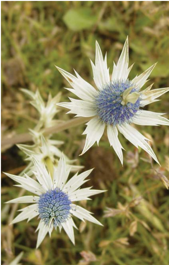
Eryngium heterophyllum - Hierba del sapo.

Nuevo León cuenta con alrededor de 3,000 especies de plantas vasculares; según algunas estimaciones, este número podría llegar a cerca de las 3,200 especies; 2,3 si bien esto no lo hace uno de los estados más ricos en cuanto a especies de flora, sí existen puntos que vale la pena resaltar, por ejemplo, es el único estado en la república que cuenta con tres géneros endémicos de cactáceas ( Aztekium , Geobintonia y Digitostigma ), 4,5 de igual forma, en esta familia nos disputamos entre el segundo y tercer lugar con Tamaulipas en número de especies a nivel nacional. En general, se estima que cerca de 5% de la flora de Nuevo León (159 especies) no ocurre fuera de los límites estatales.