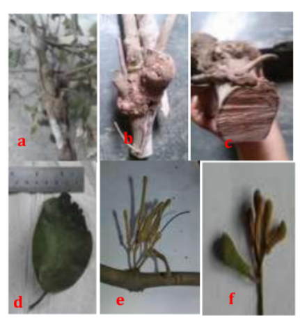
Gambar 5. Scurrula atropurpurea, keterangan: (a) habitus; (b) houstorium; (c) penampang melintang houstorium; (d) daun; (e) bunga; (f) buah

menggimbal lebat; posisi lapisan lengket diluar. Diameter batang bagian pangkal distal 1,0cm-3,5cm; diameter batang bagian ujung proksimal 1,0cm-2 cm.