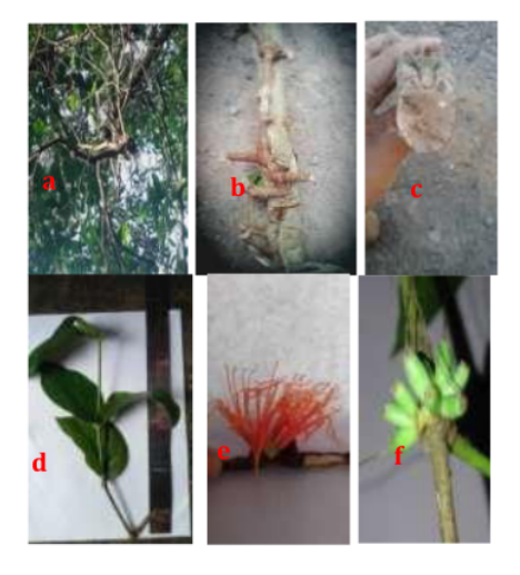
Gambar 3. Amyema edanoi , keterangan: (a) habitus; (b) houstorium; (c) penampang melintang houstorium; (d) daun; (e) bunga; (f) buah

bulat telur, lanset, sadak; panjang x lebar 5cm-22cm x 4,5cm-7,4cm, warna sisi atas daun hijau tua 7,5GY 7/10 gundul kasap; warna sisi bawah daun hijau muda 7,5 GY 7/8 gundul kasap; pinggiran daun rata; ujung daun luncip; mengekor pendek 2 cm; lancip menyempit (narrow acute); pangkal daun sadak, truncate, jantung (cordate), baji (cuneate); midrib terlihat jelas disisi bawah dan disisi atas helaian daun; jumlah anak tulang daun 7 – 10. Perbungaan majemuk memayung tunggal; terdapat pada buku batang dan ketiak; jumlah perbungaan per buku batang 1-6 buah. Gagang bulat; gundul. Brakteola gundul, deltoid, ; jumlah brakteola per bunga 1 buah pada masing - masing bunga; terletak pangkal ovarium; gundul. Bunga melonceng; panjang x diameter 1,2cm -2,1cm x 1,0cm - 1,3cm. Kelopak bunga berlekatan (gamosepal); perhiasan bunga 4 dan 6 meerus. Buah membotol; panjang x diameter 0,8cm-1cm x 0,3cm-0,5cm. Diameter batang bagian pangkal distal 2cm-2,5cm; diameter batang bagian ujung proksimal 0,5cm - 2cm.