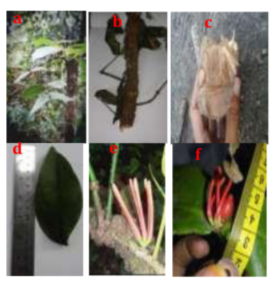
Gambar 2. Amyema tetraflora, keterangan: (a) habitus; (b) houstorium; (c) penampang melintang houstorium; (d) daun; (e) bunga; (f) buah

b. Amyema edanoi (Merr.) Barlow, flumea 36 (1992) 328. — Loranthus edanoi Mcrr.. Philipp. J. Sc. Bot. 13 (1918) 275. Dicymanthes edanoi (Merr.) Danser. Bull. Jard. Bot. Buitcnzorg 111, 10 (1929) 31 1. — Type: Ramos & Edano BS 26241, lecto, Luzon. Mt Umingan. [For additional synonym see Barlow, Blumea 36 (1992) 328]. New Record berdasarkan Barlow (1993), Barlow (1995), Barlow (1997), Danser (1935), Ladely dan Kelly (1996), , Geils dan Collazo (2002), Didier et al. (2008).