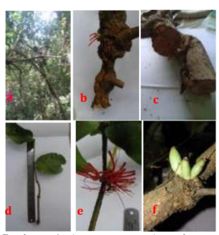
Gambar 4. Amyema seemeniana, keterangan: (a) habitus; (b) houstorium; (c) penampang melintang houstorium; (d) daun; (e) bunga; (f) buah

distal 1,5cm-4cm; diameter batang bagian ujung proksimal 0,5cm-3cm.