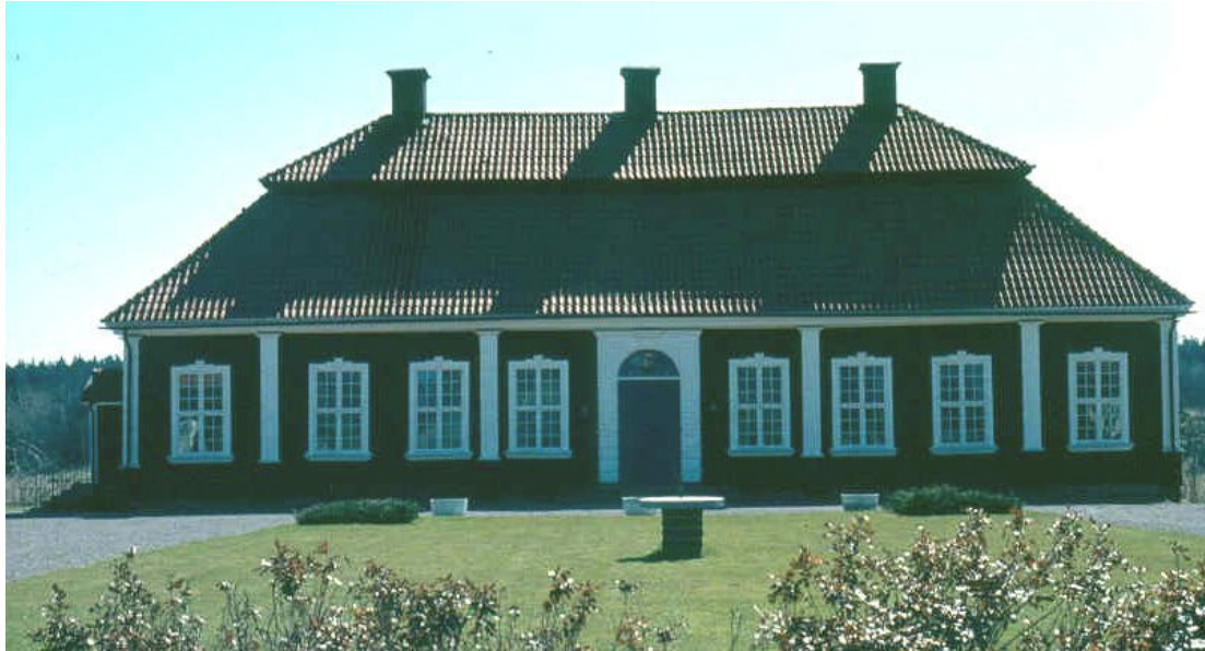
Corps de logiet på Grävsten.

Grävsten är ett fint och välbevarat exempel på en karolinsk herrgårdsanläggning, bestående av huvudbyggnad och tre flygelbyggnader. Byggnaderna är uppförda av timmer i ett plan under säteritak.