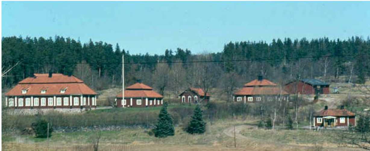
Vy över Grävsten med corps de logiet, södra flygeln, avträdet och Bläckhornet m fl byggnader.