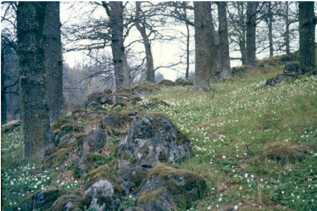
Stensträng vid Grävsten.

Stensträngarna ansluter till tre husterrasser på den mellersta höjdens nordöstra sida. Idag ser vi bara de avplanade ytorna där husen har stått. Terrasserna är stenskodda i ytterkanterna.