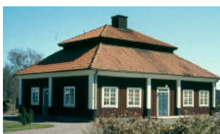
Flygelbyggnader till Grävstens corps de logie.