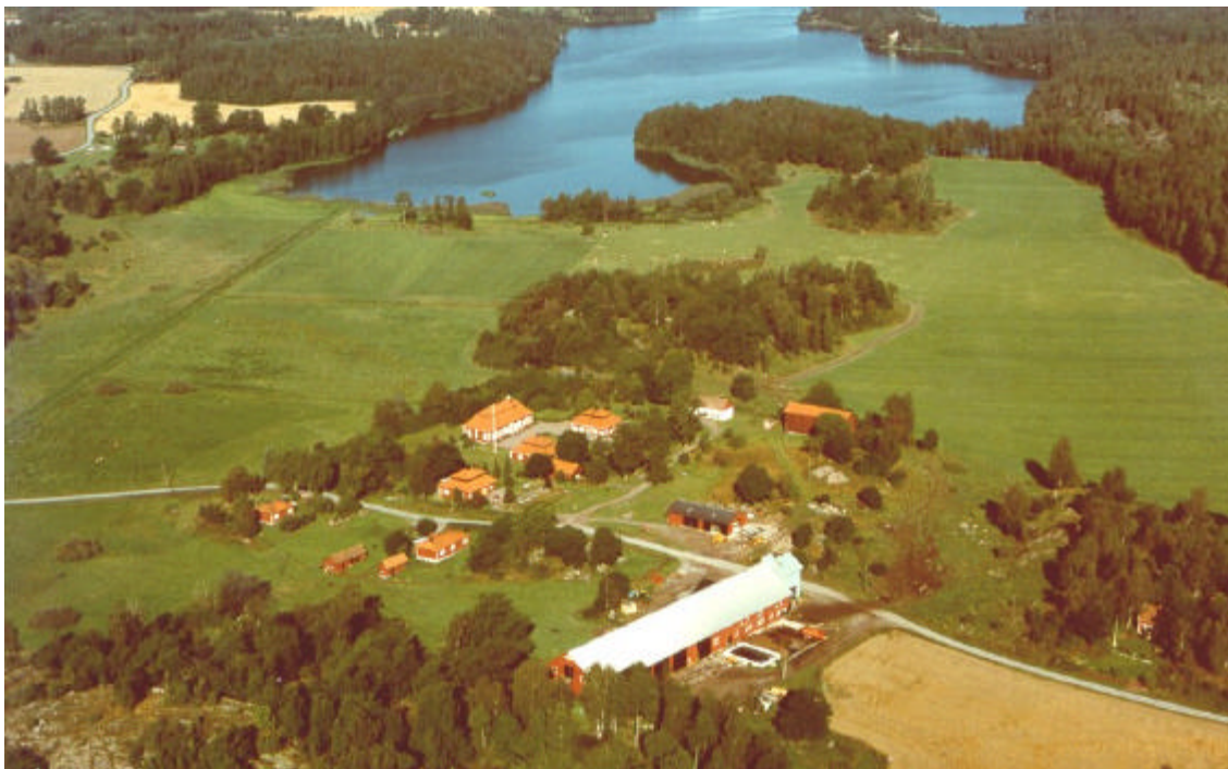
Vy över Grävsten, mot väster. Foto Jan Norrman, Riksantikvarieämbetet. 1991.

Intill herrgården finns ett innehållsrikt fornlämningsområde. Fornlämningarna utgörs av fyra gravfält, ett trettiotal stensättningar, stensträngar, fossila åkerytor, husterrasser samt en fornborg. Troligen är en stor del av fornlämningarna samtida och representerar en väl sammanhållen bosättning från tiden ca 100-600 e.Kr.