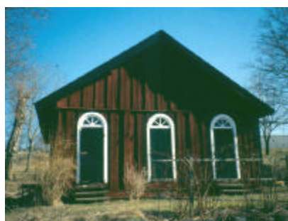
Dasset på Grävsten.