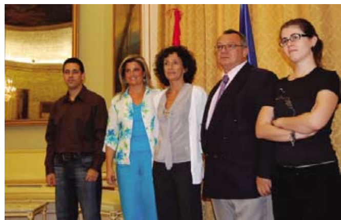
Uguero dolor sim iliquat. Lore faccum estin volor

Es lamentable que en estos momentos en que resulta tan necesario un esfuerzo de diálogo y de consenso para acometer las importantes reformas que precisa nuestro sistema educativo, se pierdan tantas energías en implantar esta asignatura, que está produciendo tanta crispación y descontento por el modo en el que está planteada. Cofapa ha solicitado públicamente al Gobierno que se plantee de nuevo retirar esta asignatura o bien someterla a una profunda remodelación de los contenidos y sus criterios de evaluación,