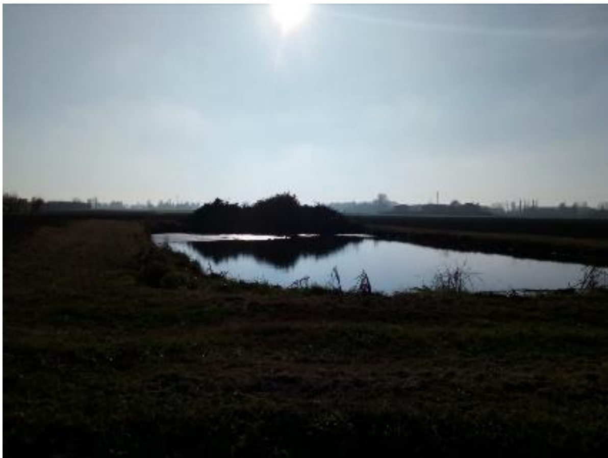
Un macero situato nel caradon ad campagna tra la fine di Via Calanco e Via Argini Nord