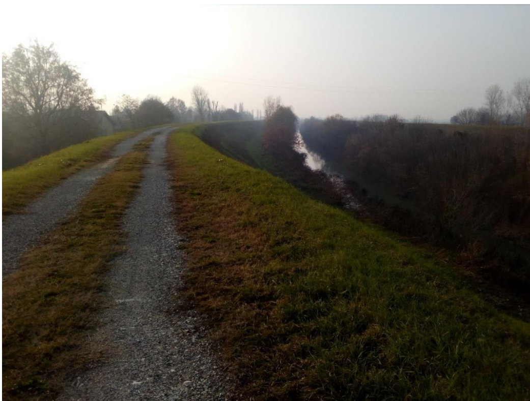
Fiume Panaro, tra Caselle e la ciclabile del Sole