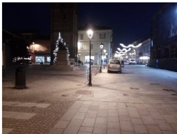
Lampioncini montati nella Piazza Malpigi (Crevalcore), F.to di giorno e di sera