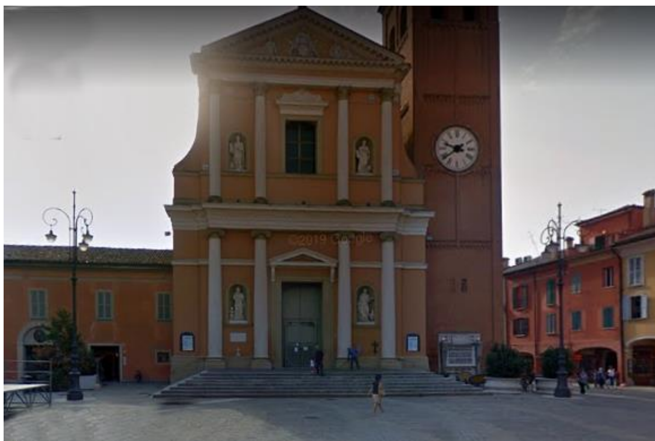
Due lampioni installati nella Piazza di San Giovanni in Persiceto