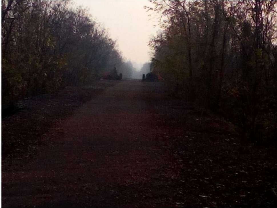
Ciclabile del sole a Sud del fiume Panaro