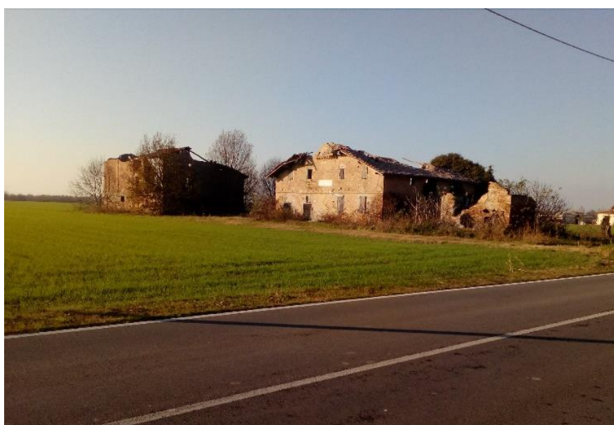
Casa colonica. Ubicata un po' prima del Castello di Bevilacqua; attualmente in restauro

Oggi in bicicletta siamo andati a Bevilacqua (frazione di Crevalcore), Via Ponte della Guazzaloca . Di seguito alcuni esempi di case coloniche (vicino alla strada asfaltata) in stato di abbandono. Le foto sono state scattate nel ritorno; da Bevilacqua (piazzale della Chiesa) a Palata Pepoli.