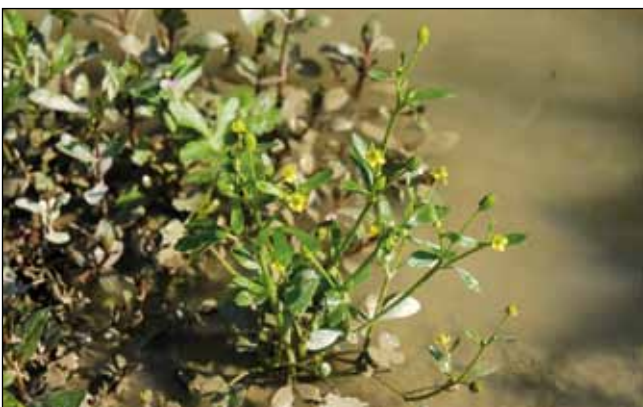
Abb. 46: Der Gift-Hahnenfuß ( Ranunculus sceleratus ) – nach DÜLL u. KUTZELNIGG (2005) rieben früher Bettler ihre sichtbaren Hautstellen damit ein, um Mitleid erregende Hautausschläge zu erzeugen.

Nährstoffe gibt es auf den Anlandungen und in den Buchten der Stauseen im Überfluss. Zigtausende Wasservögel hinterlassen flächendeckende Mengen von Vogelkot und so manche Kadaver (Abb. 47). Im Gegensatz zum Hauptfluss, dessen nährstoffärmeres Wasser im Sommer kaum über 15 °C steigt (REICHHOLF 2001), herrschen in den Flachwasserbuchten oft hohe Wassertemperaturen, die man barfuß kaum aushalten kann. In diesen Zonen gedeihen hauptsächlich Grünalgenteppiche (Abb. 48). Für viele andere Organismen ist dieser Bereich scheinbar zu extrem. In den ersten Jahren führte ich die Untersuchungen der Anlandungen stets barfuß durch, bis ich qualvolle Nächte wegen der Zerkarien