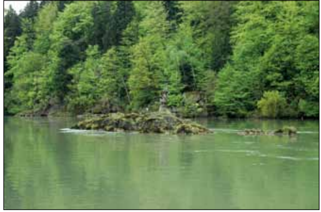
Abb. 61: Der „Johannesfelsen“ mit der „Nepomukstatue“ im wildromantischen Erosionstal des unteren Inns bei Wernstein. Er erinnert an die einstigen Gefahren, denen die Salzschiffer hier ausgesetzt waren.

Kirchdorf ein Exemplar der Blauen Gauklerblume ( Mimulus ringens ); dies war aber nur ein kurzes Stelldichein (HOHLA 2009). Etwas später, wenn am Morgen oft schon die herbstlichen Nebel schwer im Inntal liegen, blühen die Herbstastern ( Symphyotrichum lanceolatum u. S. x salignum – Abb. 60). Im Laufe der Jahrzehnte haben sich einige verschiedene Sippen an den Flussufern und auf den Anlandungen angesiedelt. Ob die Funde zweier kleiner Vorkommen des Froschbisses ( Hydrocharis morsus-ranae ) auf einer Schlammbank bei Kirchdorf am Inn und auf bayerischer Seite am Rand eines Altarmes in den Auen bei Simbach Pflanzen natürlicher Herkunft betreffen oder Einschleppung durch Wasservögel aus umliegenden Gartenteichen darstellen, lässt sich vermutlich nie klären. Diese Art galt einige Zeit als in Oberösterreich ausgestorben (HOHLA u. a. 2009).