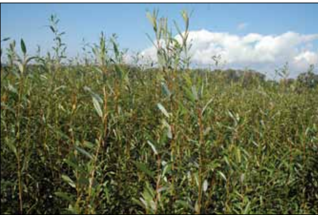
Abb. 29: Dichte Mandel-Weiden-Gebüsche ( Salix triandra subsp. amygdalina ) auf den Anlandungen in der Hagenauer Bucht.