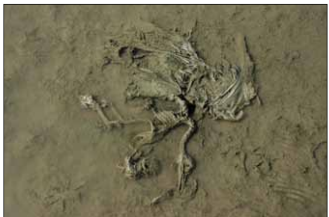
Abb. 47: Tausende Wasservögel in den Innstauseen auf engem Raum – da bleiben nicht selten auch Vogelkadaver liegen.