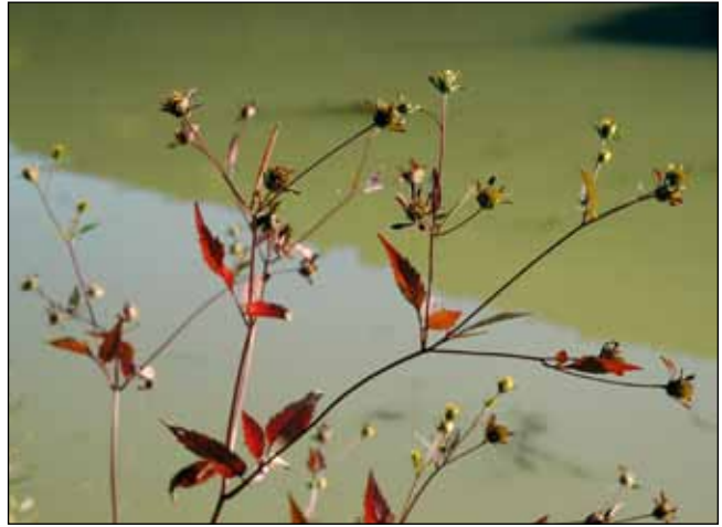
Abb. 55: Der Schwarzfrucht-Zweizahn ( Bidens frondosa ) – ein bei uns erfolgreich eingebürgerter Neophyt aus Nordamerika.

sich dabei aber auch um eine regional verschleppte Zierpflanze aus Gartenteichen handeln (HOHLA 2012).