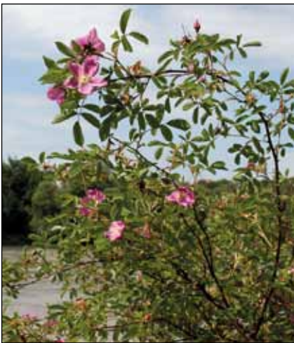
Abb. 62: Die Zimt-Rose ( Rosa majalis ) am Innufer zwischen Wernstein und Passau – eine elegante Erscheinung, die zwar Hochwässern erfolgreich trotzt, aber dennoch in Oberösterreich ums Überleben kämpft.

Kirchdorf ein Exemplar der Blauen Gauklerblume ( Mimulus ringens ); dies war aber nur ein kurzes Stelldichein (HOHLA 2009). Etwas später, wenn am Morgen oft schon die herbstlichen Nebel schwer im Inntal liegen, blühen die Herbstastern ( Symphyotrichum lanceolatum u. S. x salignum – Abb. 60). Im Laufe der Jahrzehnte haben sich einige verschiedene Sippen an den Flussufern und auf den Anlandungen angesiedelt. Ob die Funde zweier kleiner Vorkommen des Froschbisses ( Hydrocharis morsus-ranae ) auf einer Schlammbank bei Kirchdorf am Inn und auf bayerischer Seite am Rand eines Altarmes in den Auen bei Simbach Pflanzen natürlicher Herkunft betreffen oder Einschleppung durch Wasservögel aus umliegenden Gartenteichen darstellen, lässt sich vermutlich nie klären. Diese Art galt einige Zeit als in Oberösterreich ausgestorben (HOHLA u. a. 2009).