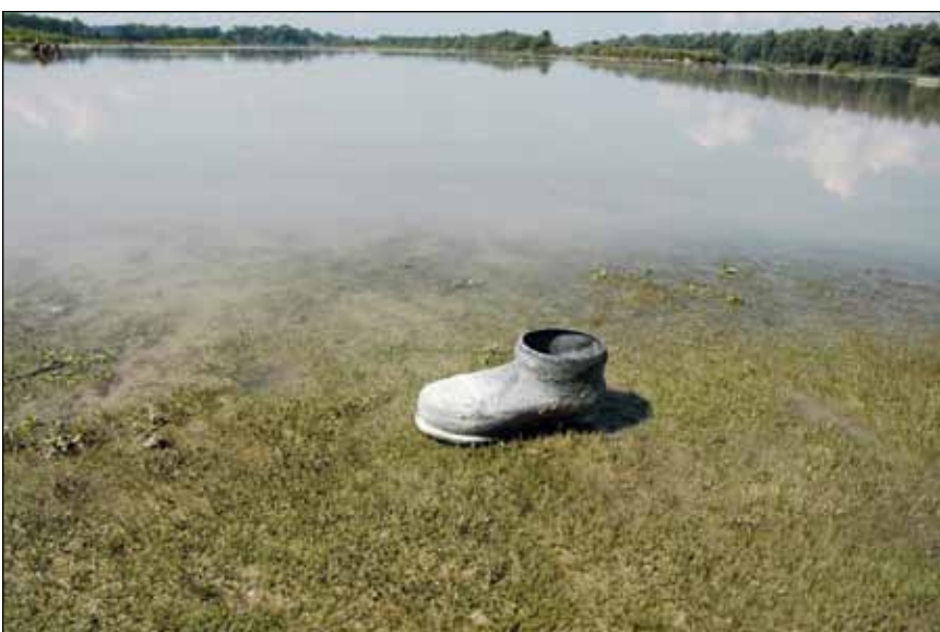
Abb. 50: Flachwasserbereich des Stausees bei Kirchdorf am Inn mit gerade trockenfallenden Rasen aus Nadel-Sumpfbirschen ( Eleocharis acicularis ). Ein Stiefel trotz dem Betretungsverbot!

Ein anderes Beispiel: Im Jahr 2003 trat Chenopodium glaucum – der Graue Gänsefuß (Abb. 51) – auf den Anlandungen der Hagenauer Bucht in großer Zahl auf. Seither ist diese Art aber dort verschwunden. Möglicherweise wurde dieses Massenvorkommen damals durch starke Regenfälle verursacht, wobei Samen des Grauen Gänsefußes aus einer Deponie, aus einer Kläranlage oder von Straßenrändern ausgeschwemmt wurden und durch Hochwasser auf den Anlandungen am unteren Inn landeten. Gelegentlich stößt man auf den Schlammflächen der Innstauseen nämlich auch auf einzelne verirrte Exemplare typischer Straßenbegleitpflanzen, wie zum Beispiel den Ruderal-Salzschwaden ( Puccinellia distans ) oder die Späte Rispenhirse ( Panicum dichotomiflorum ) im Jahr 2011 in der Hagenauer Bucht.