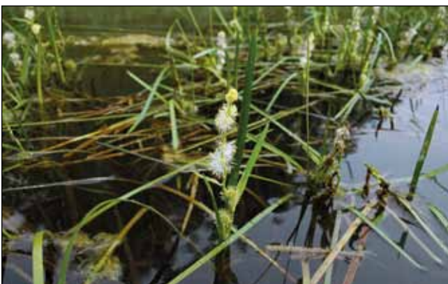
Abb. 13: Der Astlose Igelkolben ( Sparganium emersum ) mit seinen anmutig flutenden, langen Blättern – ein häufiger Anblick in den Sickergräben am unteren Inn – auch diese Wasserpflanze blüht nur in weniger bewegten Gewässerabschnitten wie hier in der „Riviera“ zwischen Braunau am Inn und Überackeren.