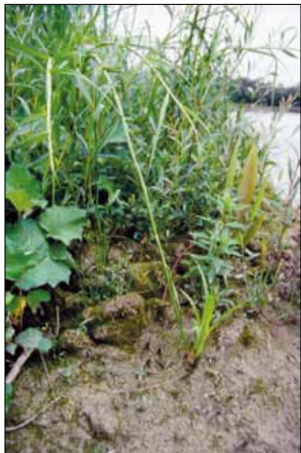
Abb. 57: Die Wurzelnde Waldbinse ( Scirpus radicans ) am Innufer bei Mühlheim – im Jahr 2001 nach einer Dammsanierung erstmals entdeckt. Eine sehr seltene Art der Flora Oberösterreichs, die an diesem Fundort inzwischen durch das sich ausbreitende Schilf wieder verdrängt wurde.

– auf der bayerischen Seite bei Frauenstein – vorkommt. Mit Sicherheit gelingt den „Donaupflanzen“ diese flussaufwärts gerichtete Ausbreitung vor allem mit Hilfe der Wasservögel. Auch bei der Wurzelnden Waldbinse ( Scirpus radicans – Abb. 57), die im Jahr 2001 nach einer Dammsanierung bei Mühlheim am Inn entlang einiger hundert Meter am Ufer wuchs, handelte es sich um eine klassische Art der Donauauen (HOHLA 2001).