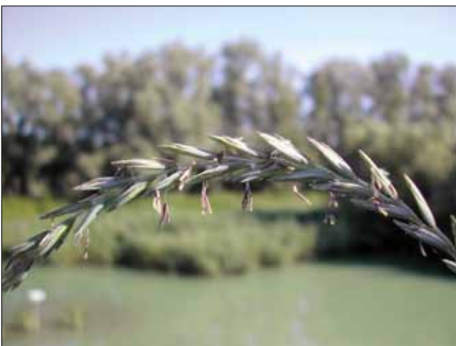
Abb. 9: Die Langgliedrige Quecke ( Elytrigia laxula ) – eine für die Wissenschaft neu beschriebene Gräserart – hier am Inn bei Bad Füssing/Bayern (HOHLA u. SCHOLZ 2011).

Bevor die Auen vom Hauptfluss durch Dämme getrennt wurden, waren Fluss und Auen eine Einheit. Die Flussdynamik wirkte auf das gesamte Flussbecken. Die alljährlichen Hochwässer verhinderten das Hochkommen dauerhafter Wälder, neue Schotter und Sande blieben liegen, offene Stellen boten Keimbedingungen für Pioniere, frische Nährstoffe wurden eingetragen, Faulschlamm entsorgt (Abb. 10). Sobald der Inn sich wieder auf ein Normalmaß zurückgezogen hatte, blieben Tümpel und Altarme