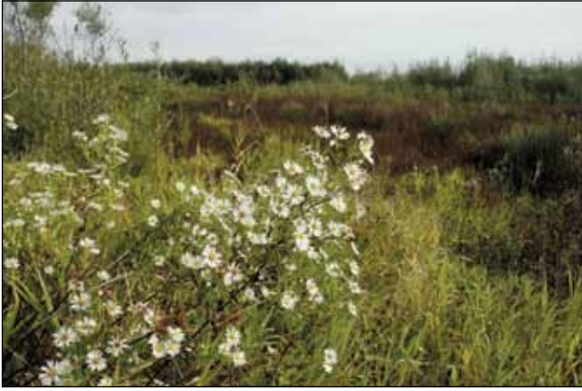
Abb. 60: Die verwilderte Lanzett-Herbstaster ( Symphyotrichum lanceolatum ) – ein Herbstblüher auf den Anlandungen des Stausees bei Kirchdorf am Inn – wächst auch gelegentlich in Ufergebüschchen von Salzach, Inn und Donau.