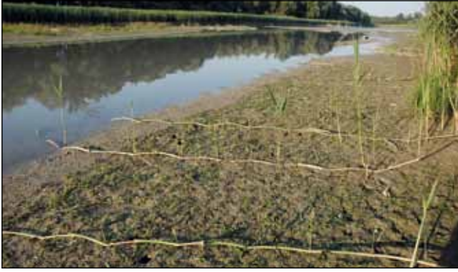
Abb. 31: Eine ufernahe Verlandungszone in den Auen zwischen Kirchdorf am Inn und Mühlheim wird vom angrenzenden Schilf ( Phragmites australis ) durch (bis zu 10 Meter!) lange oberirdische Ausläufer erobert.