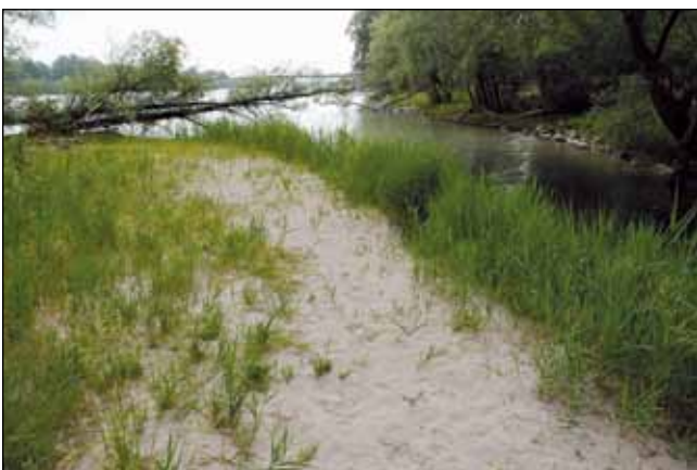
Abb. 5: Bänke aus hellem Flusssand – ein wichtiger Lebensraum für Flusspioniere am unteren Inn – heute beschränkt auf kleinste Bereiche unterhalb von Kraftwerken – hier in Obernberg am Inn.

nige Meter hoch an. Auf den ersten paar hundert Metern unterhalb der Kraftwerke zeigt der Alpenfluss seine Muskeln. Nur mehr dort darf er seine Dynamik wirken lassen, punktuell und kontrolliert. An diesen Ufern entwurzelt er mächtige Silberweiden und Pappeln, lässt ganze Gebüsch- oder Baumgruppen verschwinden, reißt den Bewuchs von den Steinen, sichtet Sandbänke um und schafft damit Platz für Neues (Abb. 4 u. 5). Genau an diesen wenigen Orten haben sich einige der einstigen Schotter- und Rohbodenpioniere noch halten können. Zu diesen Spezialisten gehören etwa das Ufer-Reitgras ( Calamagrostis pseudophragmites – Abb. 6), der Bunte Schachtelhalm ( Equisetum variegatum – Abb. 7), die Lavendel-Weide ( Salix eleagnos – Abb. 8) oder der Schweizer Moosfarn ( Selaginella helvetica ). So schnell die Wassermassen hochgehen, so rasch beruhigt sich der Inn meist auch wieder und hinterlässt große Mengen an Schwemmholz und Sand. Ich kann mich noch gut an einen alten Mann erinnern, der mit seinem Handkarren