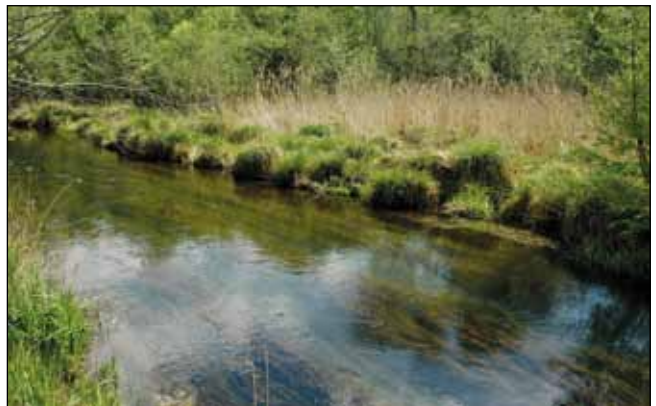
Abb. 20: Ein von Großseggenhorsten ( Carex paniculata und C. elata ) gesäumter Quellbach mit langen, in der Strömung elegant flutenden Fahnen des Kamm-Laichkrautes ( Potamogeton pectinatus ) in den Auen bei Mining.

cularia australis – Abb. 23), ein besonderes Kleinod, das sich von kleinsten Wassertierchen ernährt. Wo diese klaren Wasser sich im Mündungsbe- reich mit dem trüben kalten Wasser des Inns mischen, kommt es zu einem jähren Ende der Wasserpflanzen, da diese auf das Sonnenlicht angewiesen sind. Frisches Innwasser ist für die meisten untergetaucht lebenden