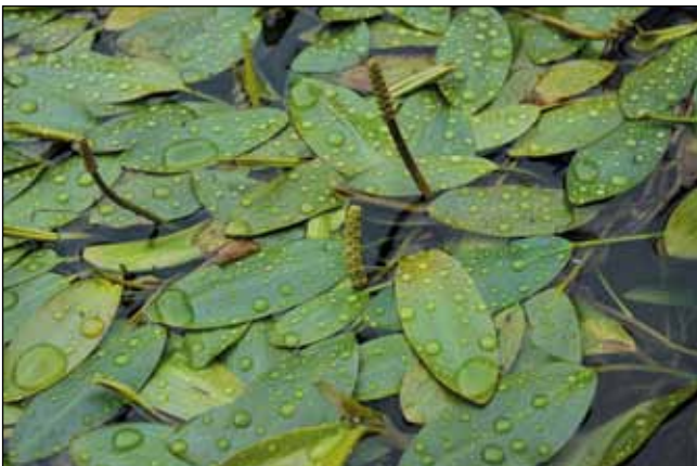
Abb. 19: Das Knoten-Laichkraut ( Potamogeton nodosus ), eine besondere Rarität auf der bayerischen Seite in einem Zubringerbach des Inns bei Simbach.