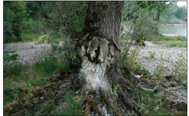
Abb. 4: Eine Pappel ( Populus cf. nigra ) am Innufer unterhalb des Kraftwerkes in Obernberg. Verletzungen durch Hochwassertreibholz führen – eine Spezialität von Weiden und Pappeln – zu vitalem Austrieb im Bereich der Wunden und zu Wurzelbrut.

Jahrhunderts kam die Innschiffahrt aber zum Erliegen, der begradigte Inn floss zu schnell und der Transport mit der Eisenbahn war kostengünstiger.