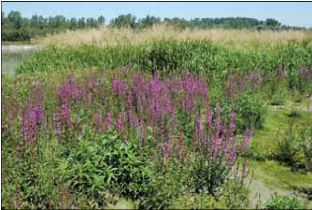
Abb. 33: Der rosa blühende Gewöhnliche Blutweiderich ( Lythrum salicaria ) – eine weitere Charakterart der sogenannten „Zweizahnfluren“ und dahinter das Riesen-Schwadengras ( Glyceria maxima ) – auf Anlandungen des Stauraumes Frauenstein knapp auf bayerischer Seite des Inns.