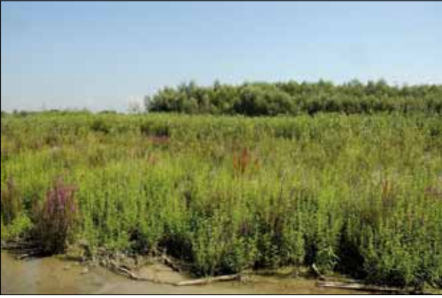
Abb. 27: Ein Musterbeispiel der Sukzessionsfolge: im Vordergrund dominieren Arten der „Zweizahnfluren“ wie Blutweiderich ( Lythrum salicaria ) und Wolfstrapp ( Lycopus europaeus ), es folgen Schilf- und Rohrkolbenröhrichte ( Phragmites australis u. Typha latifolia ), den Abschluss – im Bild hinten – bildet ein Wald aus verschiedenen Weidenarten ( Salix spp.).