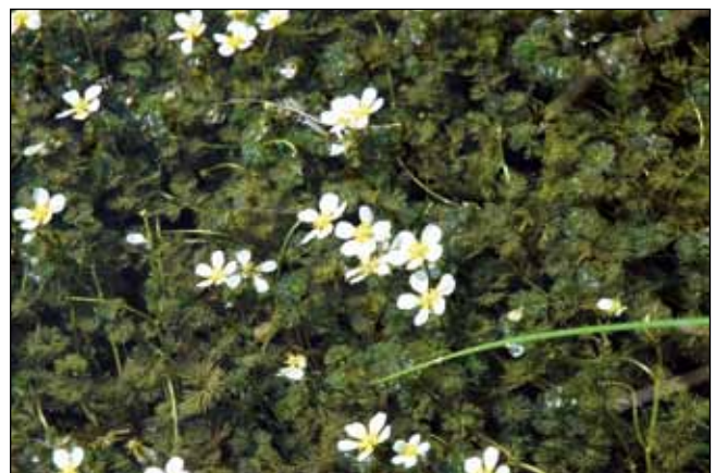
Abb. 14: Der Spreizende Wasserhahnenfuß ( Ranunculus circinatus ) – ein reizvoll weiß blühender Wasserhahnenfuß – ist in den Quellbächen, Sickergräben und nicht zu intensiv bewirtschafteten Fischteichen der Innauen noch verbreitet.

zurück. Die Trübung – das zerriebene Gesteinsmaterial („Gletschermilch“ oder „Gletschertrübe“) im Wasser – legte sich rasch und ermöglichte vielen Wasserpflanzen und -tieren den Fortbestand. Das Wasser aus den Quellen am Fuß der einst vom Fluss angeschnittenen Innleiten suchte sich seinen Lauf und fand den Anschluss an den Hauptfluss. Das Flussbecken wurde von alters her kaum besiedelt oder dauerhaft landwirtschaftlich genutzt, es gehörte dem Fluss. Lediglich Viehweide, Holzsuche und Jagd fanden statt, wenn dies der Fluss oder die Obrigkeit zuließen. Dies galt auch für die Goldwäscherei, die am Inn nachweislich stattfand. Im Heimathaus in Obernberg am Inn sind Urkunden und Münzen aus Inngold ausgestellt.