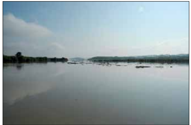
Abb. 24: Ein stimmungsvolles Foto der ruhigen Wasserfläche des Stausees bei Kirchdorf am Inn.