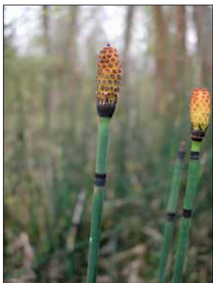
Abb. 58: Der Winter-Schachtelhalm ( Equisetum hyemale ) – im 19. Jahrhundert eine im Innviertel sehr seltene Pflanze – wächst heute in Massen in den Auen und an den Ufern von Salzach und Inn.

Da diese Pflanze noch niemals zuvor am Inn nachgewiesen wurde, liegt der Verdacht nahe, dass sie durch Baumaschinen eingeschleppt wurde. Bereits einige Jahre nach dem Fund wurde diese Pionierart durch Schilf und andere Uferpflanzen wieder verdrängt. Deren Samen warten jedoch dort mit Sicherheit auf die nächste Öffnung des Bodens.