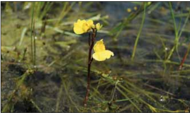
Abb. 23: Der Verkannte Wasserschlauch ( Utricularia australis ) ernährt sich von kleinsten Wassertieren, denen er mit Fangbläschen nachstellt. Er wächst ab und zu versteckt am Rand von Tümpeln oder Altarmen der Innauen.