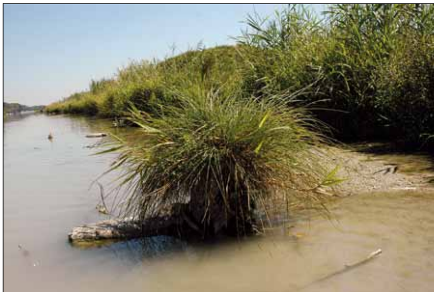
Abb. 38: Ein schopfiger Horst der Rispen-Segge ( Carex paniculata ) auf einem angeschwemmten Baumstrunk. Normalerweise hat diese Großsegge eine solche Steighilfe gar nicht nötig.

Im Saum der Röhrichte findet man eindrucksvolle Gewächse, wie etwa den mächtigen Fluss-Ampfer ( Rumex hydrolapathum – Abb. 35), die attraktive Große Zypergras-Segge ( Carex pseudocyperus – Abb. 36), den in der Fruchtphase leuchtend rot gefärbten Knäuel-Ampfer ( Rumex conglomeratus – Abb. 37) oder die großen Horste der Steif-Segge ( Carex elata ) und der Rispen-Segge ( Carex paniculata – Abb. 38). Die Wärme liebende Reisquecke ( Leersia oryzoides – Abb. 39) ist hingegen sehr unscheinbar und oft nur an den leuchtend-grünen, scharfschneidenden und auffällig rauhen Blättern zu erkennen, da sie nicht immer blüht. Besonders zartwüchsig ist die Sumpf-Rispe ( Poa palustris – Abb. 52), eine unauffällige Bewohnerin der Röhrichte, Schlammflächen, Ufer und Auwaldränder. Der Bittersüße Nachtschatten ( Solanum dulcamara ) ist eine der wenigen Kletterpflanzen