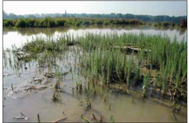
Abb. 49: Der Tannenwedel ( Hippuris vulgaris ) kommt in den Innauen und -Stauseen sowohl als Landpflanze auf Schlammflächen als auch in seiner Wasserform in Tümpeln und Teichen vor – hier in den Flachwasserzonen des Stausees bei Kirchdorf am Inn.

durchlebte. Diese hatten sich mich statt der üblichen Enten als Endwirt auserkoren. Der dadurch ausgelöste Juckreiz geht einem ordentlich unter die Haut!