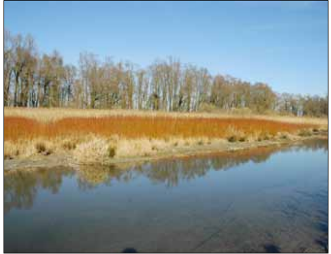
Abb. 28: Ein von Purpur-Weiden ( Salix purpurea ) beherrschtes Weidengebüsch auf einer trockengefallenen Schlammfläche in den Auen zwischen Kirchdorf am Inn und Mühlheim im Winteraspekt.