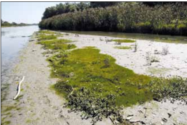
Abb. 42: Sattgrüne Rasen der Nadel-Sumpfbirse ( Eleocharis acicularis ), des Bach-Ehrenpreises ( Veronica beccabunga ) und des Wassersterns ( Callitriche palustris agg.) auf dem in der Sonne fett glänzenden Schlamm bei Frauenstein.