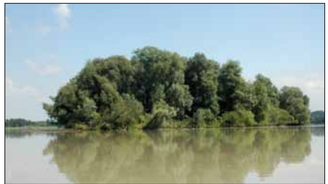
Abb. 26: Die „Vogelinsel“ im Stauraum des Kraftwerkes Obernberg-Eggfing – ein kleines, von Silber-Weiden ( Salix alba ) dominiertes Stück Urwald.

jedoch als zu massiv, das regelmäßige Ausbaggern als zu teuer. Man ließ die seitlich liegenden Zonen der Stauseen verlanden (Abb. 25). Es bildeten sich Binnendeltas und alte Flussrinnen zeigten sich wieder, wie ein Vergleich mit historischen Landkarten verdeutlicht (REICHHOLF-RIEHM u. REICHHOLF 1989, REICHHOLF 2004).