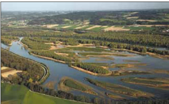
Abb. 25: Luftaufnahme der Hagenauer Bucht im Jahr 2010 mit ihren vielen Nebenarmen und Anlandungen.