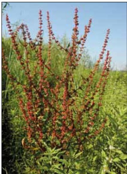
Abb. 37: Der Knäuel-Ampfer ( Rumex conglomeratus ) wird erst zur Fruchtzeit richtig dekorativ, wenn er sich knallig rot färbt.

im Sommer über diese zauberhafte Seenlandschaft schweifen lassen. Zu Tausenden wachsen diese beiden Arten auf den Schlammflächen der Stauseen. Zu den typischen Mitgliedern dieser feinen Gesellschaft zählen auch der Wasserpfeffer ( Persicaria hydropiper ), der Ufer-Ehrenpreis ( Veronica anagallis-aquatica – Abb. 34), der Bach-Ehrenpreis ( Veronica beccabunga ), der Wolfstrapp ( Lycopus europaeus – Abb. 27), die Wasser-Minze ( Mentha aquatica ), das Sumpf-Helmkraut ( Scutellaria galericulata ), Weidenröschen ( Epilobium parviflorum und E. hirsutum ), das Sumpf-Vergissmeinnicht ( Myosotis palustris agg.) und andere.