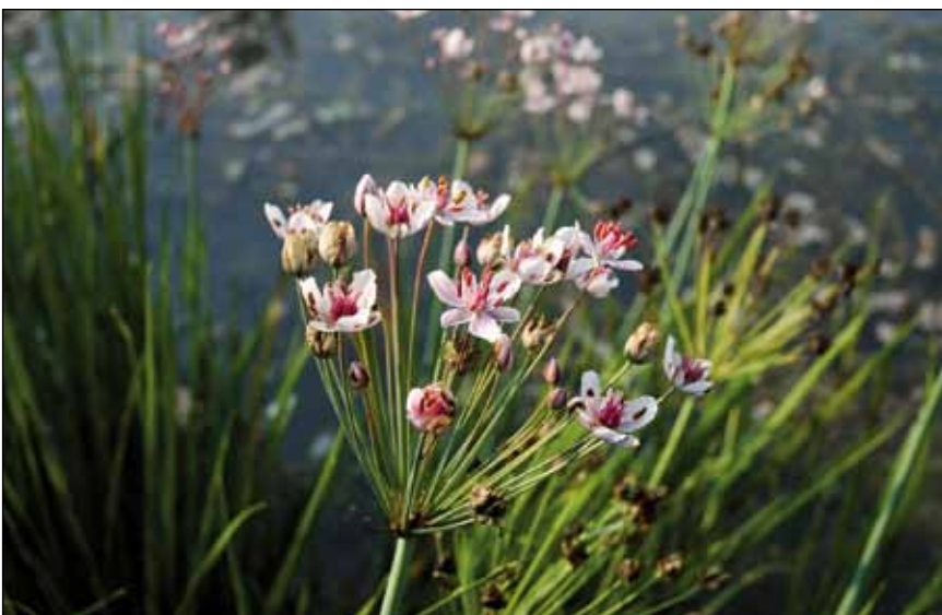
Abb. 56: Die Schwanenblume ( Butomus umbellatus ) – eine prachtvollere Pflanze – derzeit in leichter Ausbreitung am unteren Inn.

Seit dem Aufstau des unteren Inns kommt es auch zu einer Einwanderung von Pflanzen, die in der Vergangenheit vor allem aus dem Donaunraum bekannt waren. Der einst wilde und schäumende Inn – von den Römern „Oenus“ oder „Aenus“ genannt – ist nun einer Seenlandschaft gewichen, die den Charakterarten der Donau nicht ungelegen kommt. So befindet sich die in Oberösterreich vom Aussterben bedrohte Schwanenblume ( Butomus umbellatus – Abb. 56) am unteren Inn scheinbar in leichter Zunahme. Über Jahre hinweg waren einzelne Pflanzen in Reichersberg (HOHLA 2000) und in der Hagenauer Bucht (ERLINGER 1985, KRISAI 2000) die einzigen auf der österreichischen Seite des Inns. HOHLA (2006) berichtet über neue Wuchsorte auf bayerischer Seite. Eine weitere „Donauart“ ist das Große Schwadengras ( Glyceria maxima – Abb. 33), welches nun ebenfalls auf Anlandungen am unteren Inn