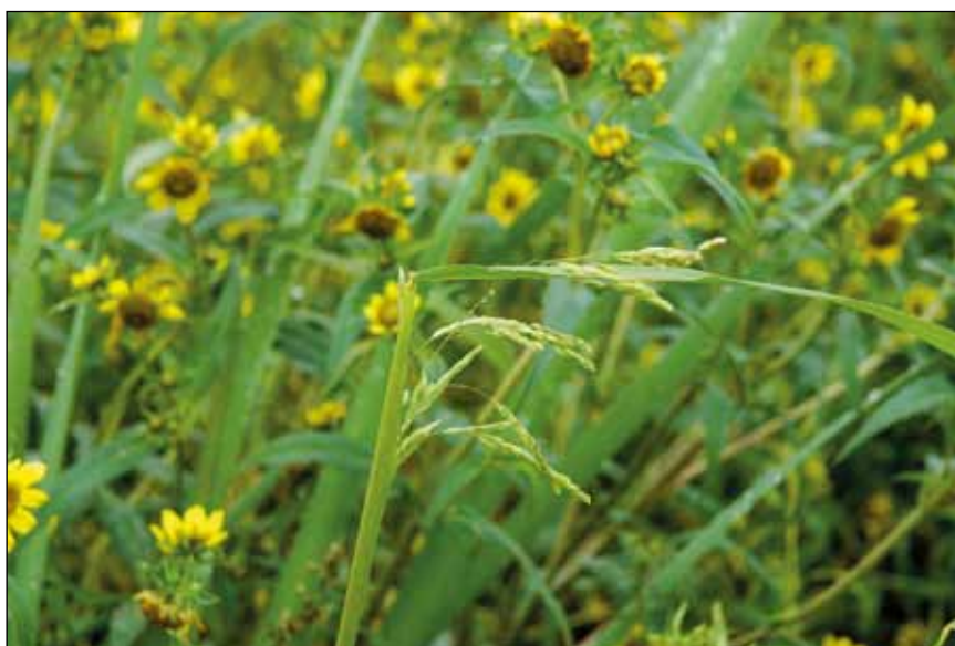
Abb. 39: Die Wärme liebende Europäische Reisquecke ( Leersia oryzoides ) konnte sich auf den Anlandungen der Stauseen stark ausbreiten. Sie kommt bei uns in kühleren Perioden oft nicht zur Blüte.

In den vergangenen zehn Jahren untersuchte ich regelmäßig die Schlammflächen der Stauseen am Unterlauf des Inns, einerseits im Zuge der Arbeiten an einer zukünftigen „Flora des Innviertels“, andererseits