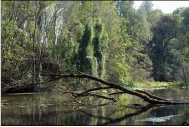
Abb. 21: Auwald bei Kirchdorf am Inn – die klaren Quellbäche der Gaishofer Auen vereinigen sich hier zu einem großen Pumpsteich.