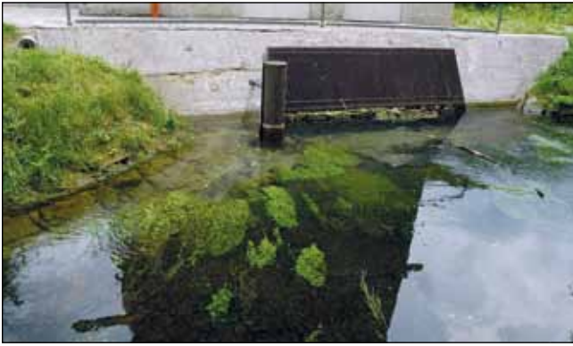
Abb. 11: In den klaren Wässern der Sickergräben und Pumpenteiche wächst eine Vielzahl von Wasserpflanzen – wie hier beim Pumpwerk in Braunau/Höft mit dem Krausen Laichkraut ( Potamogeton crispus ), dem Fischkraut ( Groenlandia densa ), dem Nussfrucht-Wasserstern ( Callitriche obtusangula ), der Berle ( Berula erecta ), der Unfruchtbaren Brunnenkresse ( Nasturtium x sterile ), der Kanadischen Wasserpest ( Elodea canadensis ) und dem Astlosen Igelkolben ( Sparganium emersum ).