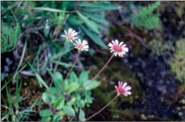
Abb. 3: Die Sternliebe ( Bellidiastrum michelii ) – ein seltener Gast aus den Alpen – hier in der Uferverbauung unterhalb des Kraftwerkes Frauenstein-Ering.