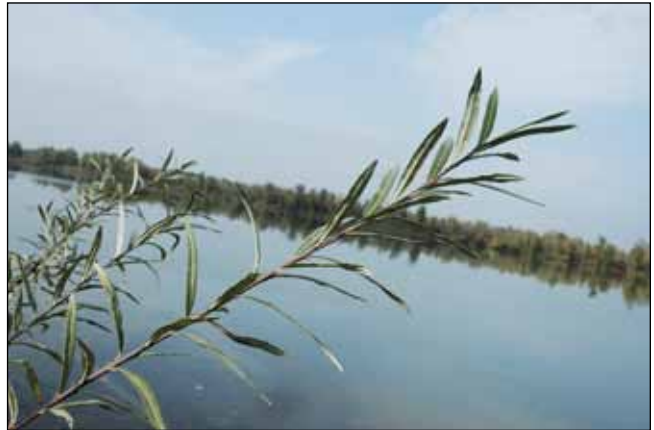
Abb. 8: Die Lavendel-Weide ( Salix eleagnos ) – ein Relikt der ehemaligen Schotterlandschaft des unteren Inns – hier am schottrigen Innufer zwischen Braunau und Überackern.

unterwegs war, um dieses Treibholz einzusammeln, um Feuerholz für den Winter zu haben. Heute macht sich niemand mehr diese Mühe – ein Zeichen des allgemeinen Wohlstandes. Auch für unsere abendlichen Feuer zum Wurst- oder Fischbraten und Geschichtenerzählen war für uns immer genug Holz vorhanden.