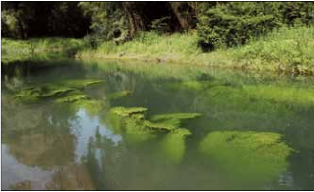
Abb. 15: Die großen Wasserstern-Teppiche ( Callitriche palustris agg.) sind elegante Gebilde – wie hier in der Enknach in Braunau kurz vor deren Mündung in den Inn. Sehr oft entwickeln diese Pflanzen jedoch keine Früchte, weswegen man dann die Art nicht bestimmen kann.