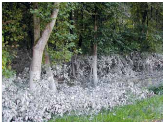
Abb. 10: Ein starkes Hochwasser wie jenes im Jahr 2005 hinterlässt in den Auen fruchtbare Spuren in Form von frischen Schwebstoffen – hier in der Au bei St. Florian am Inn.