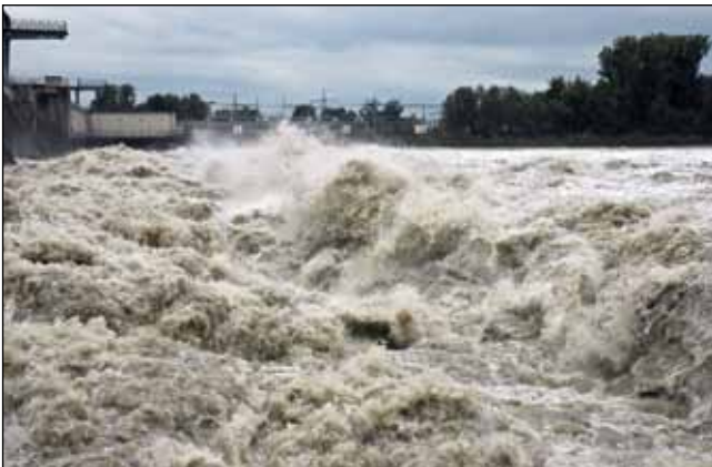
Abb. 1: Wassermassen von bis zu mehr als 5.000 Kubikmetern pro Sekunde donnern über die Schleusentore der Innkraftwerke – hier in Obernberg am Inn.

Über 5.000 Kubikmeter Wasser in der Sekunde und die Rekordhochwassermarken an den alten Häusern in Schärding oder Obernberg zeigen, warum der Inn auch heute noch Ehrfurcht einflößt, auch wenn viele Zeugen des großen Hochwassers 1954 heute nicht mehr leben oder die Erinnerungen daran nicht mehr so präsent sind. Viele Jahrhunderte waren die Menschen hierzulande vom Inn abhängig, sie lebten am, vom und mit dem Fluss, mussten seinem Rhythmus auf Gedeih und Verderb folgen. „Nahui, in Gotts Nam!“ hieß es jeweils voller Gottvertrauen bei der Abfahrt eines Schiffszuges (ABERLE 1974). Die Schifffahrt ernährte über Jahrhunderte die Bewohner der Städte und Dörfer am Inn. Es wurde so ziemlich alles transportiert, was sich handeln ließ. Flussabwärts waren es vor allem Salz, Holz, Marmor, Eisen, Kupfer, außerdem noch Wein aus Italien. Flussaufwärts wurden die „Plätten“ mit Hilfe von vielen Pferden gezogen („getreidelt“), wobei vor allem Getreide aus Ungarn und Niederbayern nach Tirol geliefert wurde und „Osterwein“ aus der Wachau und Ungarn (ABERLE 1974, HOHLA 2010). In Kriegszeiten wurden auf dem Inn sogar Truppen transportiert. Nach dem Bau der Eisenbahnlinien Mitte des 19.