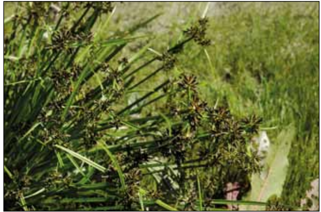
Abb. 45: Das Braune Zypergras ( Cyperus fuscus ) – ein weiterer typischer Bewohner der offenen Schlammflächen der Innstauseen.

Pflanzen, im raschen Blühen und der schnellen Bildung lang keimfähig bleibender, wasserbeständiger Samen besteht. Sind diese einmal im Boden deponiert, können wieder Jahrzehnte vergehen, bis eine neuerliche Öffnung des Bodens sie wieder zum Leben erweckt. Zu diesen Spezialisten zählen etwa die Nadel-Sumpfbirse ( Eleocharis acicularis – Abb. 42), der Sumpfquendel ( Peplis portula – Abb. 43), das Wasser-Quellgras ( Catabrosa aquatica – Abb. 44), das Gilb-Fuchsschwanzgras ( Alopecurus aequalis ), die Borsten-Moorbinse ( Isolepis setacea ), das Braune Zypergras ( Cyperus fuscus – Abb. 45), der Gift-Hahnenfuß ( Ranunculus sceleratus – Abb. 46), die Österreichische Sumpfbirse ( Eleocharis mamillaria subsp. austriaca ) und viele weitere Vertreter der sogenannten Zwergbinsengesellschaft.