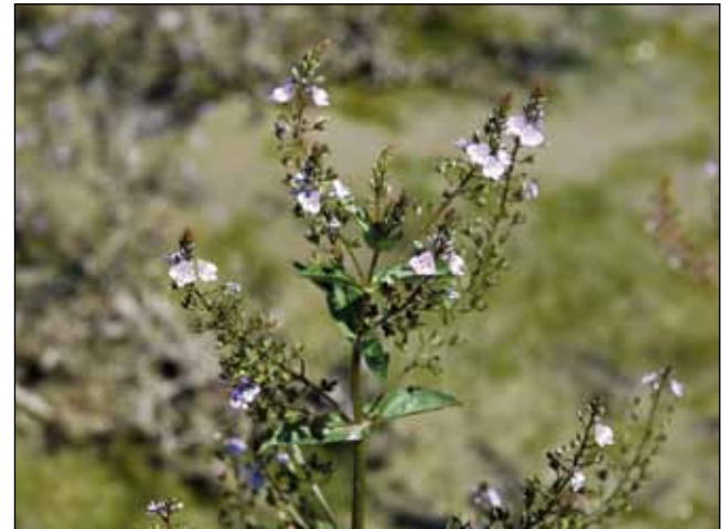
Abb. 34: Der Ufer-Ehrenpreis ( Veronica anagallis-aquatica ) – ebenfalls eine wichtige Art der „Zweizahnfluren“, die auch Unterwasserblätter bilden kann.