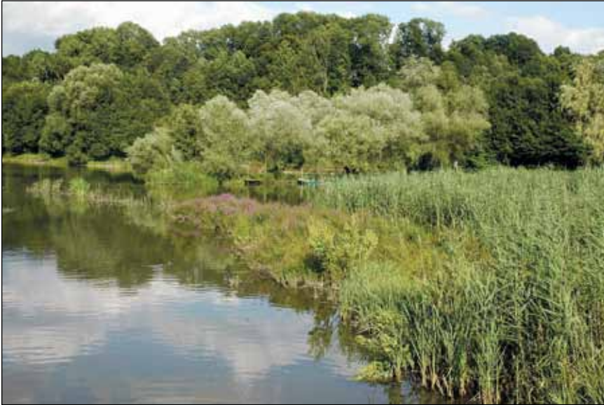
Abb. 40: Die Schwemmstoffe im Mündungsbereich des „Reichersberger Baches“ aus dessen Umland führten zu einer starken Verlandung in der Reichersberger Au.