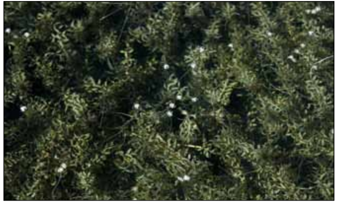
Abb. 16: Vergebliche Liebesmüh! Die Nuttall-Wasserpest ( Elodea nuttallii ) aus Nordamerika bildet oft Massenbestände in den Flachwasserbuchten, Altwässern, Teichen und Tümpeln am unteren Inn – die weiblichen Blüten strecken sich vergeblich an die Oberfläche – es fehlen in weiten Teilen Mitteleuropas die Männchen!