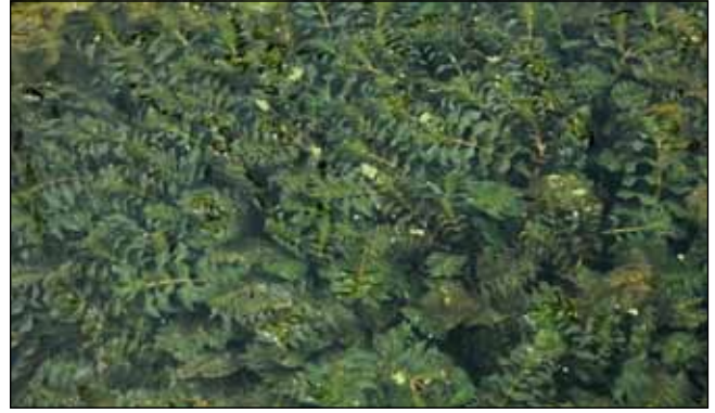
Abb. 22: Das Fischkraut ( Groenlandia densa ) – wird von den Besitzern der Fischteiche in den Innauen oft als Plage gesehen, so häufig tritt diese gefährdete Art der oberösterreichischen Flora dort auf – hier im Sickergraben bei Braunau am Inn.