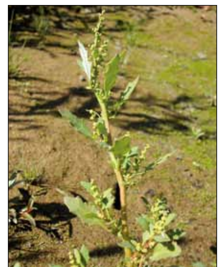
Abb. 51: Der Graue Gänsefuß ( Chenopodium glaucum ) trat im Jahr 2003 auf den Anlandungen der Hagenauer Bucht massenhaft auf, ist seither aber dort wieder verschwunden.