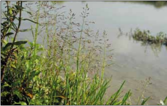
Abb. 44: Das Wasser-Quellgras ( Catabrosa aquatica ) – österreichweit vom Aussterben bedroht – auf den Anlandungen des unteren Inns aber nicht selten.