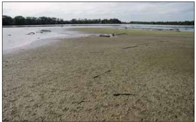
Abb. 30: Frische offene Schlammflächen im Stausee bei Kirchdorf am Inn mit Tausenden von Trittsiegeln der Wasservögel – aber noch frei von Pflanzenbewuchs.

26). Sie bildete sich bereits etwa 15 Jahre nach der im Jahr 1944 erfolgten Fertigstellung des Kraftwerkes Oberberg-Eggfing. Rasch durchliefen die offenen Flächen die Stadien der Sukzession. Nach den Erstbesiedlern wie Süßgräsern, Seggen oder Simsen folgte das Aufkommen von Röhrichtern und Weidengebüschen (Abb. 27) – vor allem von Purpur-Weide ( Salix purpurea – Abb. 28), Silber-Weide ( S. alba ) und Mandel-Weide ( S. triandra – Abb. 29). Schlussendlich setzte sich die Silber-Weide durch, die auf der „Vogelinsel“ und in den Auen am unteren Inn auch heute noch den Hauptaspekt bildet (Abb. 26). Man darf diese kleinen Auwälder inmitten des Inns getrost als die vermutlich einzigen richtigen „Urwälder“ Oberösterreichs betrachten, allerdings mit den kleinen Schönheitsfehlern, dass dieser Lebensraum zuvor vom Menschen geschaffen wurde und dass es sich dabei um sehr kleine Flächen handelt.