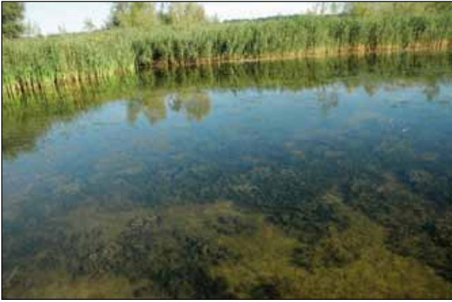
Abb. 54: Das Große Nixenkraut ( Najas marina subsp. marina ) in einem Nebenarm am bayerischen Ufer bei Aigen am Inn wächst nicht selten in den Buchten und Altarmen der Stauseen und Auen am unteren Inn.