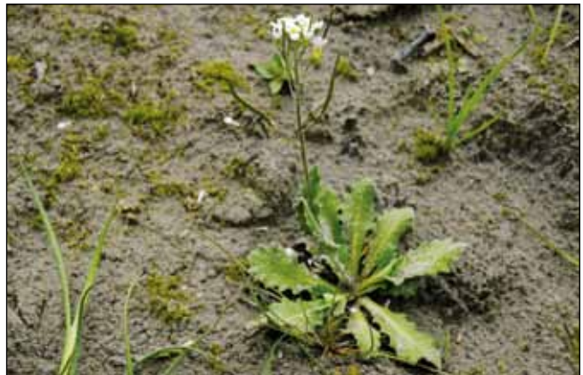
Abb. 2: Die Alpen-Gänsekresse ( Arabis alpina ) – ein „klassischer Alpinschwemmling“, der heute nur mehr sehr selten an den Ufern des unteren Inns landet.