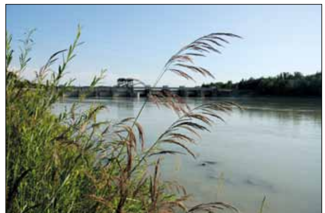
Abb. 6: Das Ufer-Reitgras ( Calamagrostis pseudophragmites ) – ein klassischer Pionier der Sandbänke am unteren Inn – heute eine stark gefährdete Art der Roten Liste Oberösterreichs!