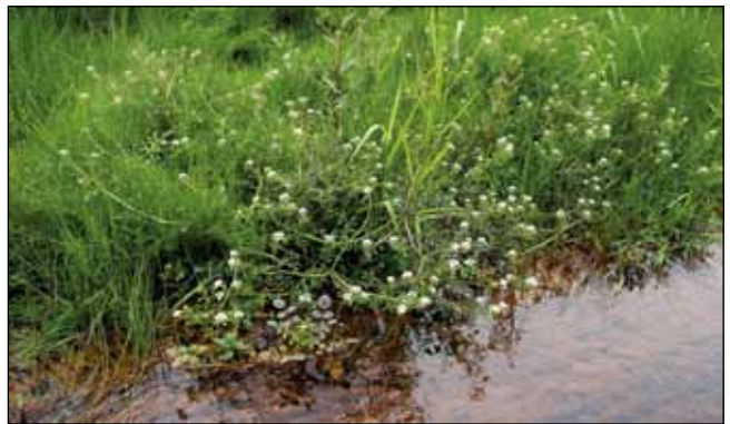
Abb. 18: Die Brunnenkresse ( Nasturtium officinale agg.) im Sickergraben der Reikersdorfer Au gemeinsam mit dem Sumpfschachtelhalm ( Equisetum palustre ) – der Sickergraben ist dort stark „verrostet“, ein natürlicher Prozess, bei dem Eisenbakterien zweiwertiges Eisen zu dreiwertigem oxidieren.