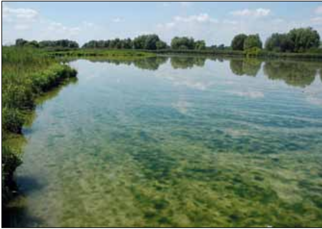
Abb. 48: In den seichten Buchten der Innstauseen wird das nährstoffreiche Wasser durch die Sonne so stark aufgeheizt, dass nur mehr Grünalgen dort bestehen können.