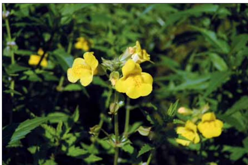
Abb. 59: Die Gelbe Gauklerblume ( Mimulus guttatus ) – eine aus Nordamerika stammende Zierpflanze, die sich heute auf den Schlammflächen der Innstauseen sehr wohl und fast schon heimisch fühlt.

Im Spätsommer, wenn ein Blütenmeer aus Nickendem Zweizahn ( Bidens cernua – Abb. 32), Blutweiderich ( Lythrum salicaria – Abb. 33) und anderen attraktiven Blütenpflanzen die Anlandungen der Innstauseen schmücken, ist auch die Zeit der etwas verrirren Gartenpflanzen gekommen. Zur Strahlkraft des Nickenden Zweizahns gesellt sich auf manchen Schlammflächen ein weiteres leuchtendes Gelb, das der Gauklerblume ( Mimulus guttatus – Abb. 59) aus Nordamerika. Diese Zierpflanze fühlt sich dort schon seit vielen Jahren wohl und fast heimisch. Erst vor wenigen Jahren fand ich auf den Flächen am Stausee bei