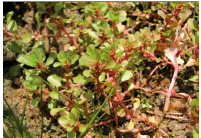
Abb. 43: Der Sumpfquendel ( Pepelis portula ) – ein typischer Schlammpionier der Innstauseen – kann manchmal Massenbestände bilden. Diese Pflanze mag es eher sauer.

um der Natura 2000-Gebietsbetreuung Daten zur Verfügung zu stellen.