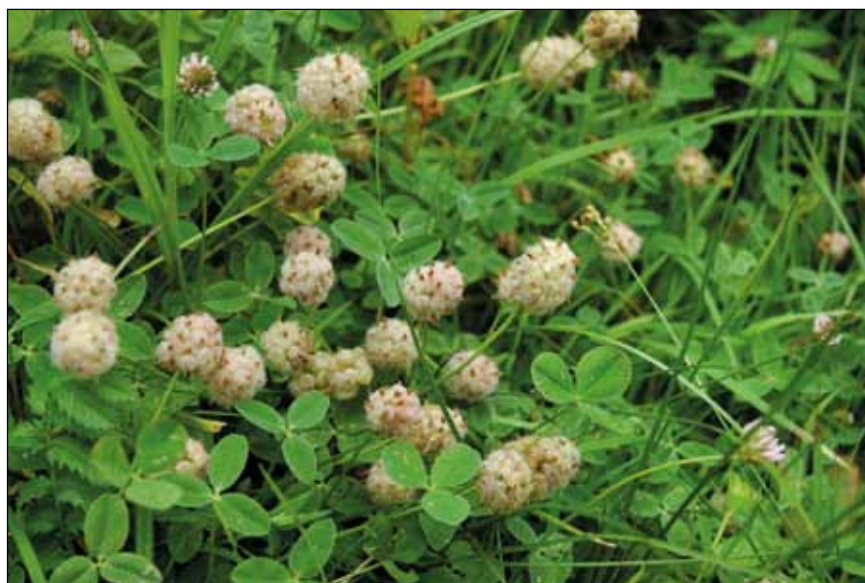
Abb. 53: Der mediterran bis submediterran verbreitete Erdbeer-Klee ( Trifolium fragiferum ) – eine heute in Oberösterreich sehr seltene Art – wurde vielleicht einst durch die Innschiffahrt eingeschleppt. Hier auf Flusssand am Uferweg nahe Schärding.

Der Fund des Amerikanischen Schwadengrases ( Glyceria grandis ) in der Hagenauer Bucht im Jahr 2011 war einer der ersten in Mitteleuropa. Dieser Neophyt dürfte ebenfalls durch Wasservogel eingeschleppt worden sein, denn in Nordeuropa ist dieses fremde Gras bereits seit vielen Jahren eingebürgert. Theoretisch könnte es