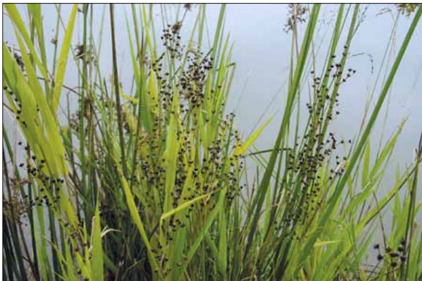
Abb. 52: Die Gebirgs-Simse ( Juncus alpinoarticulatus ) – eine herunter geschwemmte, Kalk liebende Art der Alpen (wo sie bis in die Alpinstufe reicht) – dazwischen die zierlichen Blütenstände der Sumpf-Rispe ( Poa palustris ) und die kräftigen, hellgrünen Blätter des Rohr-Glanzgrases ( Phalaris arundinacea ).