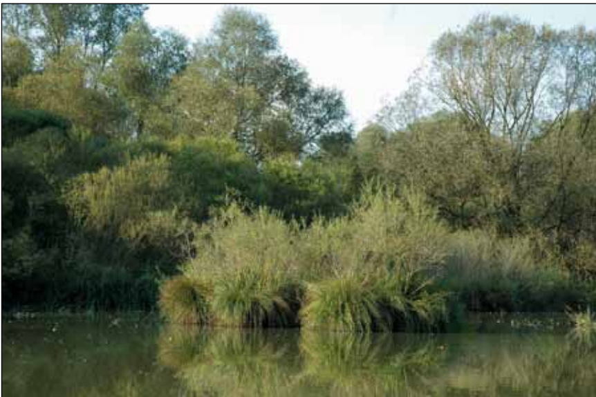
Abb. 41: Charakteristisch für die Reichersberger Au sind die vielen aus dem Wasser ragenden Großseggenhorste ( Carex paniculata u. C. elata ) und Weidengebüsche ( Salix purpurea , S. myrsinifolia , S. fragilis u. a.).