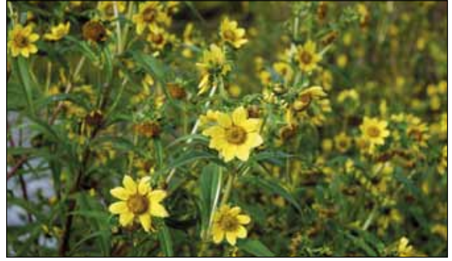
Abb. 32: Der Nickende Zweizahn ( Bidens cernua ) – heute eine der Charakterarten auf den Anlandungen der Innstauseen. Diese Art wuchs früher nicht selten an Dorfteichen, die jedoch größtenteils heute nicht mehr existieren.