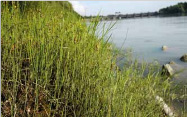
Abb. 7: Der Bunte Schachtelhalm ( Equisetum variegatum ) – eine Art der montanen bis alpinen Quell- und Rieselfluren sowie Niedermoore, der ebenfalls am unteren Inn an den sandig-kiesigen Ufern unterhalb der Kraftwerke wächst.