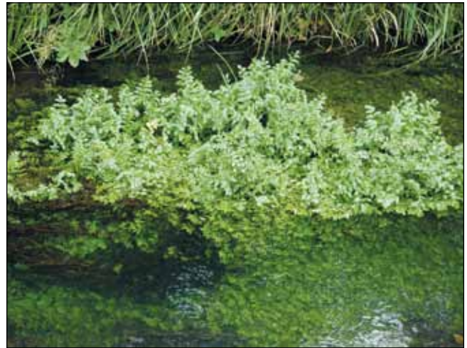
Abb. 12: Die Berle ( Berula erecta ) – eine häufige „Charakterart“ der Quellgewässer am unteren Inn – hier in einem Sickergraben bei Mühlheim am Inn, wo dieser Doldenblütler auch zur Blüte kommt. Oft sieht man nur die flutenden Unterwasserblätter.