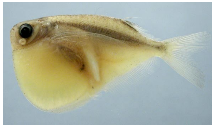
GASTEROPELECIDAE - Thoracocharax stellatus FMNH-106568