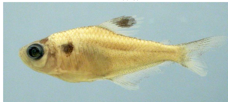
CHARACIDAE - Hyphessobrycon hasemani (adulto) FMNH-106274