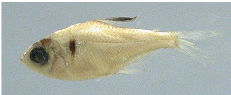
CHARACIDAE - Hyphessobrycon eques (juvenil) FMNH-106263