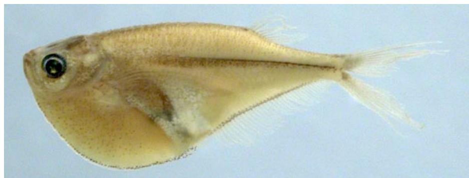
GASTEROPELECIDAE - Carnegiella myersi FMNH-106541