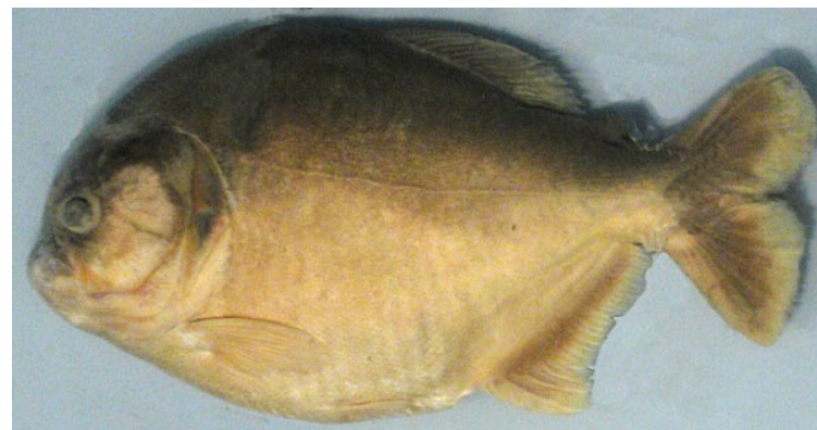
CHARACIDAE - Pygocentrus nattereri FMNH-107213