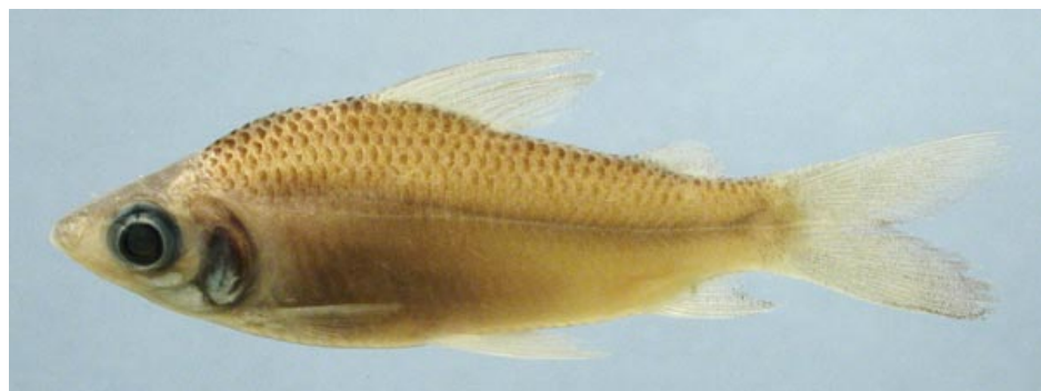
CURIMATIDAE - Curimatella meyeri FMNH-106586