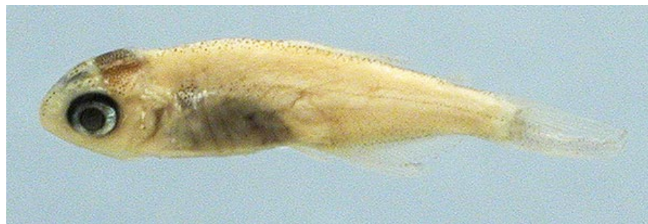
CHARACIDAE - Characidae sp. FMNH-107204