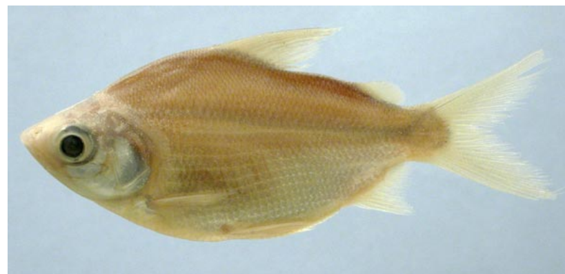
CURIMATIDAE - Psectrogaster curiventrtris FMNH-106594