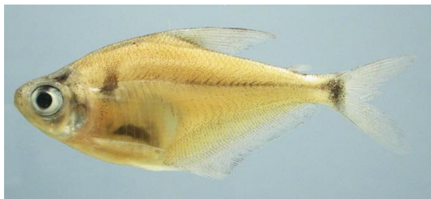
CHARACIDAE - Ctenobrycon hauxwellianus FMNH-106157