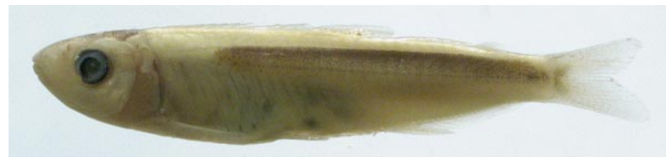
CHARACIDAE - Engraulisoma taeniatum FMNH-106209