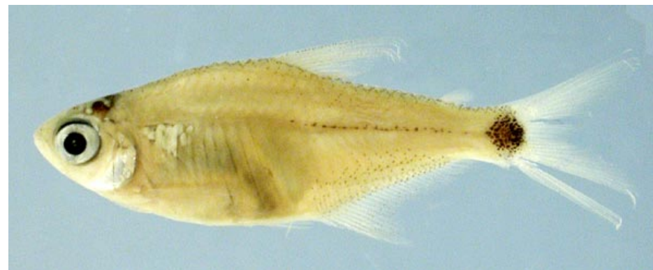
CHARACIDAE - Odontostilbe sp. FMNH-106428