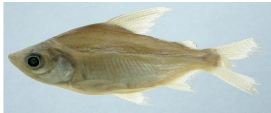
CURIMATIDAE - Potamorhina altamazonica FMNH-106590