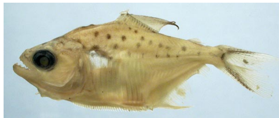
CHARACIDAE - Serrasalmus hollandi (juvenil) FMNH-106522