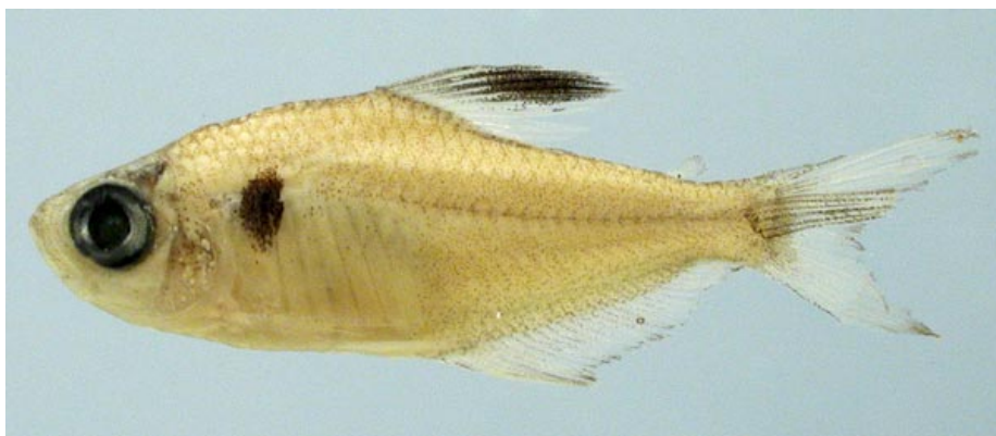
CHARACIDAE - Hyphessobrycon eques (adulto) FMNH-106276