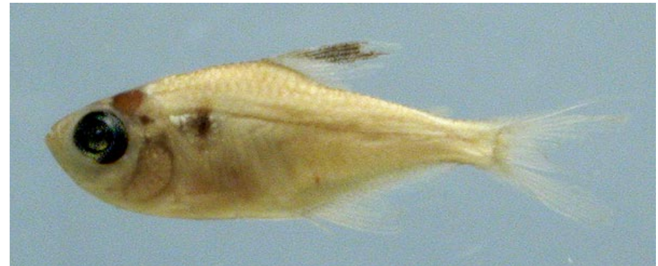
CHARACIDAE - Hyphessobrycon eques (juvenil) FMNH-106310