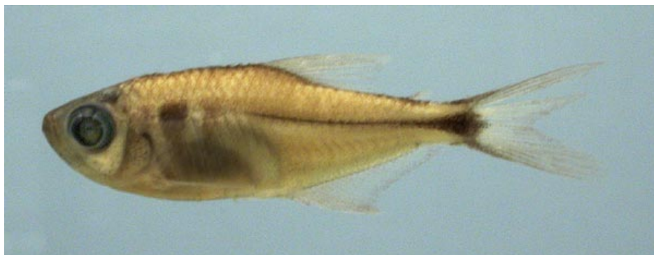
CHARACIDAE - Hemigrammus ocellifer FMNH-106231