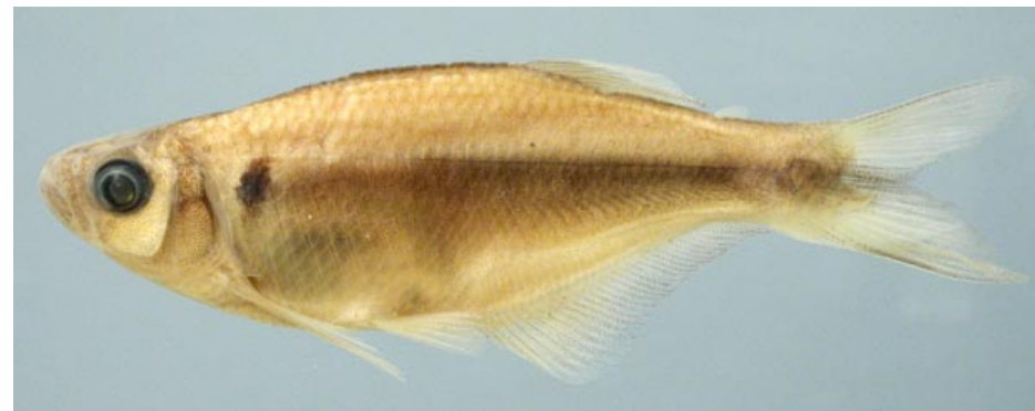
CHARACIDAE - Chrysobrycon sp. FMNH-106282