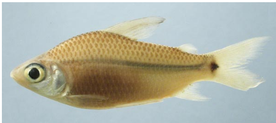
CURIMATIDAE - Curimatella dorsalis FMNH-106578