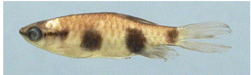
LEBIASINIDAE - Pyrrhulina vittata FMNH-106515