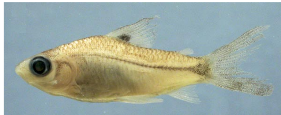
CURIMATIDAE - Steindachnerina guentheri FMNH-106614