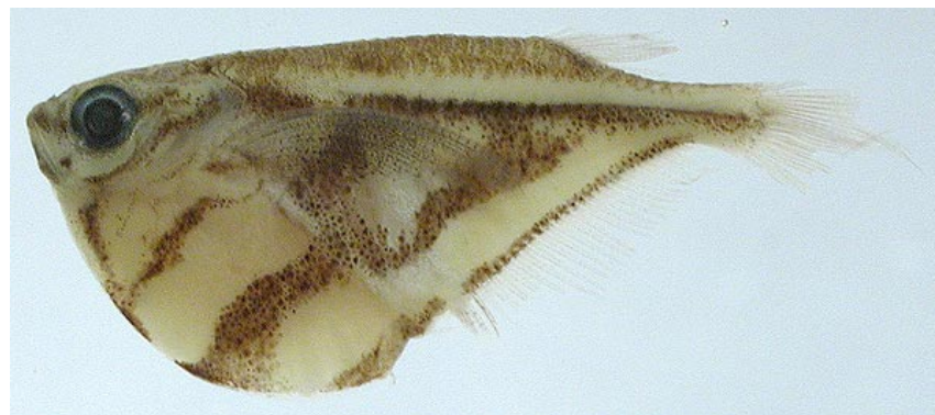
GASTEROPELECIDAE - Carnegiella strigata FMNH-106552