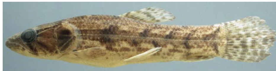
ERYTHRINIDAE - Hoplias malabaricus FMNH-106256