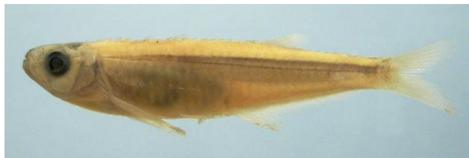
CHARACIDAE - Clupeacharax anchoveoides FMNH-106133