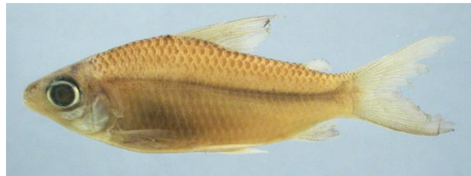
CURIMATIDAE - Curimatella immaculata FMNH-106558