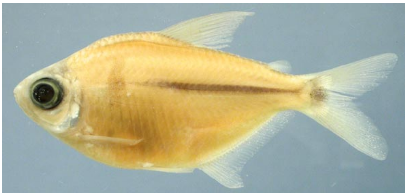
CHARACIDAE - Moenkhausia jamesi FMNH-106398