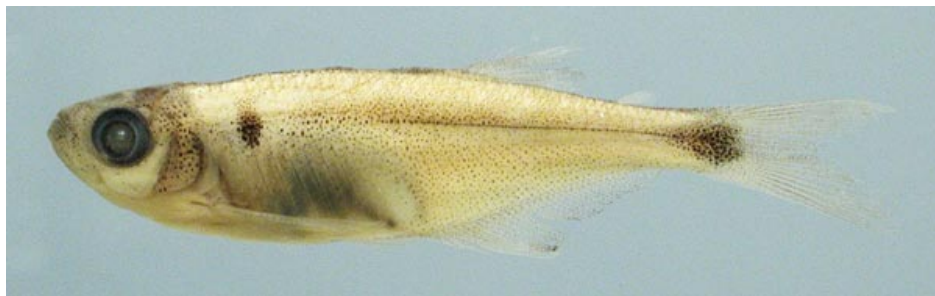
CHARACIDAE - Gephyrocharax sp. FMNH-106217