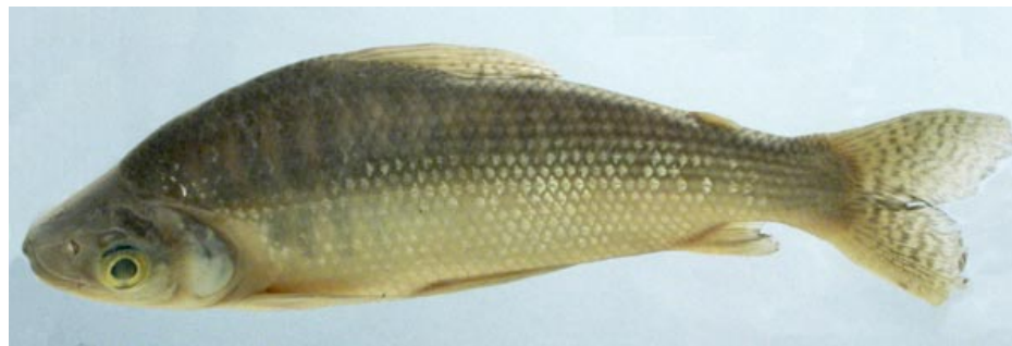
PROCHILODONTIDAE - Prochilodus nigricans FMNH-106593