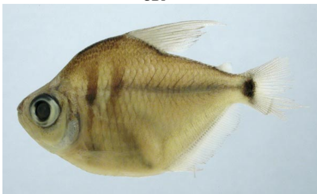
CHARACIDAE - Tetragonopterus argenteus FMNH-106528