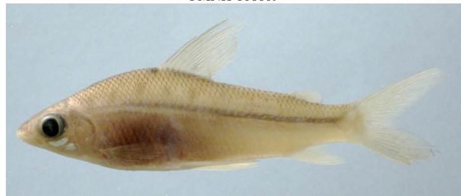
CURIMATIDAE - Steindachnerina leucisca FMNH-106615