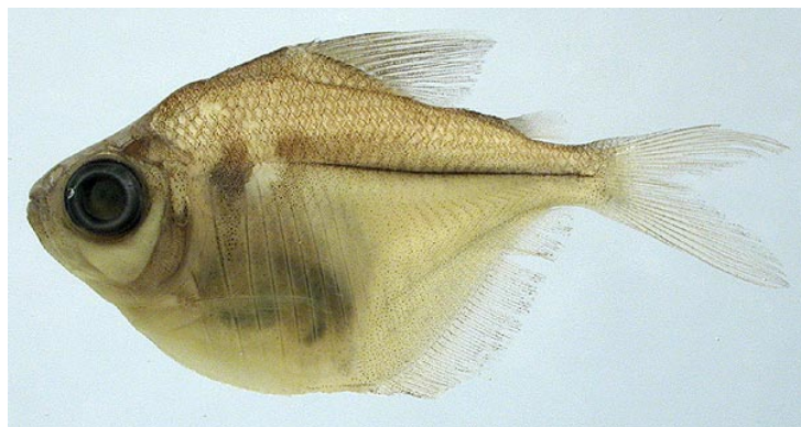
CHARACIDAE - Brachyhalcinus copei FMNH-106100