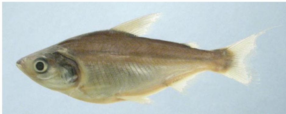
CURIMATIDAE - Potamorhina latior FMNH-106591