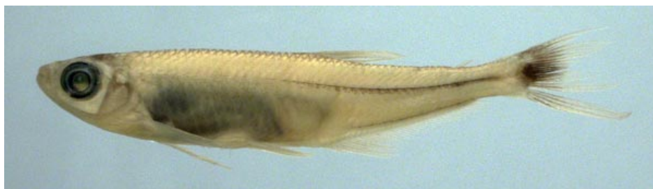
CHARACIDAE - Iguanodectes spilurus FMNH-106283