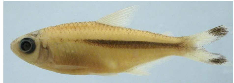
CHARACIDAE - Moenkhausia dichrourea FMNH-106390