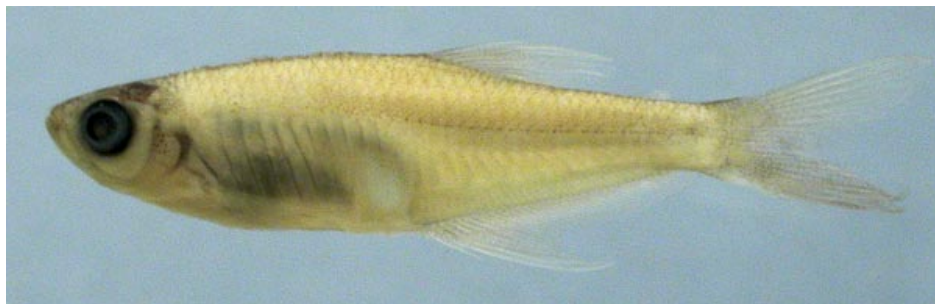
CHARACIDAE - Prionobrama filigera FMNH-106506