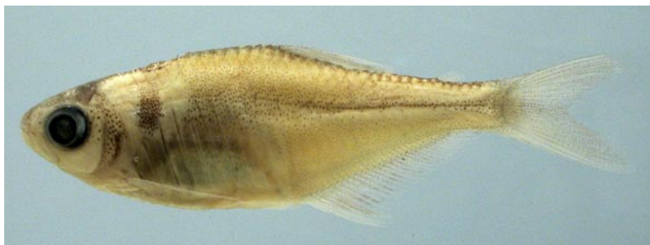
CHARACIDAE - Knodus smithi? FMNH-106295