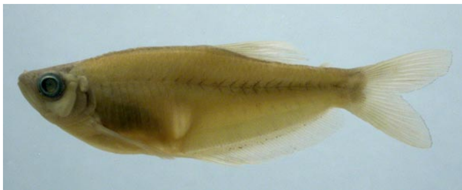
CHARACIDAE - Paragoniates alburnus FMNH-106462