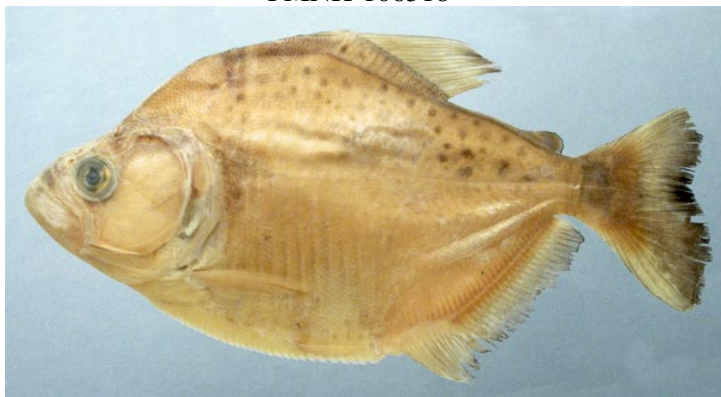
CHARACIDAE - Serrasalmus rhombeus (juvenil) - (grupo) FMNH-107217