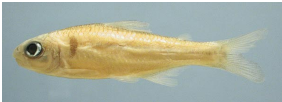
CHARACIDAE - Creagrutus sp. FMNH-106135