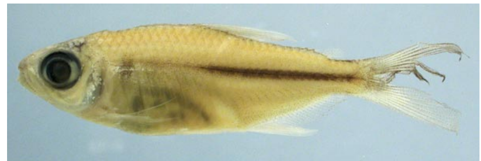
CHARACIDAE - Moenkhausia lepidura FMNH-106404