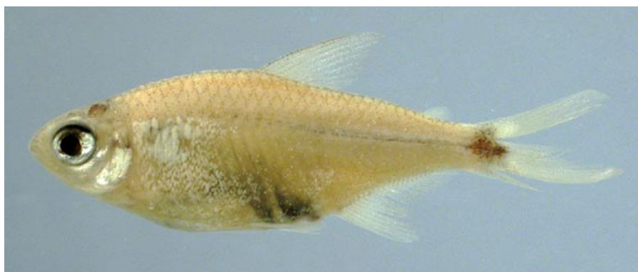
CHARACIDAE - Odontostilbe fugitiva FMNH-106431