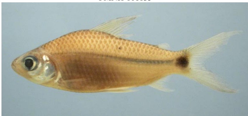
CURIMATIDAE - Cyphocharax spiluroopsis FMNH-106181