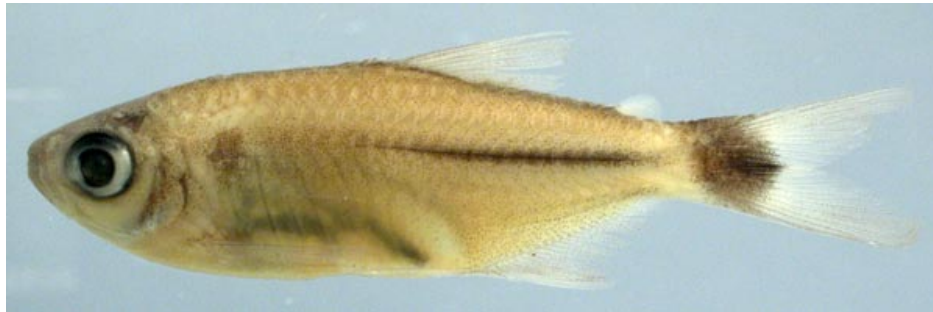
CHARACIDAE - Moenkhausia cotinho FMNH-106365