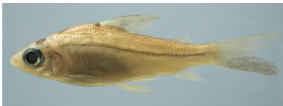
CURIMATIDAE - Cyphocharax sp. FMNH-106166