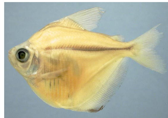
CHARACIDAE - Stethaprion crenatum FMNH-106526