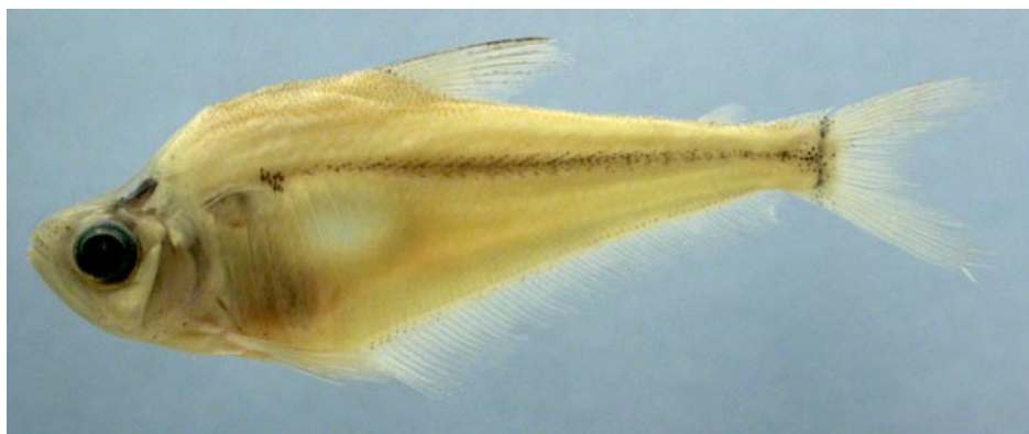
CHARACIDAE - Roeboides dispar FMNH-106518