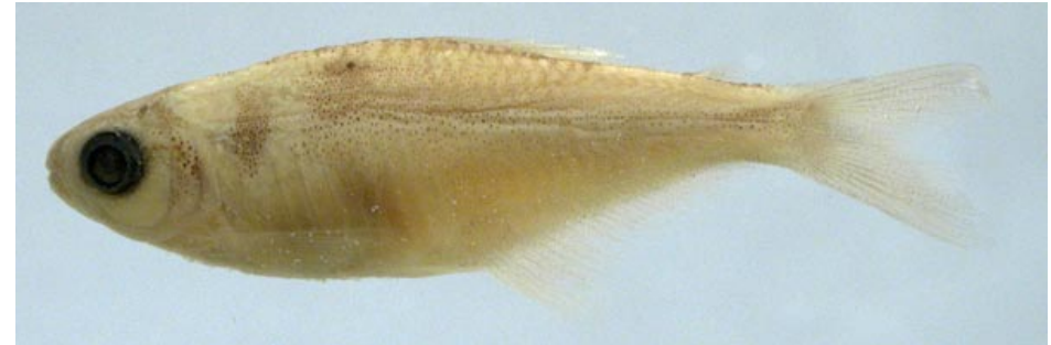
CHARACIDAE - Knodus smithi? FMNH-106287