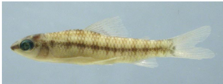
CHARACIDAE - Characidium sp. FMNH-106622