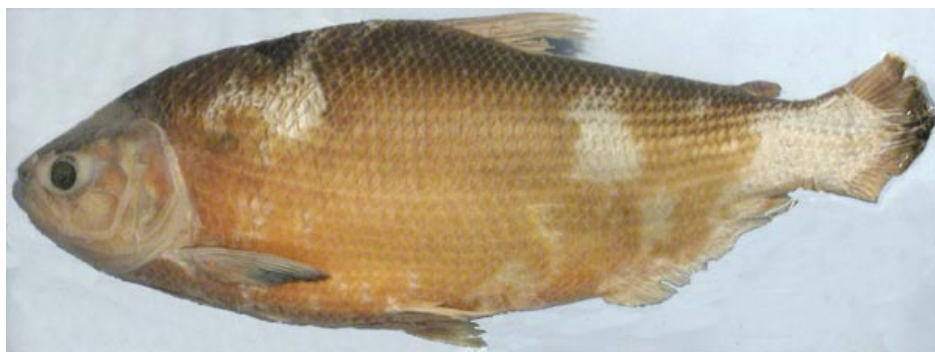
CHARACIDAE - Brycon sp. FMNH-107242