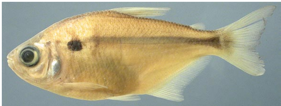
CHARACIDAE - Astyanax abramis FMNH-106099