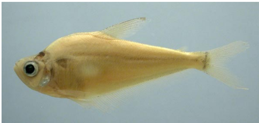
CHARACIDAE - Roebooides biserialis? FMNH-106211