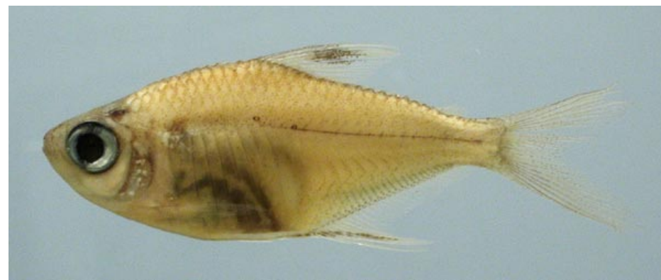
CHARACIDAE - Hemigrammus unilineatus FMNH-106239