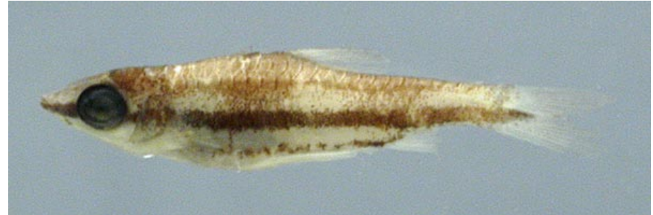
LEBIASINIDAE - Nannostomus trifasciatus FMNH-106637