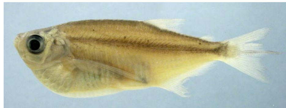
CHARACIDAE - Triportheus angulatus FMNH-106532