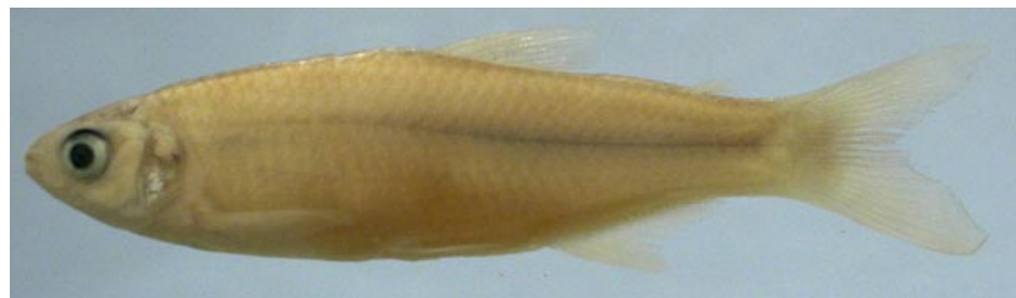
CHARACIDAE - Aphyocharax pusillus FMNH-106073 - 106078 - 106084