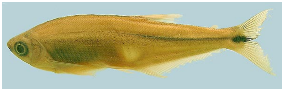
CHARACIDAE - Piabucus melanostoma CBF