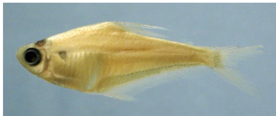
CHARACIDAE - Phenacogaster sp. FMNH-106465