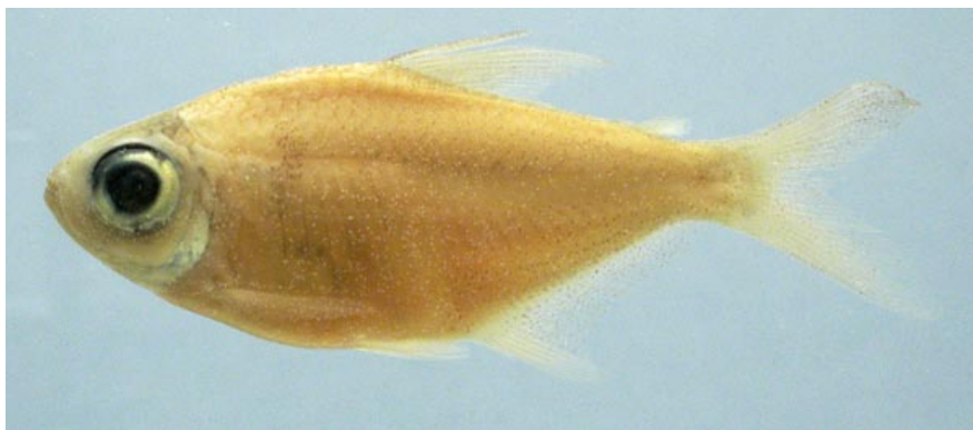
CHARACIDAE - Moenkhausia megalops FMNH-106407