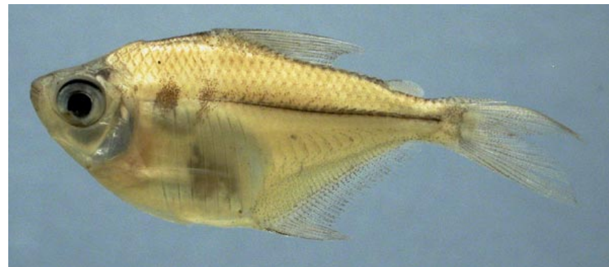
CHARACIDAE - Poptella compressa FMNH-106483