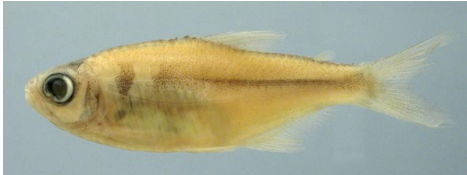
CHARACIDAE - Knodus mizquae? FMNH-106302