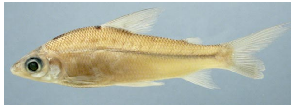
CURIMATIDAE - Steindachnerina sp. FMNH-106604