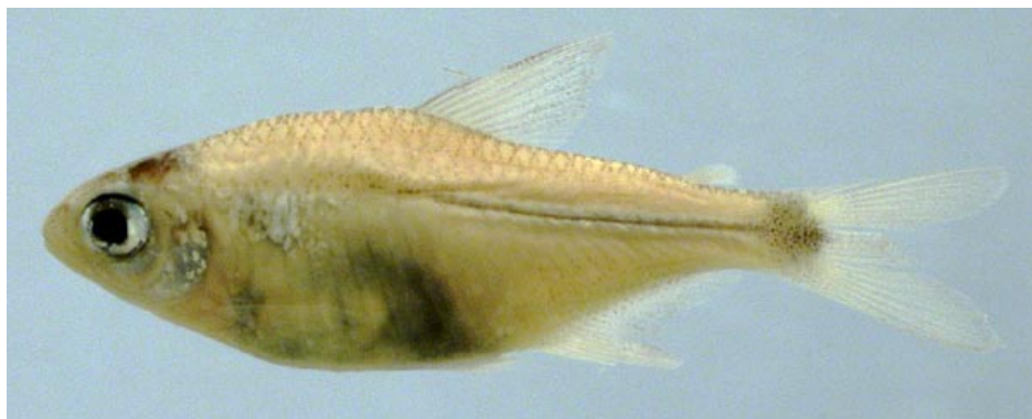
CHARACIDAE - Odontostilbe fugitiva FMNH-106445