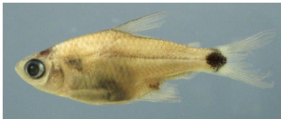
CHARACIDAE - Serrapinnus micropterus? FMNH-106112