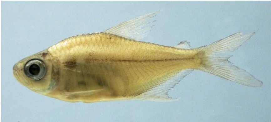
CHARACIDAE - Moenkhausia collettii FMNH-106343