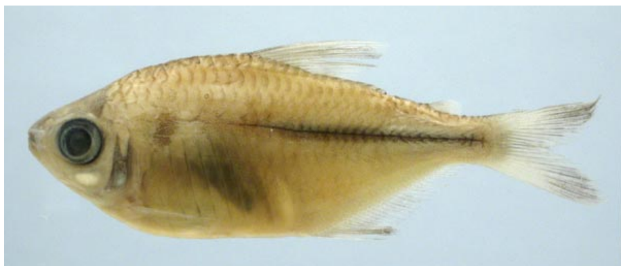
CHARACIDAE - Moenkhausia sp. FMNH-106318