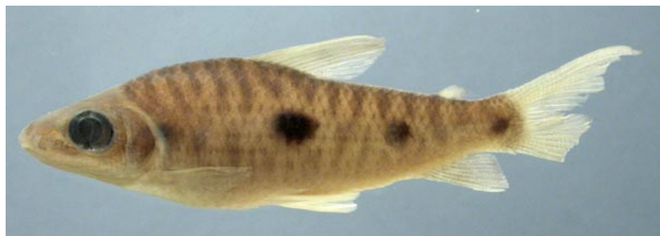
ANOSTOMIDAE - Leporinus friderici (juvenil) FMNH-106588