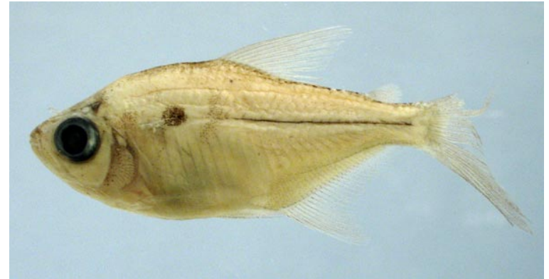
CHARACIDAE - Moenkhausia comma FMNH-106359