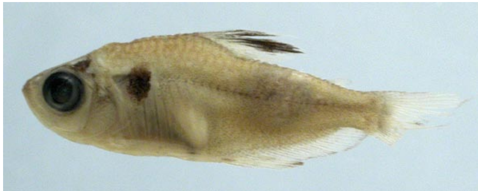
CHARACIDAE - Hyphessobrycon eques (adulto) FMNH-106309