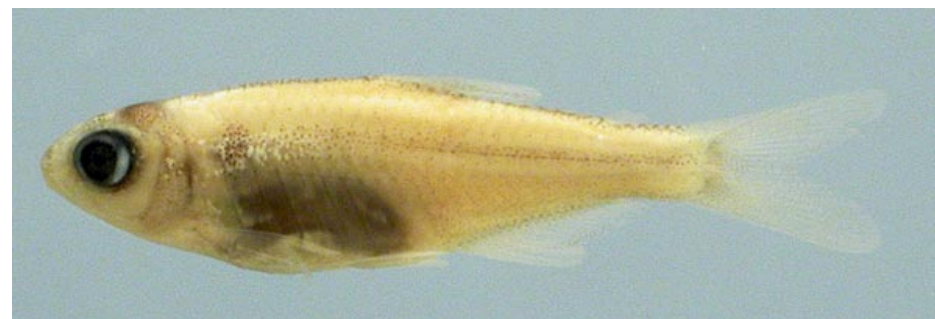
CHARACIDAE - Knodus mizquae? FMNH-106300