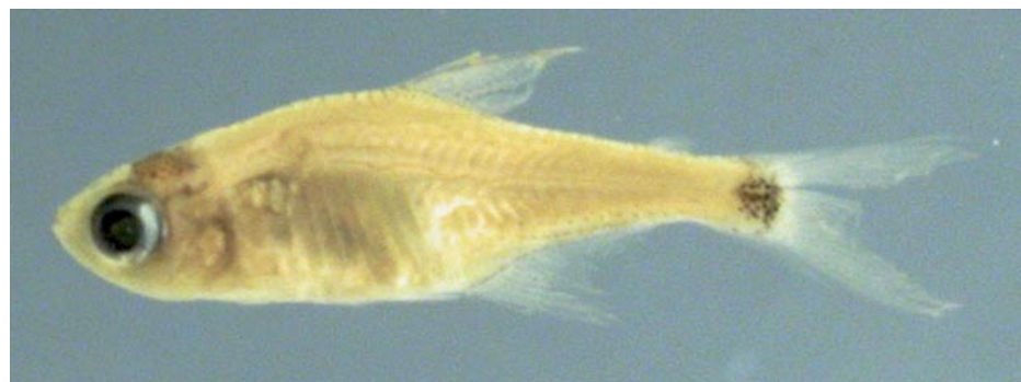
CHARACIDAE - Serrapinnus micropterus? FMNH-106109