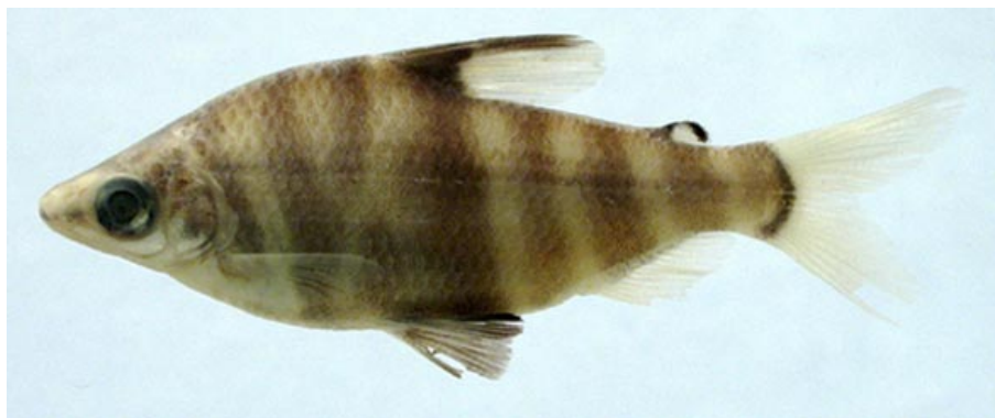
ANOSTOMIDAE - Abramites hypselonotus FMNH-106577