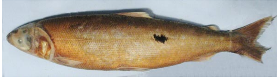
HEMIODONTIDAE - Anodus elongatus FMNH-107220