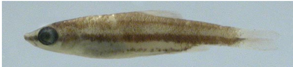
LEBIASINIDAE - Nannostomus sp. FMNH-106633