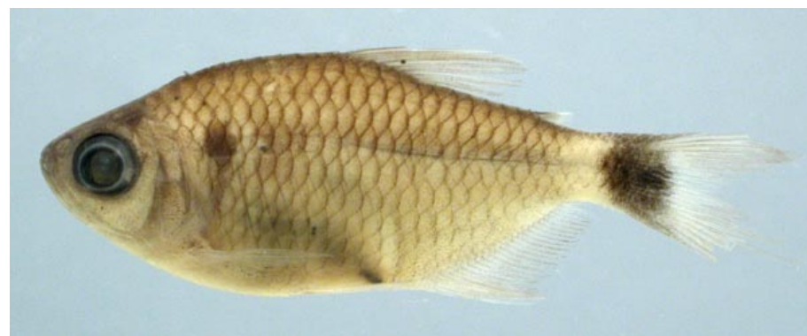
CHARACIDAE - Moenkhausia sanctaefilomenae FMNH-106418