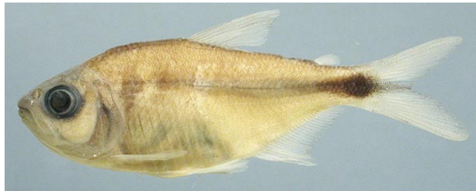
CHARACIDAE - Astyanax sp. FMNH-106086