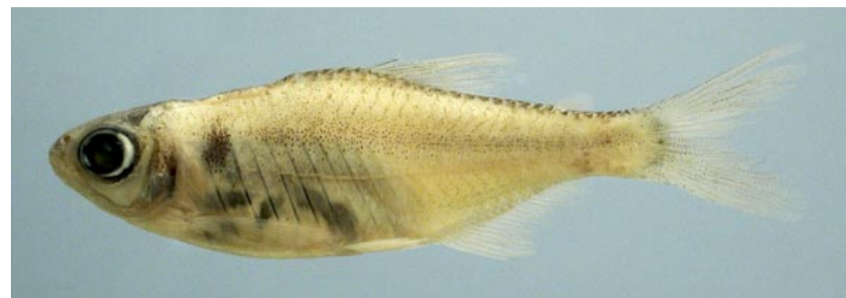
CHARACIDAE - Knodus mizquae? FMNH-106290