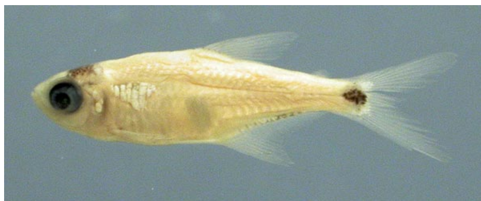
CHARACIDAE - Cheirodontinae sp. FMNH-106071