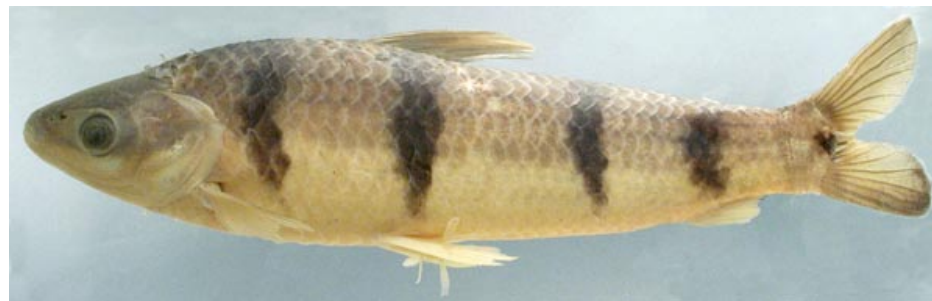
ANOSTOMIDAE - Schizodon fasciatus FMNH-107216