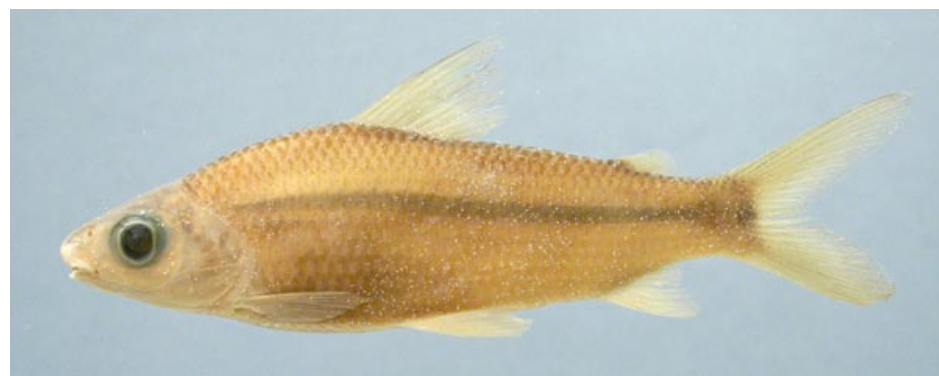
CURIMATIDAE - Steindachnerina dobula FMNH-106609