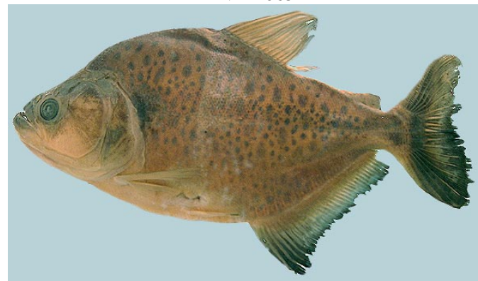
CHARACIDAE - Serrasalmus rhombeus (grupo) CBF