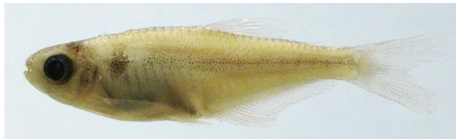
CHARACIDAE - Bryconamericus sp. FMNH-107207