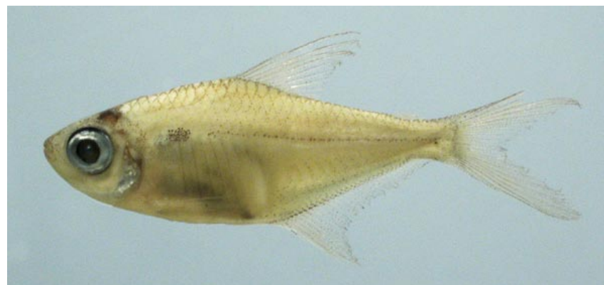
CHARACIDAE - Hemigrammus lunatus FMNH-106220