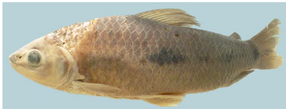
ANOSTOMIDAE - Leporinus friderici (adulto) FMNH-107221