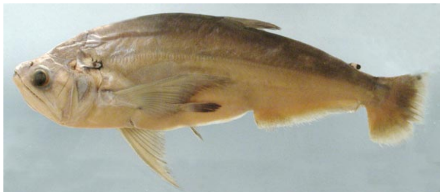
CYNODONTIDAE - Hydrolycus scomberoides FMNH-107210