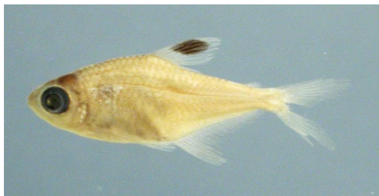
CHARACIDAE - Hyphessobrycon hasemani (juvenil) FMNH-106127