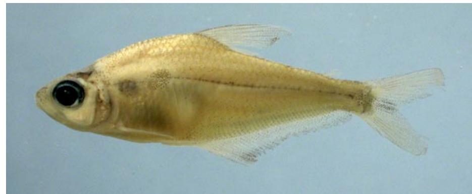
CHARACIDAE - Phenacogaster pectinatus FMNH-106472