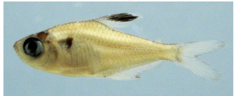
CHARACIDAE - Hyphessobrycon eques (juvenil) FMNH-106303