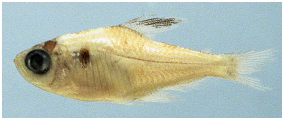
CHARACIDAE - Hyphessobrycon eques (juvenil) FMNH-106313