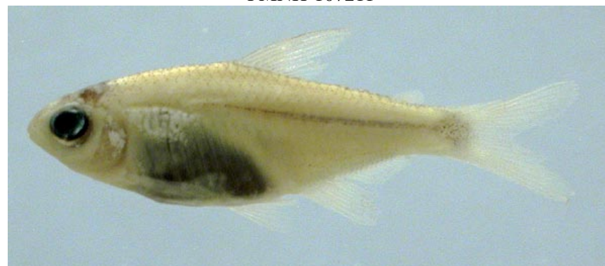
CHARACIDAE - Odontostilbe hasemani FMNH-106437