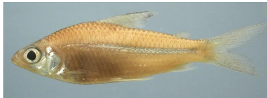
CURIMATIDAE - Cyphocharax plumbeus FMNH-106174