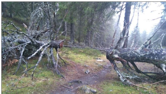
Figur 10. Eksempel på stirydding.

Dette gjøres ved å kappe vekk den delen av treet som ligger over stien, slik at stien åpnes igjen. Bestemmelsen gjelder innenfor stiens eksisterende bredde. Nedfall skal ikke fjernes fra reservatet eller ryddes i haug, men legges ved siden av stien.