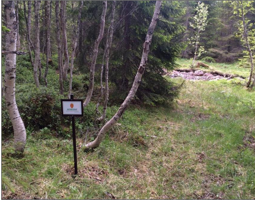
Figur 4. Verneskilt ved sti inn i Møytlaskardet naturreservat.

Det er viktig å informere folk som buker området om naturreservatet. Det er derfor satt opp verneskilt langs elva og ved andre naturlige innfallsporner til naturreservata. SNO er ansvarlig for å etterse og eventuelt vedlikeholde skiltmerkingen.