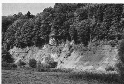
Steilhang (Kleb) im Unteren Muschelkalk. (Kochertal bei der Grimm bachmündung; Naturschutzgebiet)