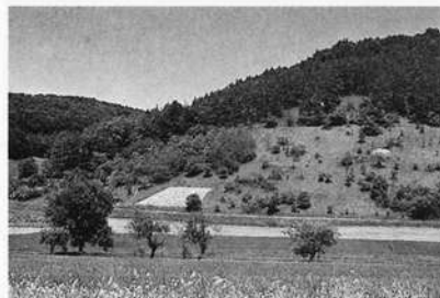
Naturschutzgebiet "Pfahl" bei Crispenhofen (Hohenlohekreis). Artenreicher Trockenrasen