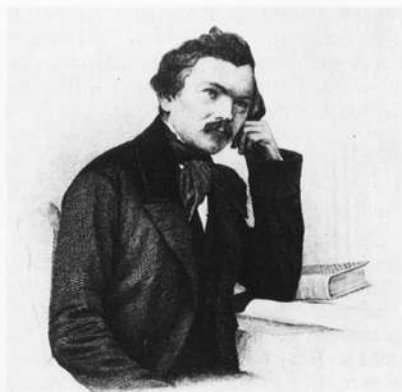
Christoph Weiss. Foto: Max Schleifer nach einem Kupferstich