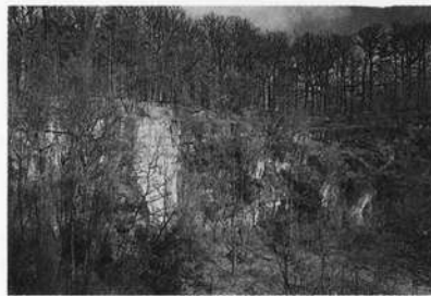
Schilsandsteinbruch beim Heilbronner Jägerhaus, Naturschutzgebiet am Rand der Großstadt. (Erholungsgebiet, geologisch und botanisch wertvoll)