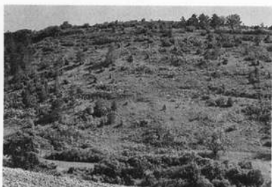
Naturschutzgebiet Hunsberg im badischen Tauberland. Wertvolle Trockenflora