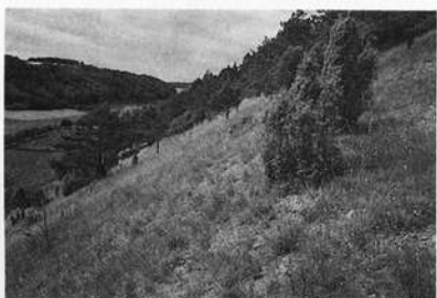
Naturschutzgebiet Stammberg b. Tauberbischofsheim. Extrem steiler, möglicherweise von Natur aus teilweise offener Trockenhang