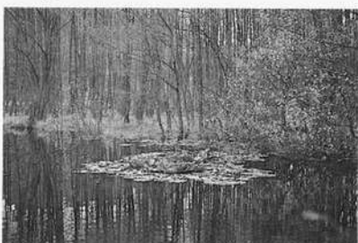
Naturschutzgebiet Kupfermoor am Fuß der Waldenburger Berge

und sie genießen bloß in Teilbereichen weitgehende Einschränkung der Nutzung. Fast die Hälfte erreicht zehn Hektar nicht; meines Wissen halten wir mit einem Naturschutzgebiet auf der östlichen Alb sogar einen Negativrekord: Es ist das kleinste der Bundesrepublik.