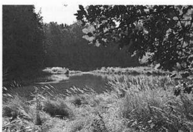
Naturschutzgebiet Reußenberg bei Crailsheim. Wassergefüllte Gipsdoline