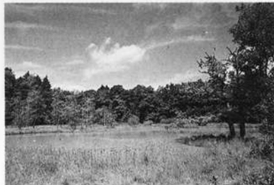
Naturschutzgebiet "Michelbacher Viehweide". Rest einer alten Waldweide mit Weiher auf der Kieselsandsteinhochfläche der Waldenburger Berge.