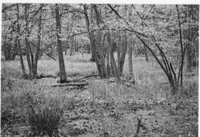
Erlenbruchwald auf der Hohenloher Ebene beim Lichteler Landturm. Naturschutzgebiet