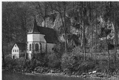
Jagsttalhang mit der St. Wendelskapelle bei Dörzbach. Kalktuffelsen, naturnaher Hangwald (Naturschutzgebiet)

Demgegenüber hört sich die Zahl der Schutzgebiete aus vorrangig zoologischen Gründen recht kümmerlich an: Sechs Brutgebiete des Graureihers, ein insektenreicher Trockenhang. Ein Ungleichgewicht, das nach Abbau der botanischen Einseitigkeit ruft! Aber die Fauna hat für eine ganze Reihe "botanischer" Schutzgebiete doch zusätzliche Argumente geliefert und keine Heide, keine Streuwiese, keine Schlucht, die nicht einer reichen und charakteristischen Tierwelt Lebensraum böte, mögen spezielle Untersuchungen auch meist noch ausstehen.