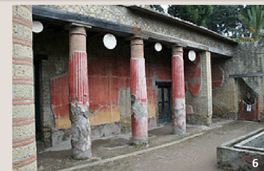
un péristyle orné d' oscilla

La cour du péristyle est ornée de plantations , souvent séparées par des allées : fleurs et arbustes sont structurés en parcelles géométriques et choisis pour leurs qualités esthétiques et odoriférantes. On y trouve également statues ou statuettes, vasques, fontaines ou bassins , parfois agrémentés de jets d'eau ; les piscinae abritent des poissons (« piscis » signifie « poisson » en latin).