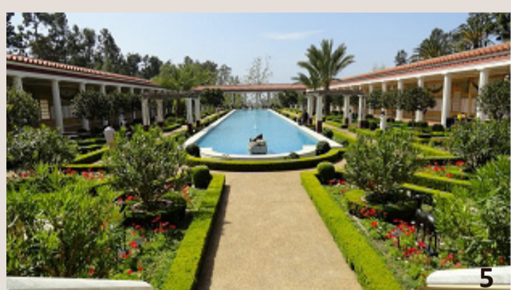
un péristyle à la végétation luxuriante

La cour du péristyle est ornée de plantations , souvent séparées par des allées : fleurs et arbustes sont structurés en parcelles géométriques et choisis pour leurs qualités esthétiques et odoriférantes. On y trouve également statues ou statuettes, vasques, fontaines ou bassins , parfois agrémentés de jets d'eau ; les piscinae abritent des poissons (« piscis » signifie « poisson » en latin).