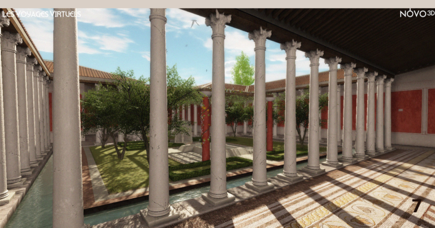
un péristyle au sol pavé de mosaïques

Le sol de la galerie est recouvert de dallage ou de pavements de mosaïques .