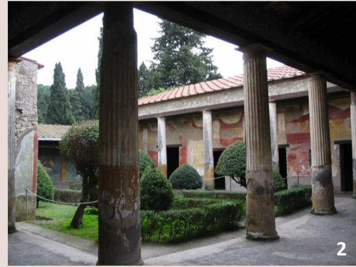
un péristyle dans une maison romaine

A l'origine, les Romains empruntent cet élément d'architecture aux temples grecs , dont certains étaient entourés sur leurs 4 côtés par une colonnade, le péristyle .