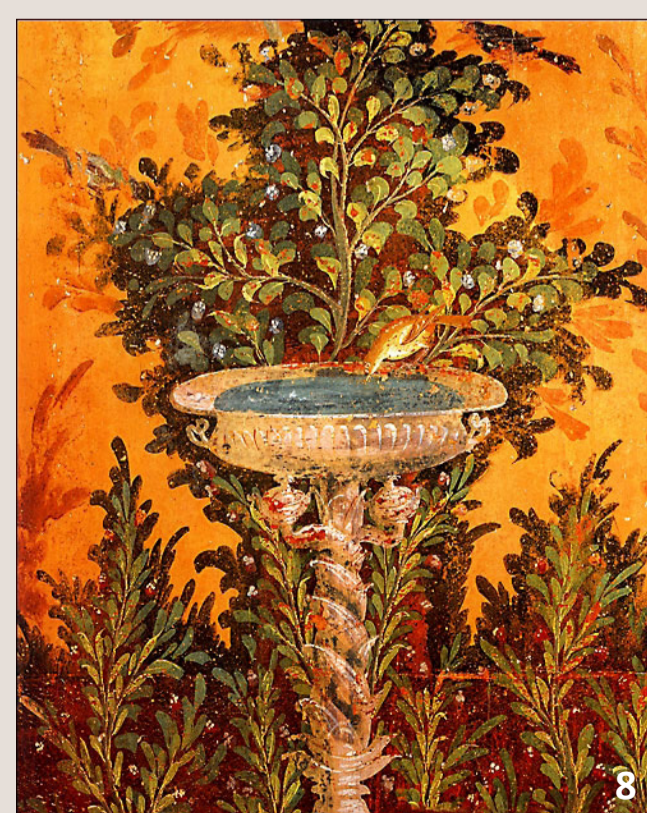
une fresque ornant les murs d'un péristyle

Les colonnes de la galerie sont souvent peintes avec des teintes vives , et les murs sont décorés de fresques : simples aplats de couleurs, scènes mythologiques ou encore motifs en trompe-l'œil créant l' illusion de la nature qui se prolonge jusque sur les murs de la maison.