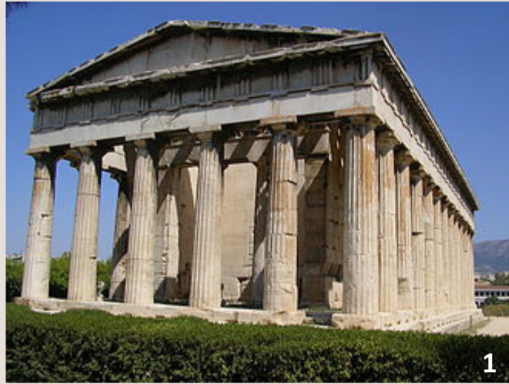
un temple grec à péristyle

A l'origine, les Romains empruntent cet élément d'architecture aux temples grecs , dont certains étaient entourés sur leurs 4 côtés par une colonnade, le péristyle .