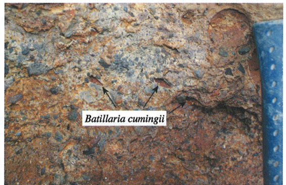
図5. 採集地点OG-02の化石産状.