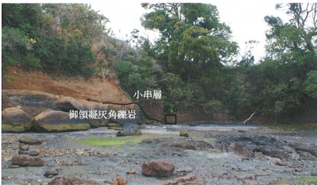
図4. 採集地点OG-02の露頭と図5の位置.