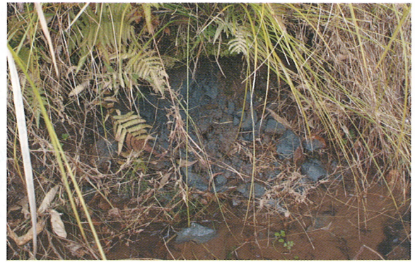
図3. 化石採集地点の露頭