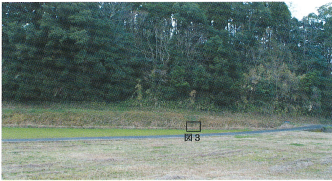
図2. 採集地点OG-01の露頭と図3の位置.