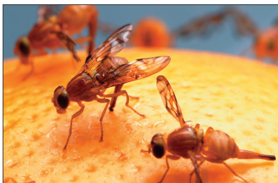
Figura 1.-Hembras de Anastrepha ludens realizando la puesta en pomelo. Obsérvense los característicos dibujos alares y la longitud del oviscapto con que consiguen depositar los huevos en el interior del fruto.

Las larvas de esta especie (Figura 2) son muy parecidas a las de otras moscas de la fruta, y hay que recurrir a caracteres microscópicos para su identificación.